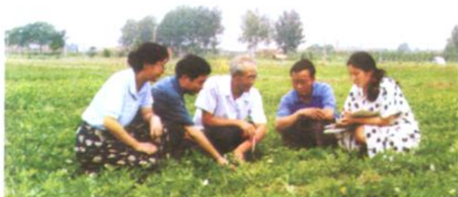
我所花生研究人员 在试验地观察