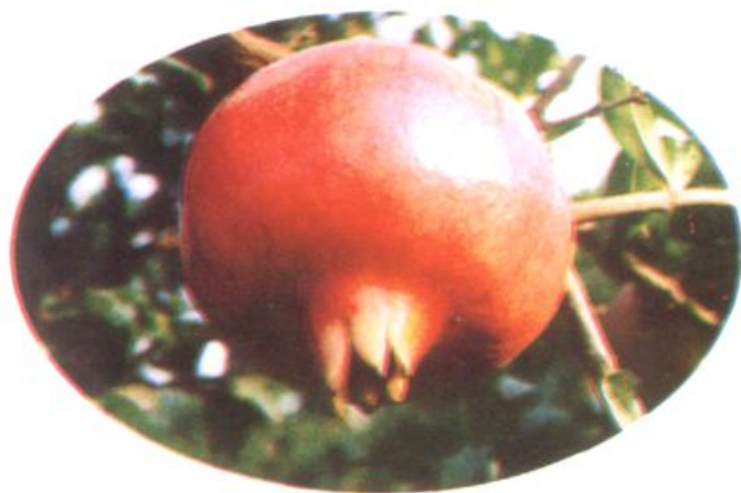
河南省鉴定新品种豫石榴一号