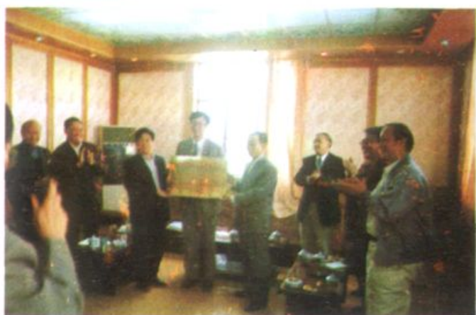
张家顺副市长、省市科 委、引智办领导为我所 “引进国外高效农业示 范点”挂牌