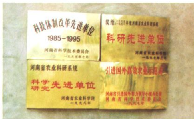
所“八五”以来获得的部分奖牌