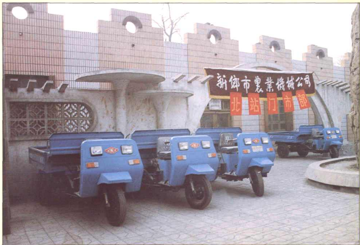
新乡市农机公司北站门市部