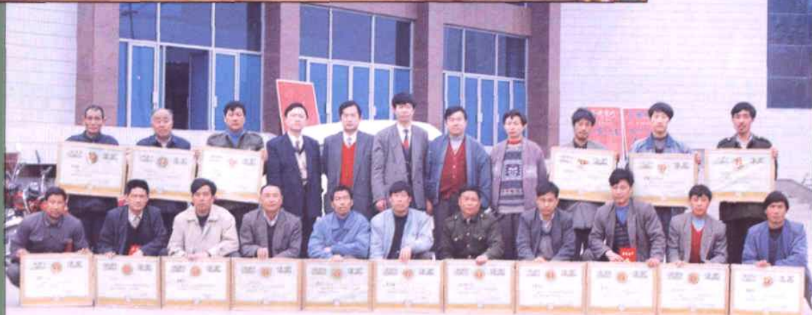
部分获奖单位及个人