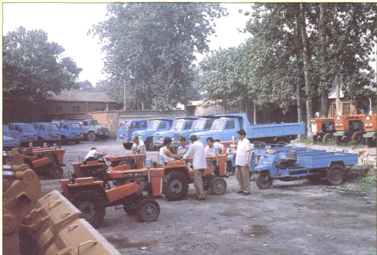
新乡市北站区农机销售市场