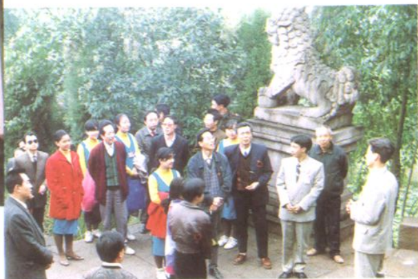
来宾参观园觉洞, 学生导游