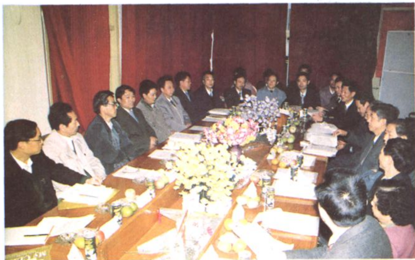
学校领导和省、市、县领导在一起