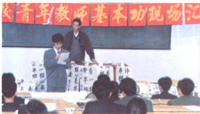
青年教师现场汇报