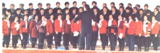
教职工齐唱《浏阳河》