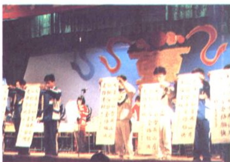
现场挥毫,当众展示