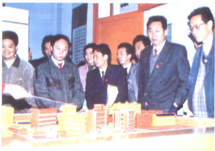
领导参观校区模型