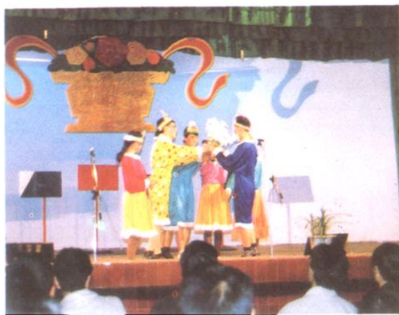
演出自编的《长方形过生日》