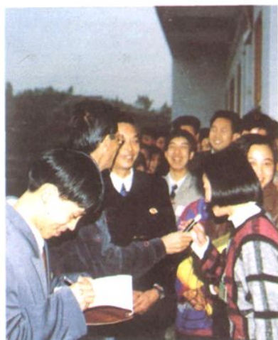
学校记者团现场采访