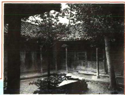
甘洛县胜利乡中心小学 校(原越嵩县私立斯补边民 小学)旧貌新颜