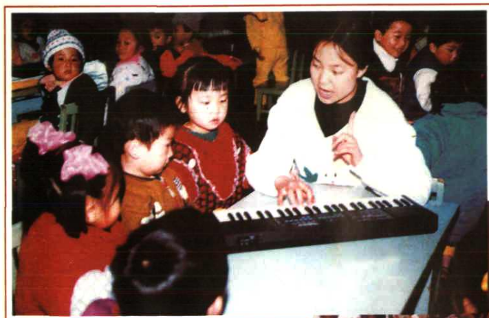
西昌市一职中幼儿师范专业学生，在本校附设幼儿园实习