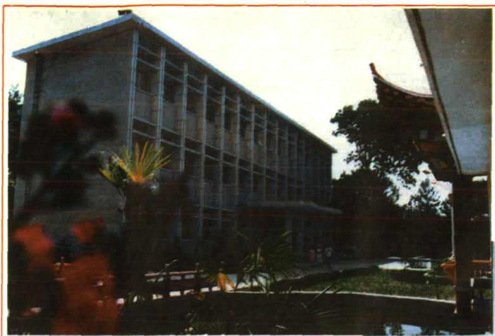
西昌师范专科学校图书馆