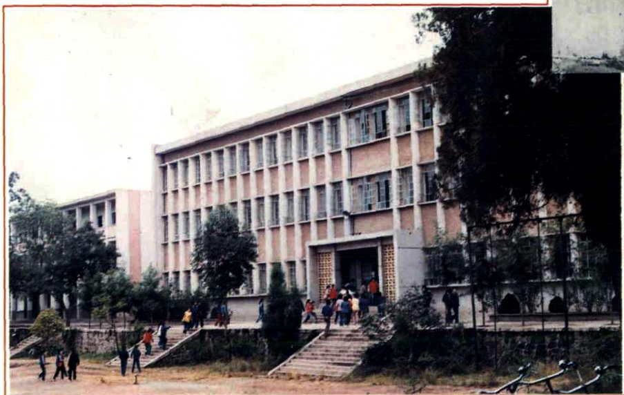
四川省西昌二中(原研 经书院)今昔