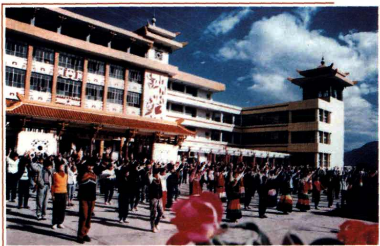
四川省凉山民族中学校园