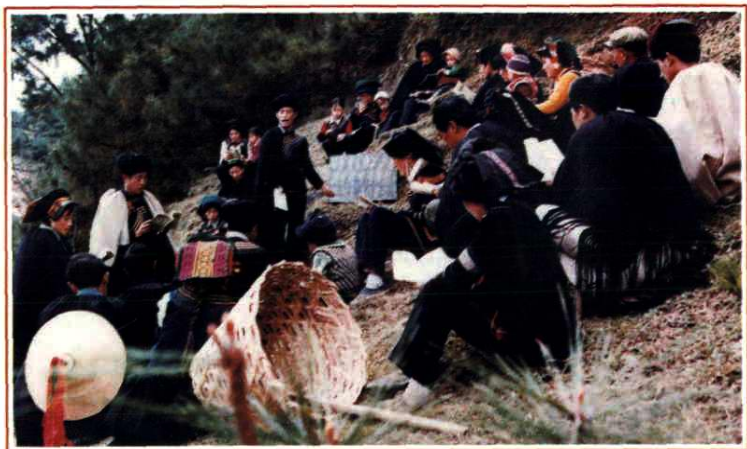
昭觉县农民文化技术 学校正在田间上课