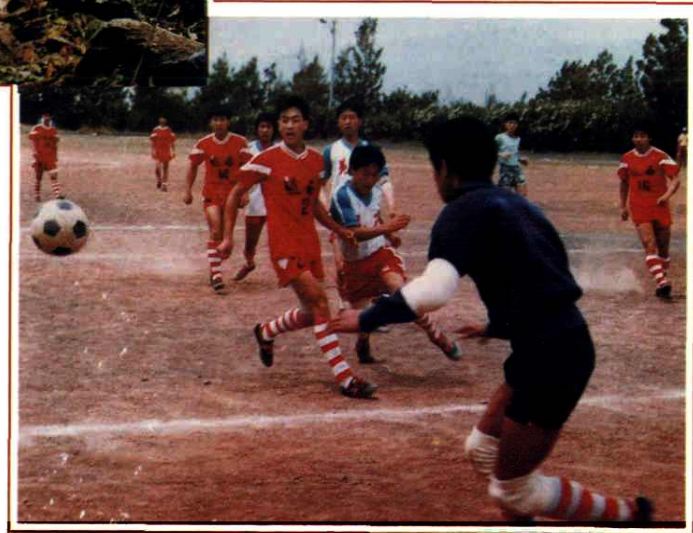
凉山州中学生足球赛