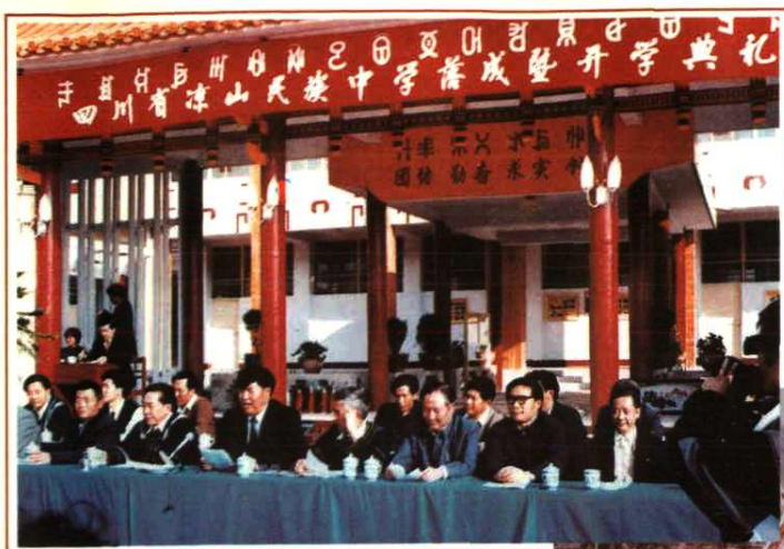
四川省副书记冯元蔚、凉山州委书记刘绍先、州长马开明等省、州领导出席凉山民族中学开学典礼（一九九零年）