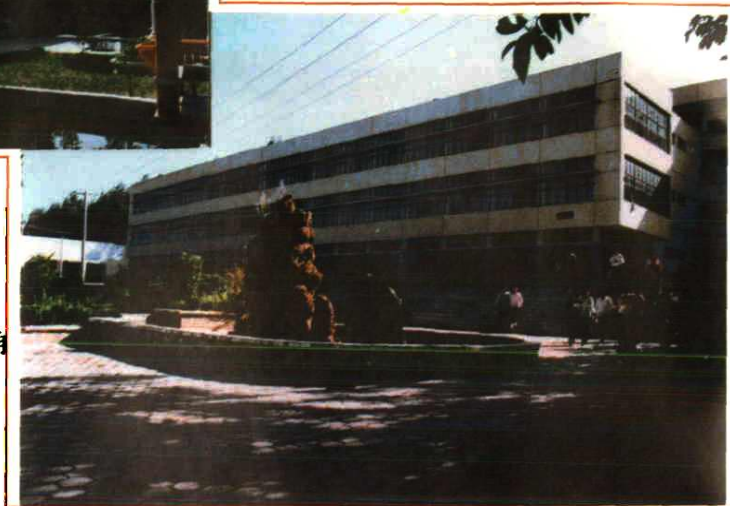
西昌农业专科学校校园一角