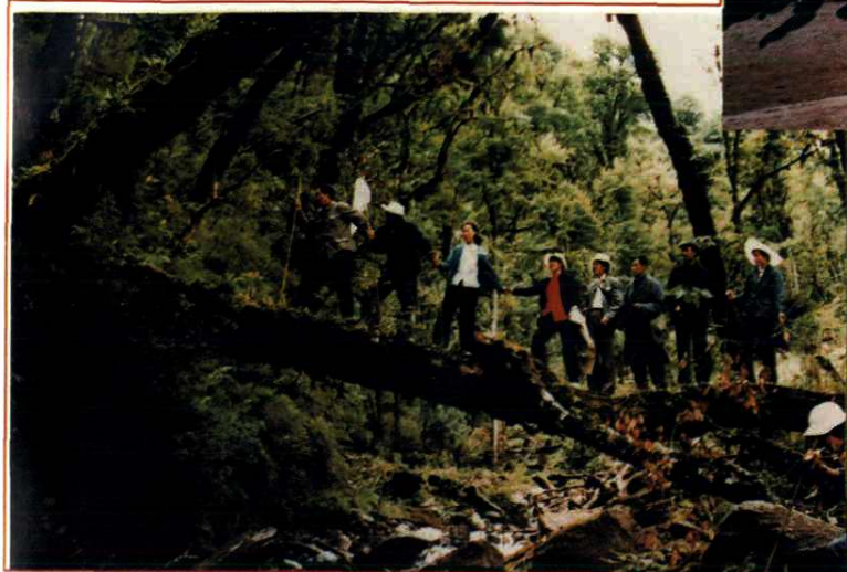
越西中学教师到野外采集标本