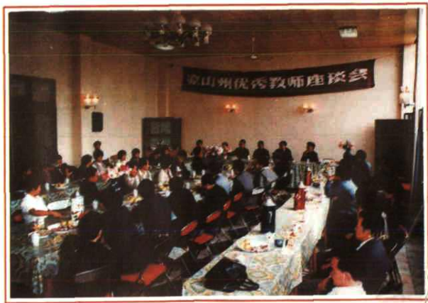
凉山州庆祝第一个教师节，召 开全州优秀教师座谈会