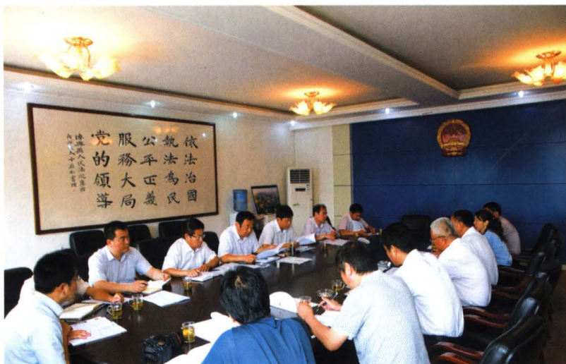
市人大常委会副主任 冯黎明调研法院工作