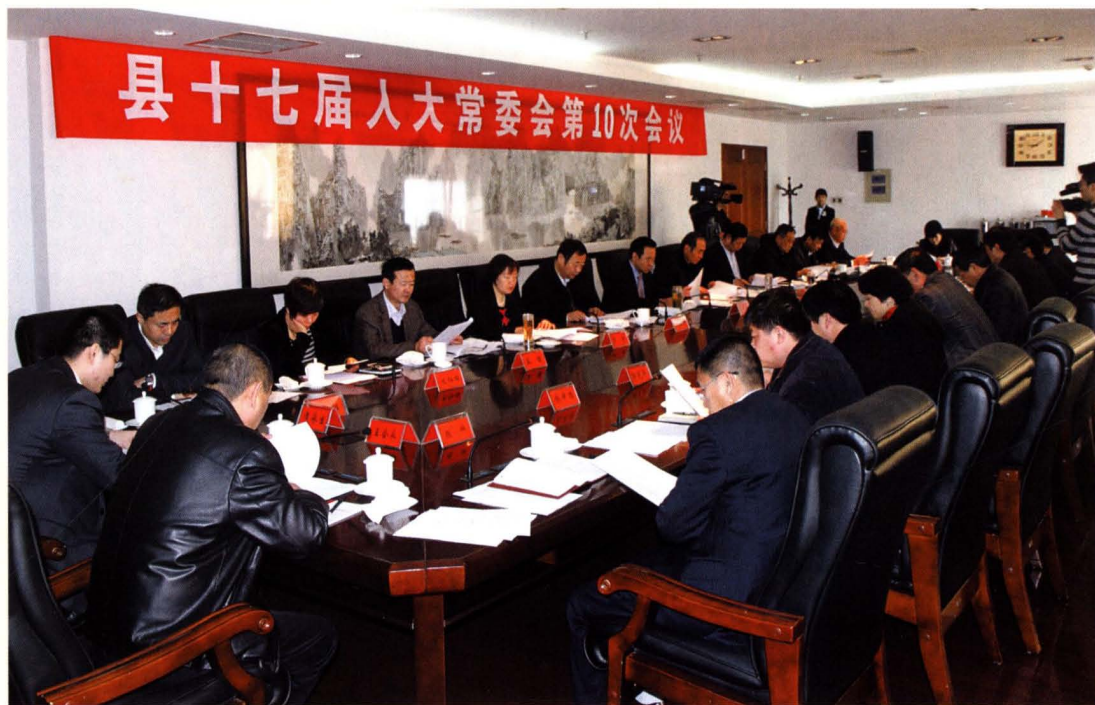
县十七届人大常委会第十次会议