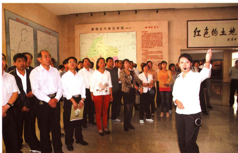
县人大常委会组织 人大代表参观渤海革命 纪念馆