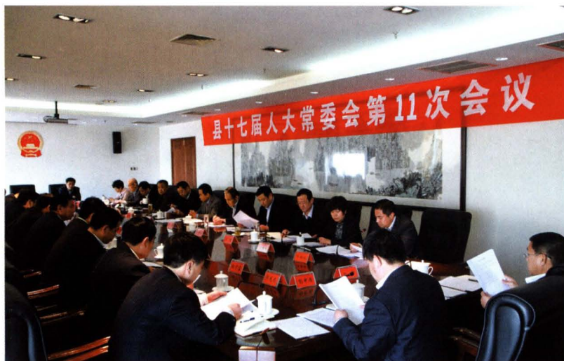
县十七届人大常委会第十一次会议