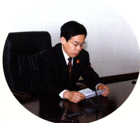
拟任命人员向常委会作供职报告