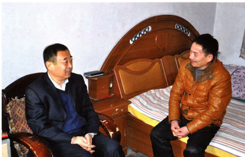
人大常委会副主任 冯黎明走访困难群众