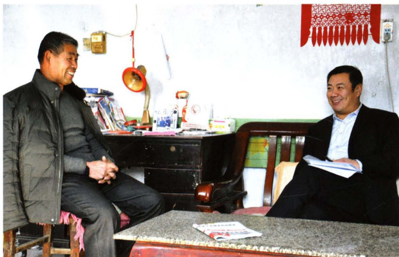
人大常委会副主任 张新生走访困难群众