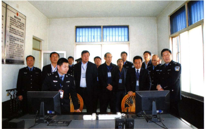
人大常委会常务副主任张光卫调研“平安和谐博兴”建设工作