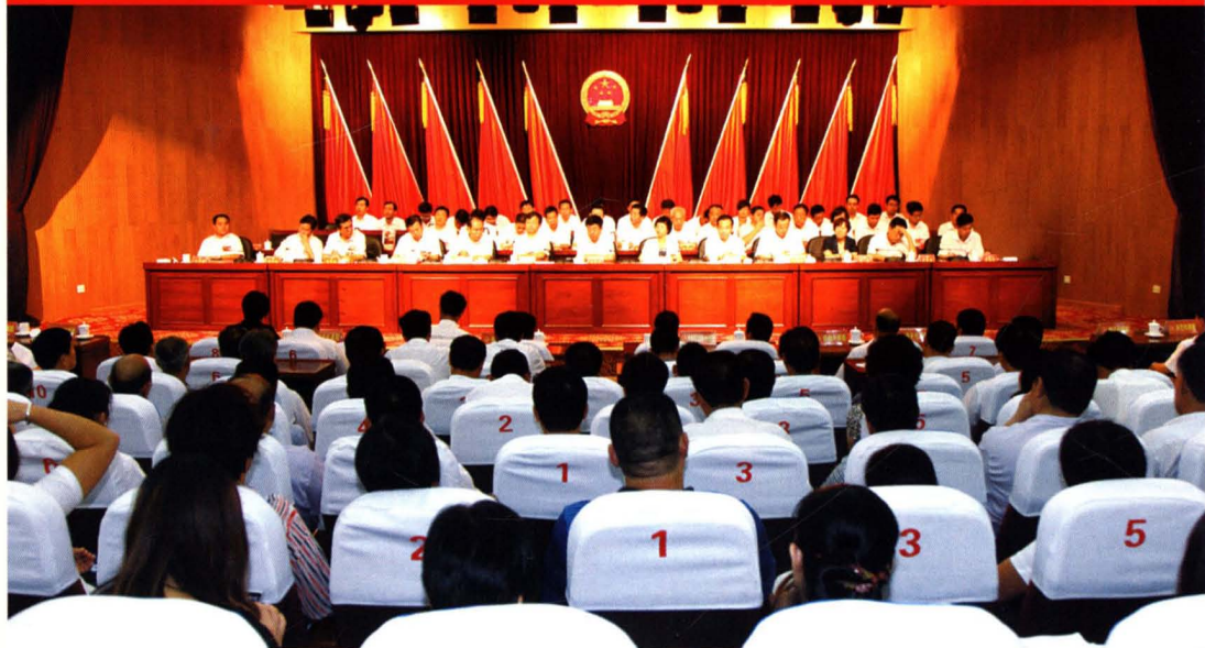
县十七届人大三次会议