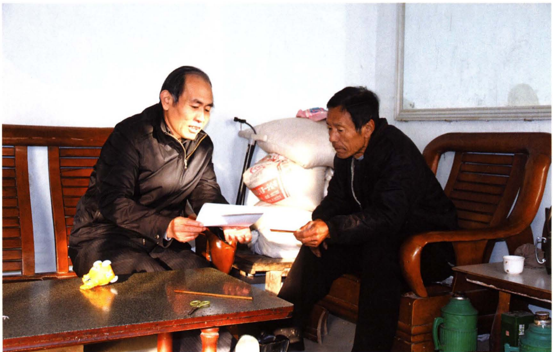
市人大常委会副主任陈继群走访困难群众