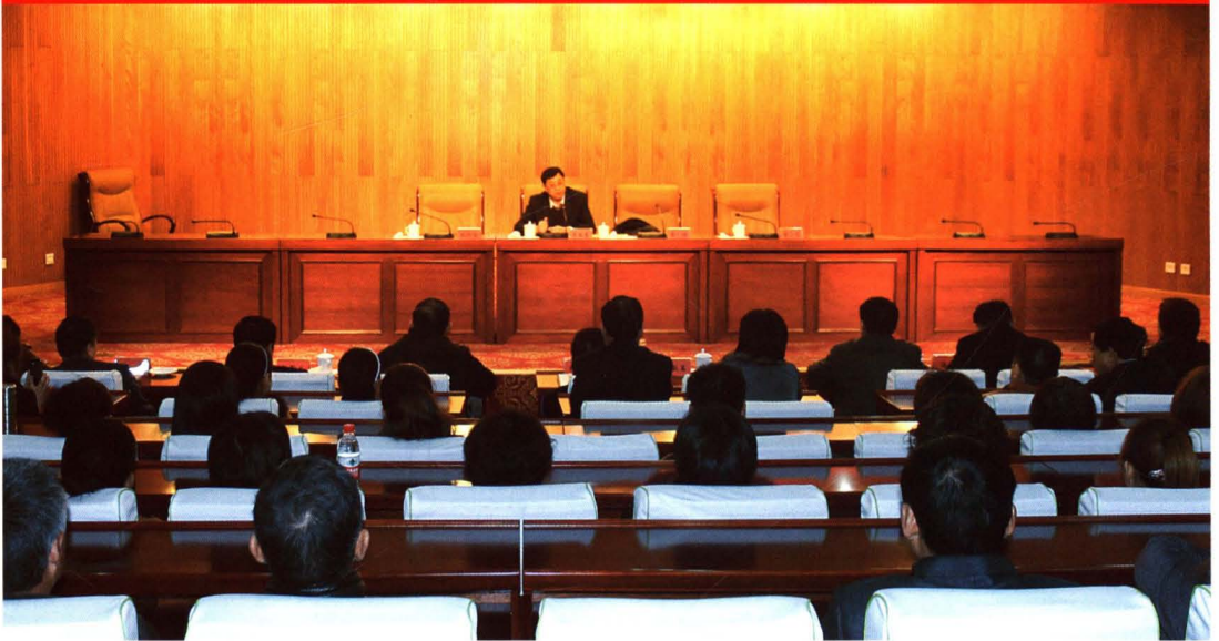
省人大常委会人代工委副主任马效东就如何写好代表议案和建议作专题讲座