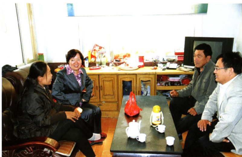
人大常委会副主任 李云走访困难群众