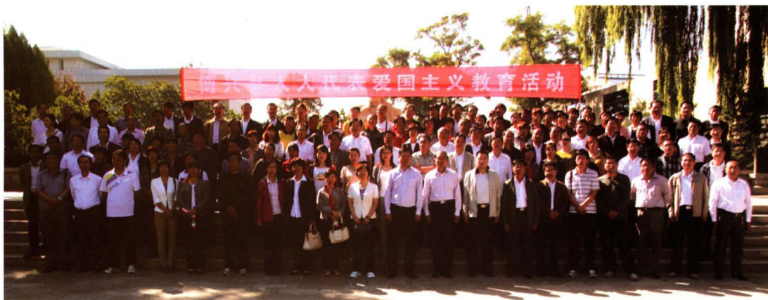
县人大常委会组织人大代表开展爱国主义教育活动