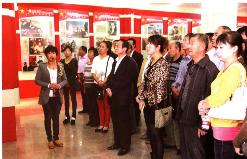
县人大常委会组织 人大代表瞻仰焦裕禄纪 念馆