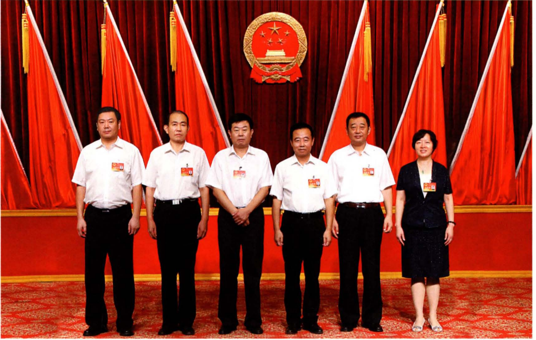
县十七届人大常委会领导班子