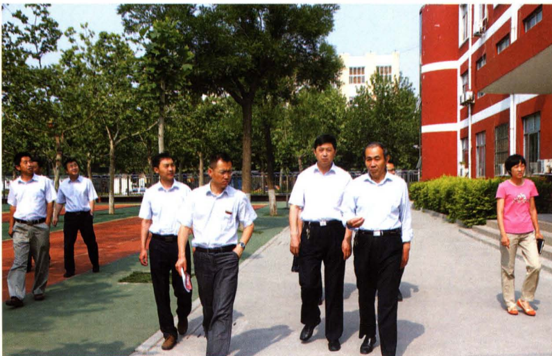
人大常委会副主任陈继群调研学校规范化建设