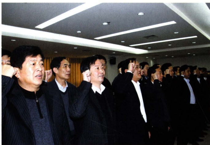
新一届政府组成人员就职宣誓