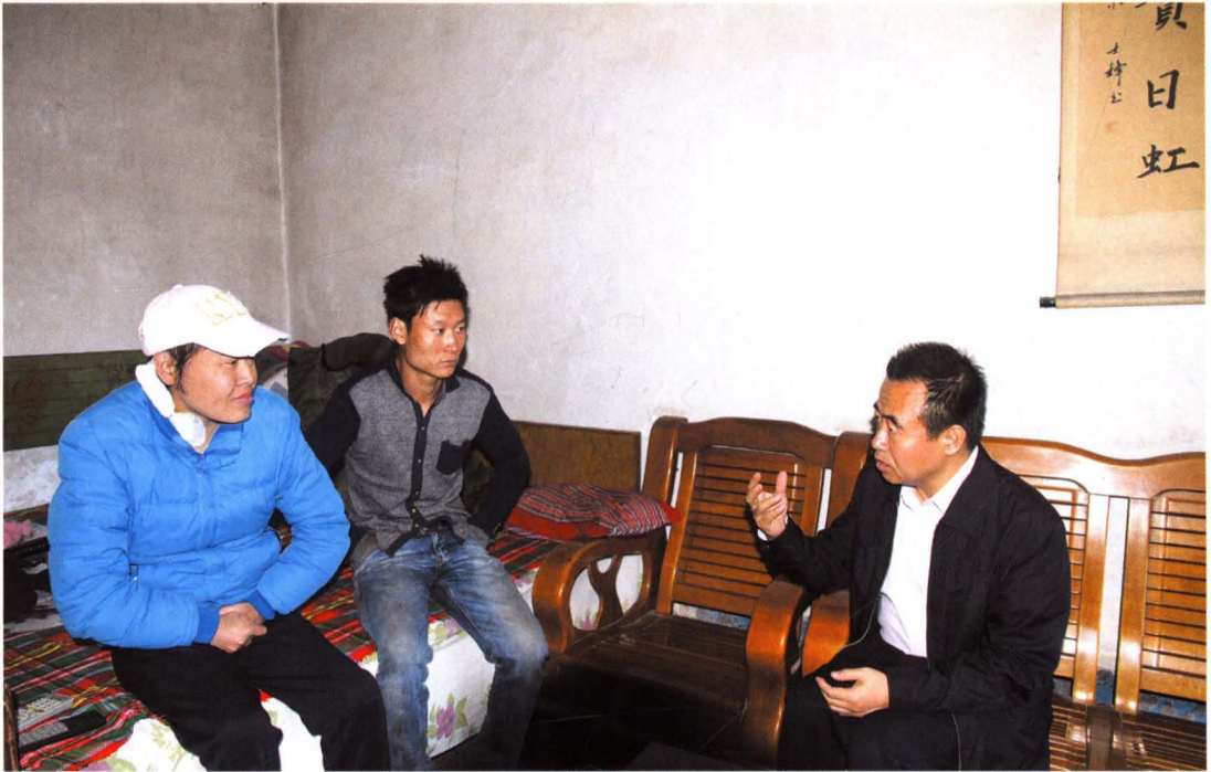
市人大常委会常务副主任张光卫走访困难群众