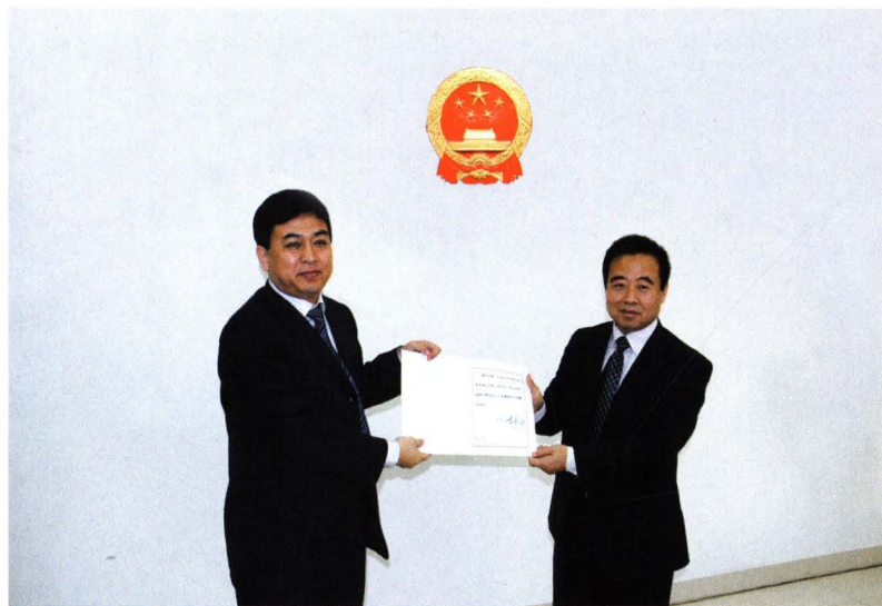
人大常委会常务副主任张光卫向被任命人员颁发任命书