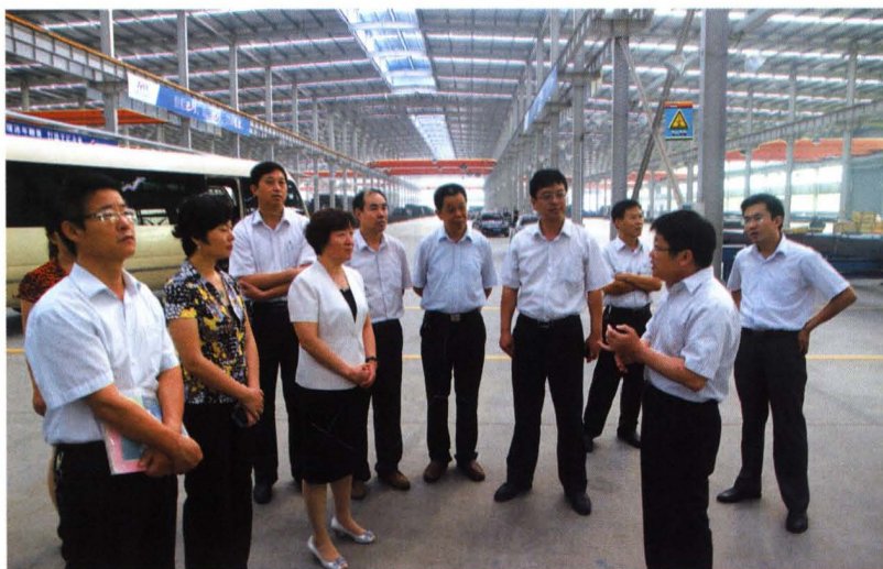
市人大常委会副主任 李云检查科技“一法一条 例”贯彻实施情况