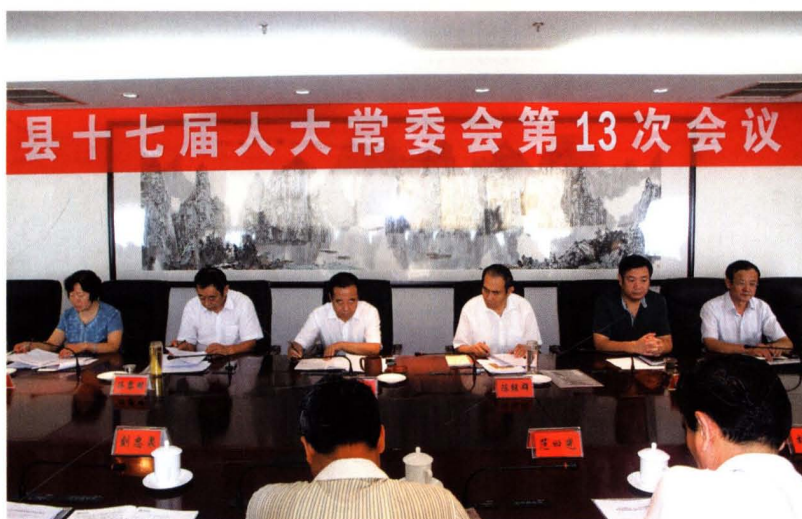
县十七届人大常委会第十三次会议