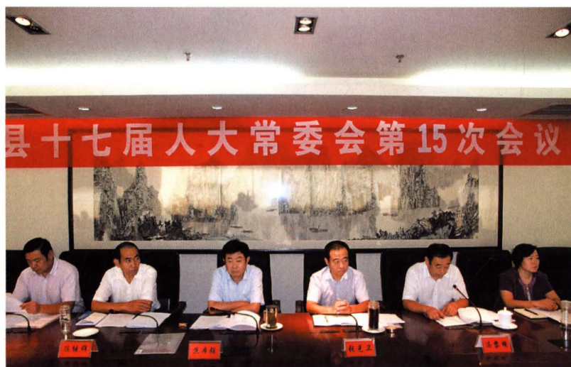
县十七届人大常委会第十五次会议