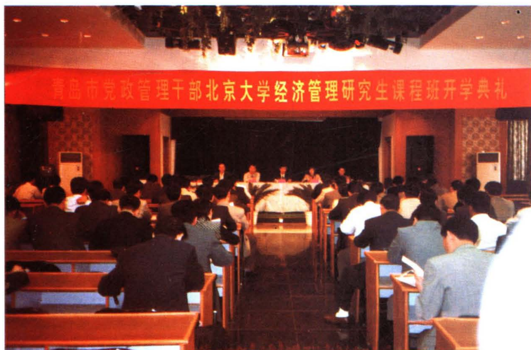
市人事局与北京大学联合举办的研究生课程进修班开学。