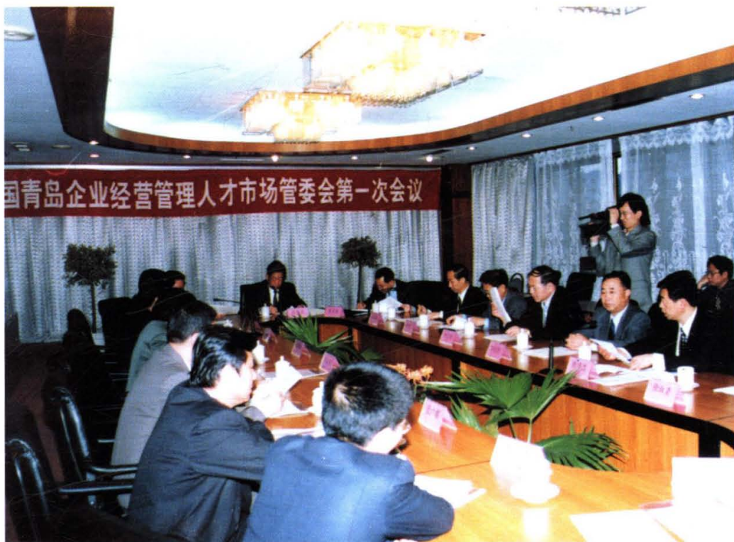
1999年10月25日，中国青岛企业经营管理人才市场管理委员会第一次会议在市政府会议中心召开，王家瑞市长任管委会主任。