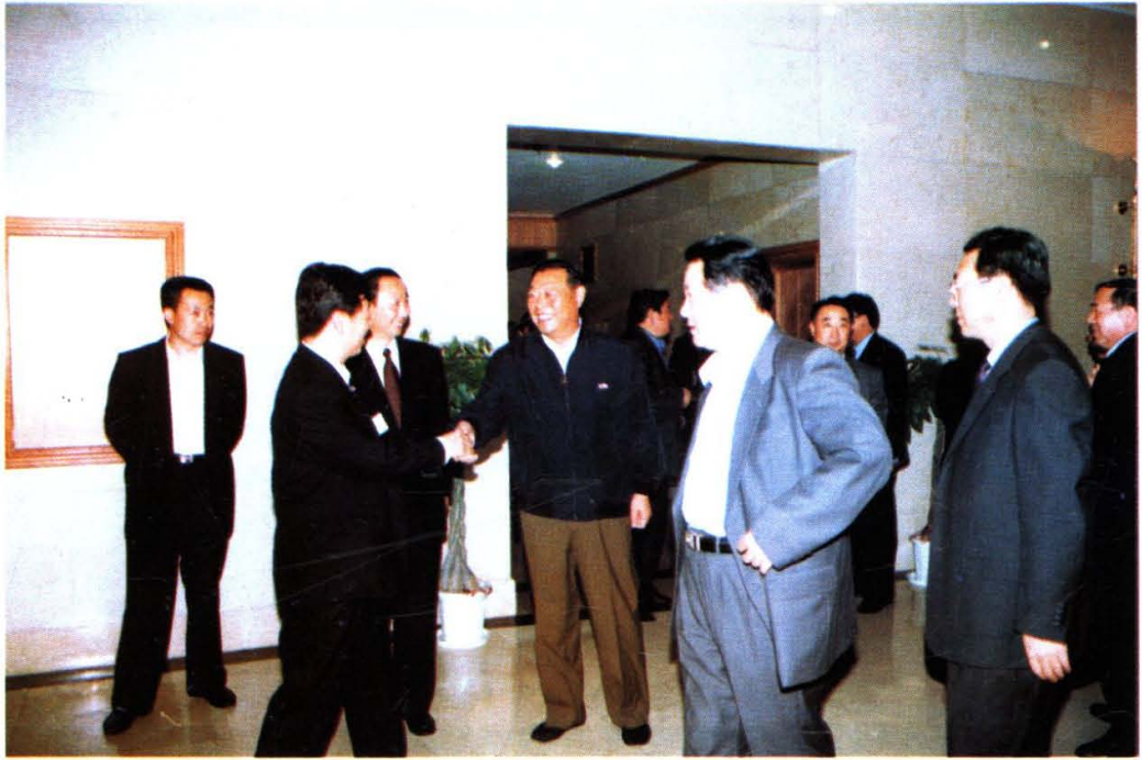
1999年10月25日山东省委副书记、省长李春亭（中）在府新大厦与国家人事部、省人事厅及青岛市的有关领导座谈人事工作。图为座谈会后李春亭省长与局长张泽忠等握手话别。