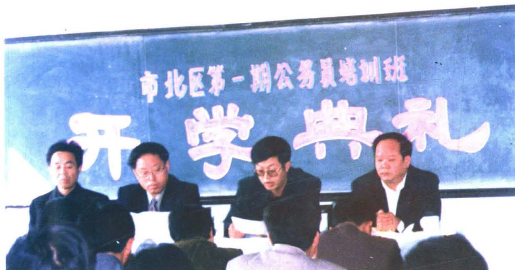
市北区加大公务员培训力度，努力提高公务员队伍整体素质。图为市北区第一期公务员培训班开学，市人事局副局长吕万锦（左二）出席开学典礼。