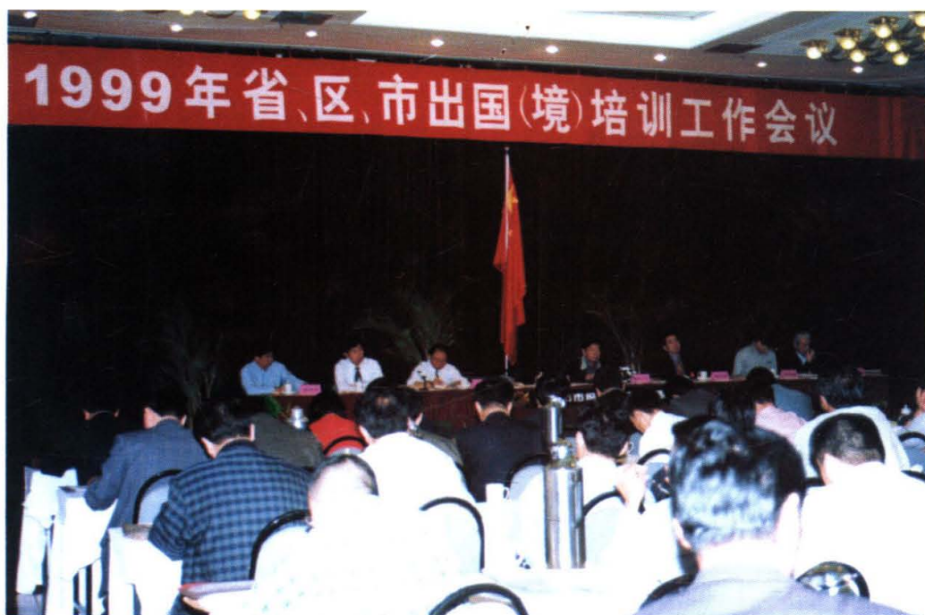
1999年10月14日，国家外国专家局主办的各省市出国（境）培训工作会议在青岛举行。