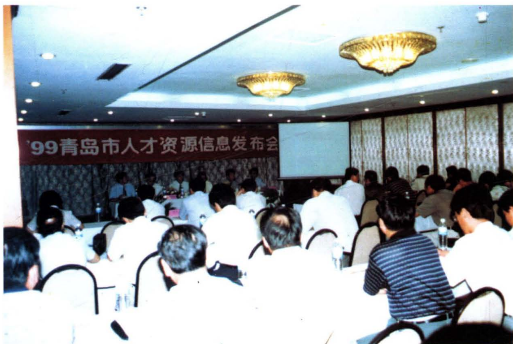
1999年8月6日，市人事局在市政府会议中心举行99年全市人才资源信息发布会，标志着我市正式建立了人才资源信息发布制度。