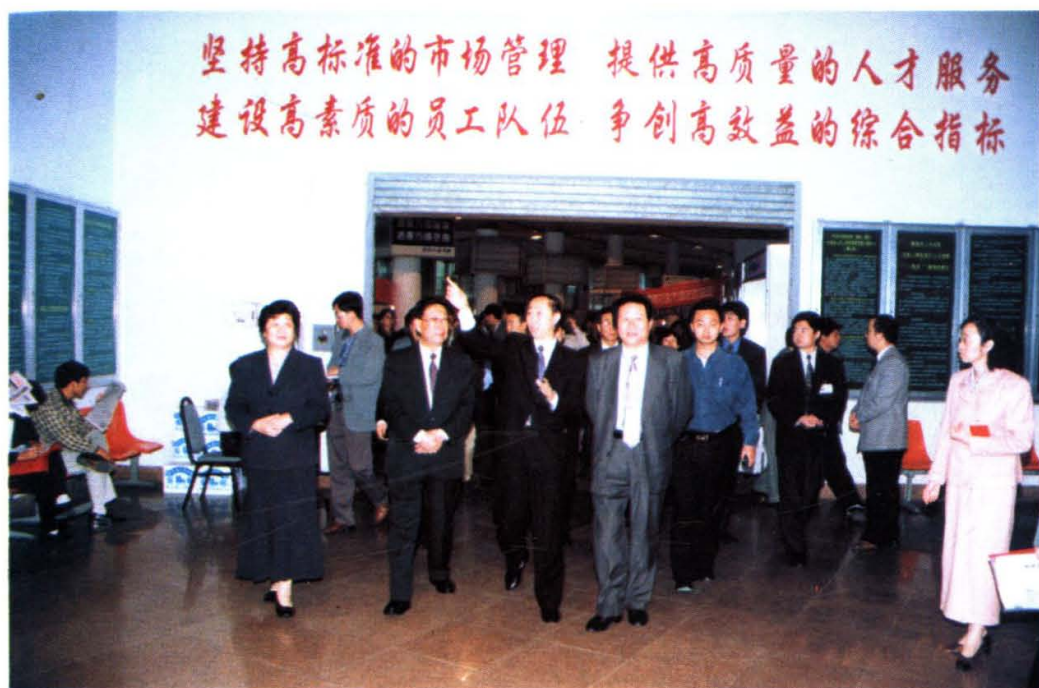
国家人事部党组副书记、副部长张学忠（前左二）、山东省副省长林廷生（前右一）在市委副书记、市长王家瑞（前右二），市人大常委会副主任朱庆兰（前左一）等领导陪同下，视察我市人才市场建设情况。