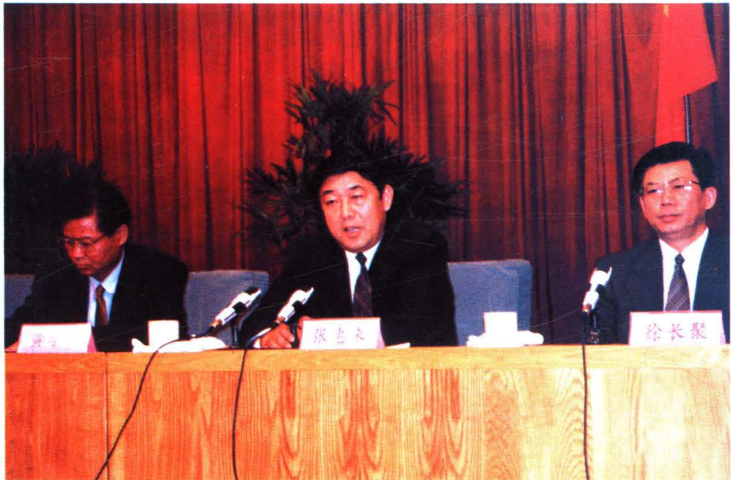
在全市军转干部安置工作会议上，省委常委、市委书记张惠来（中）强调，一定要从国家大局、从讲政治的高度，确保军转安置任务的完成。市委副书记徐长聚（右）、黄学军（左）等领导同志出席了会议。