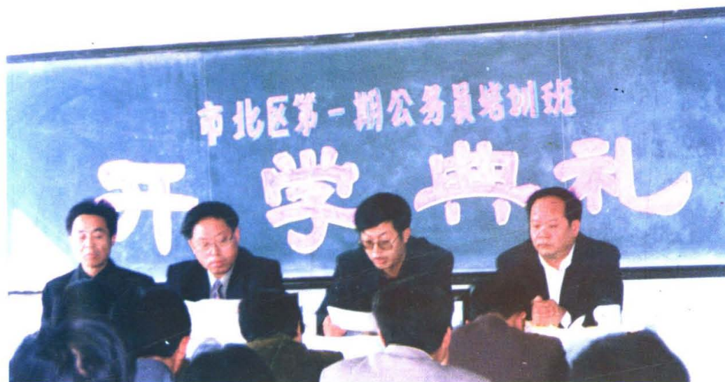
市北区加大公务员培训力度，努力提高公务员队伍整体素质。图为市北区第一期公务员培训班开学，市人事局副局长吕万锦（左二）出席开学典礼。