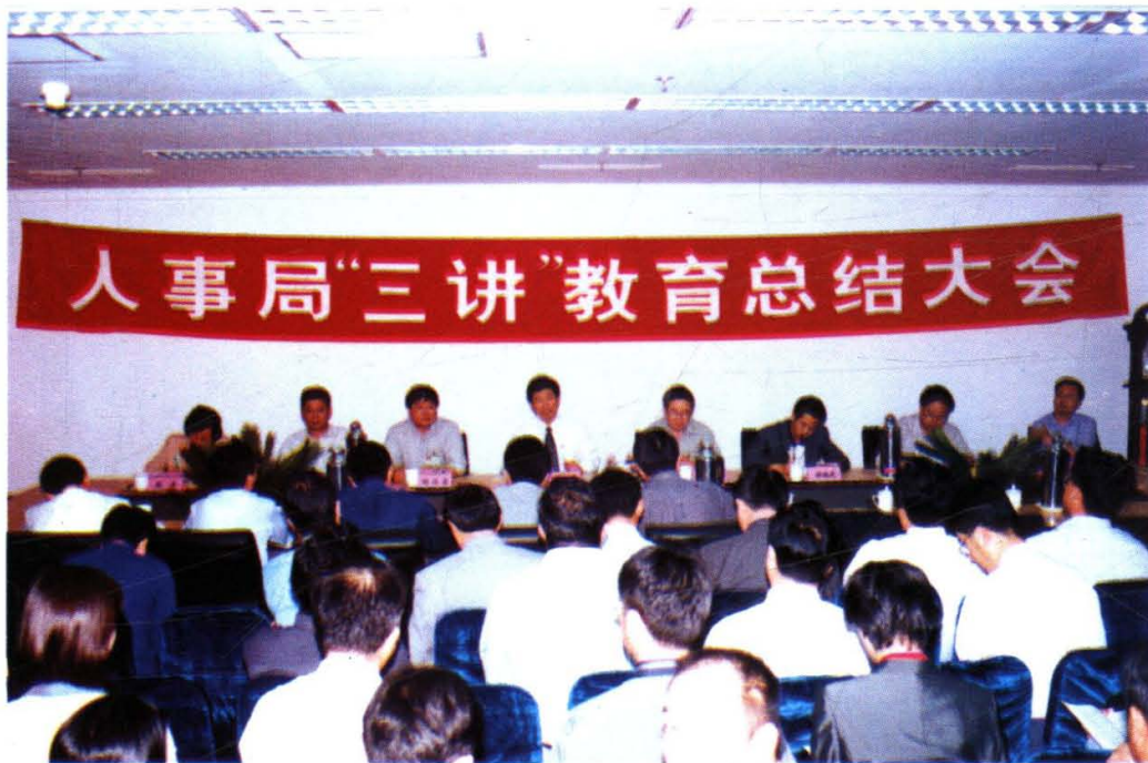
1999年7月6日至10月11日,按照中央和省、市委的安排部署,市人事局在领导班子和副处级以上干部中,以整风的精神,开展了以“讲学习、讲政治、讲正气”为主要内容的党性党风教育,取得了明显的成效。