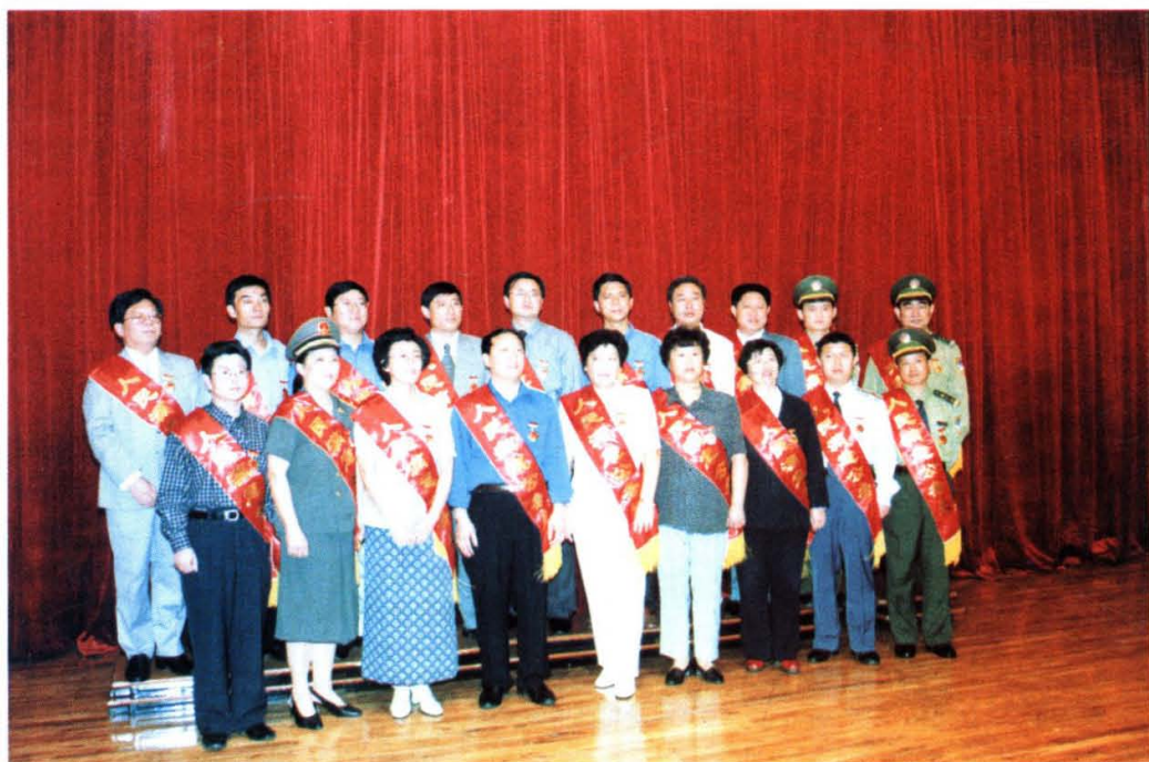
1999年国庆前夕，市委、市政府评选表彰了首批20名青岛市人民满意公务员。图为首批青岛市人民满意公务员合影。