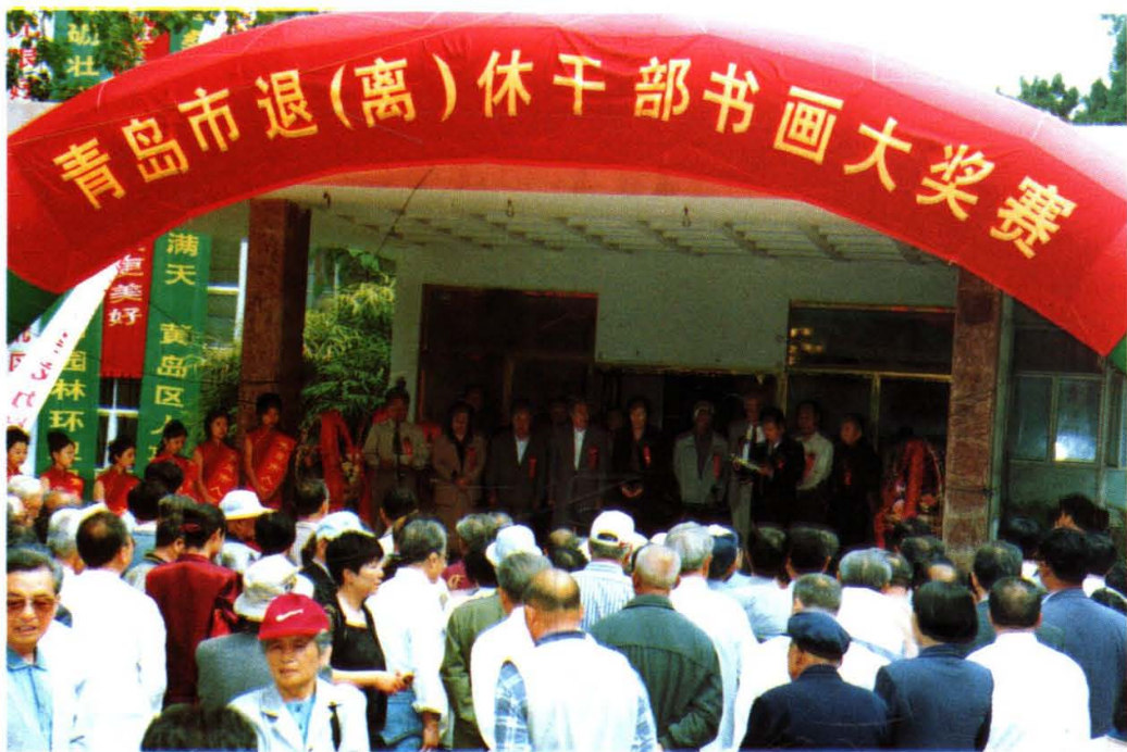
1999年6月2日,市人事局举办了青岛市离退休干部书画大奖赛,市有关领导出席开幕式。