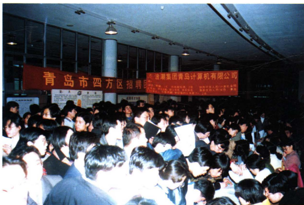
为做好大中专毕业生就业工作，市人事局积极制定优惠政策，努力拓宽就业渠道，最大限度地实现毕业生就业。图为大中专毕业生就业洽谈会的火爆场面。