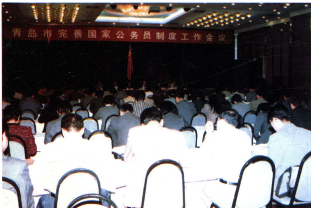
1999年，我市在完善公务员制度方面加大了力度，制定出台了若干配套法规，并召开了完善国家公务员制度工作会议。