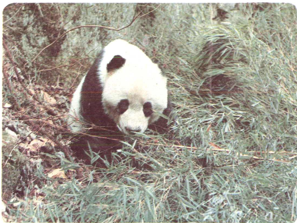
生长在唐家河保护区的大熊猫