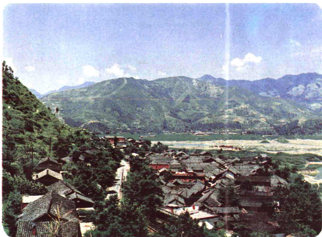
古白水郡，今沙州一隅