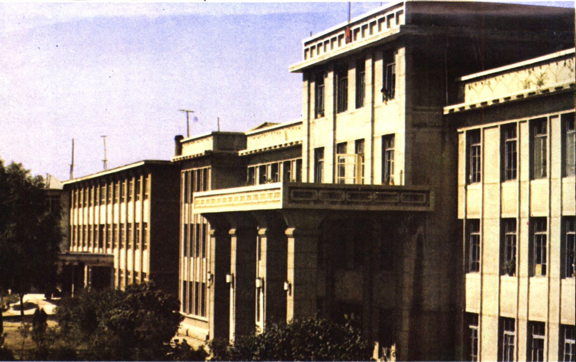
县政府、县委办公楼