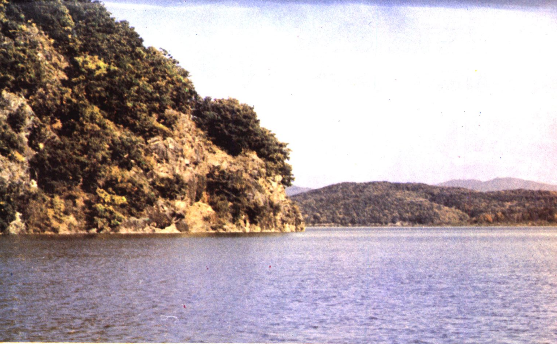
松花湖车背沟一角