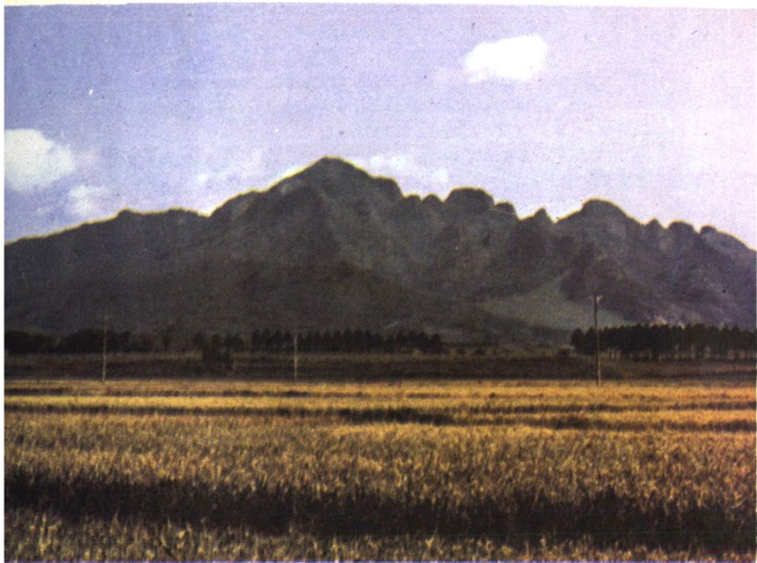
拉法砬子山穿心洞一角