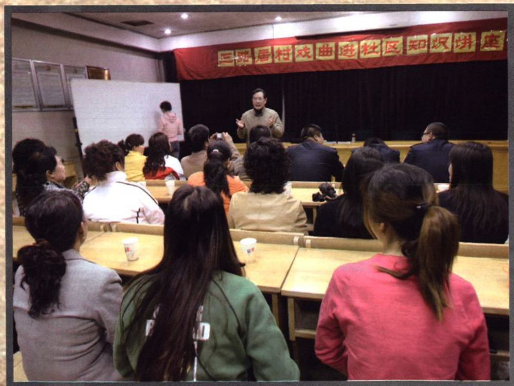
2008年中国戏曲学院教授进村为村民讲授戏曲知识