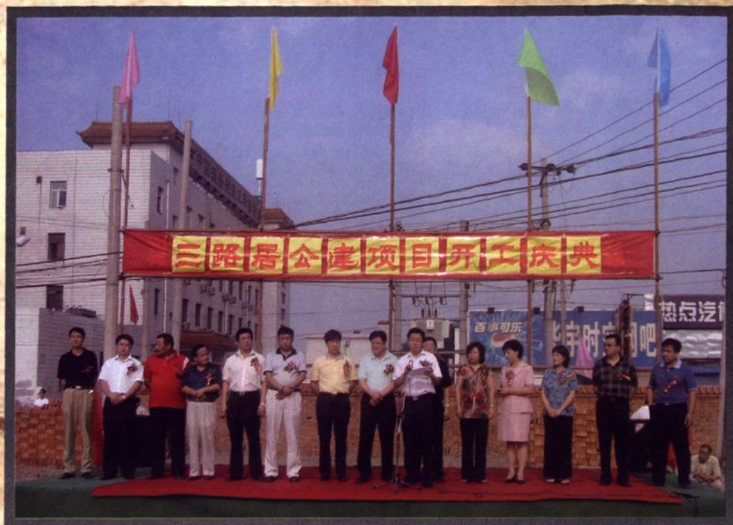
2007年7月，三路居村公共建设项目——金唐大厦开工庆典仪式