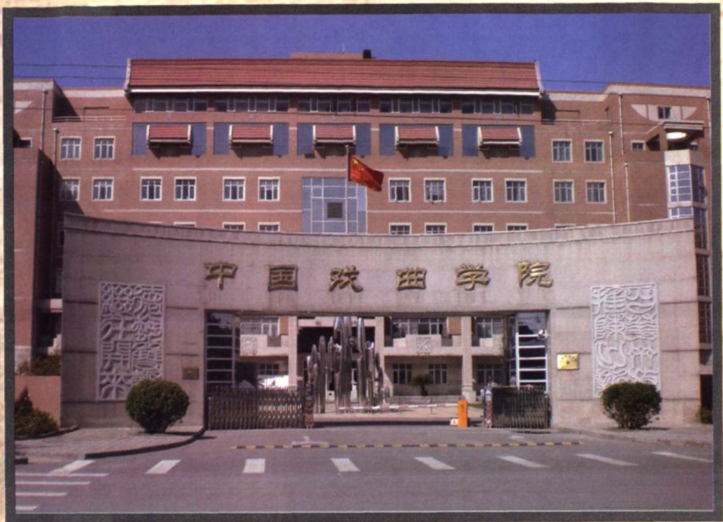
1998年入住的村南国粹艺术最高学府——中国戏曲学院