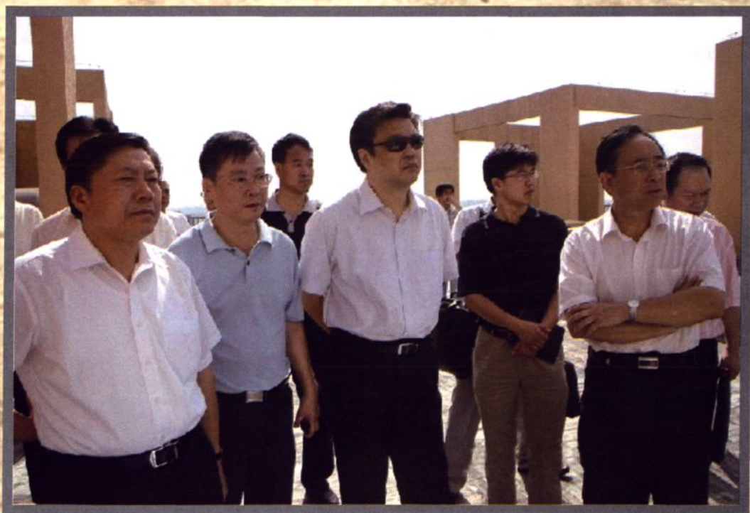
国家“十一五”期间文化发展规划纲要确立的一项重点工程，新华社金融信息平台及其产品“新华08”行将落户三路居北京丽泽金融商务区。新华社副社长鲁炜（左一）2008年8月15日在北京市副市长吉林（左三）、中共丰台区委书记张大力（左五）、乡党委书记李杜（左二）的陪同下爬上29层高的村民回迁楼鸟瞰正在规划中的丽泽金融商务区全景。