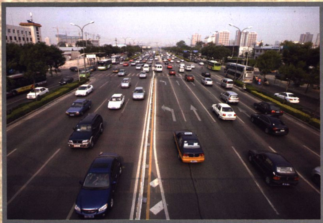
1999年9月17日建成通车的丽泽路车水马龙