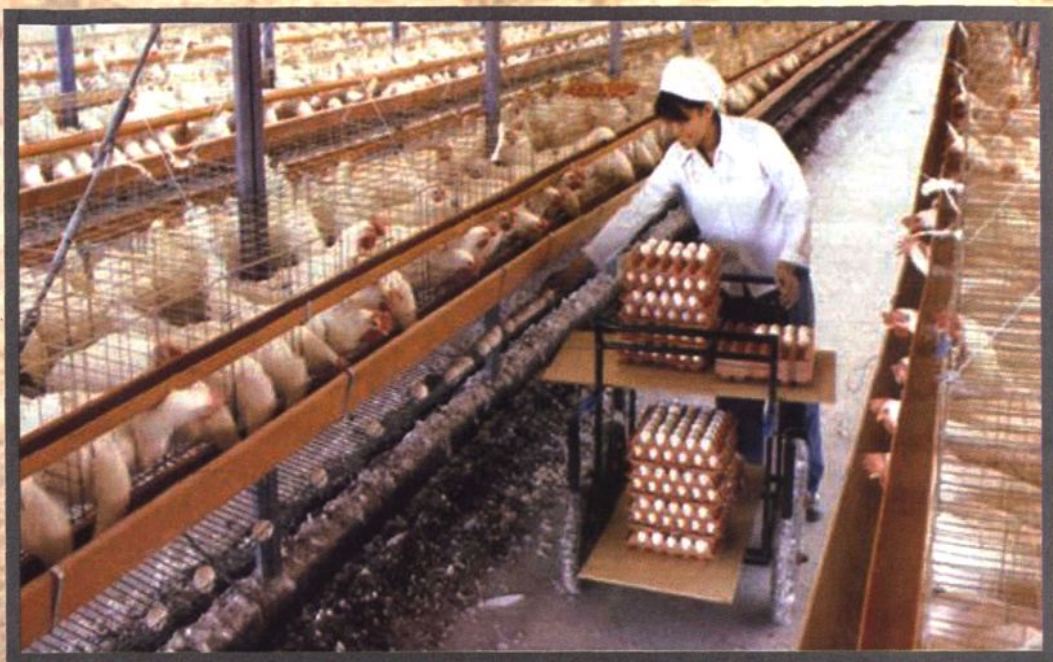
20世纪80年代10万只现代化养鸡场