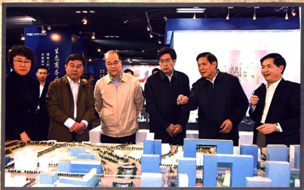
中央政治局委员北京市市委书记刘淇（右二）、北京市市长郭金龙（右三）、市人大主任杜德印（右五）在丰台区区委书记李超钢（右四）的陪同下多次到三路居北京丽泽金融商务区调研。