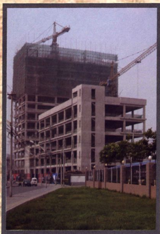
2008年建设中的丽泽金融商务区金唐大厦