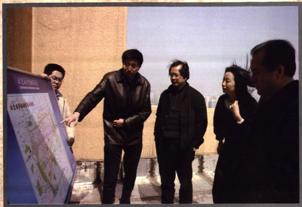
首都规划委员会和丰台规划分局的领导正在现场审议丽泽金融商务区的总体规划图