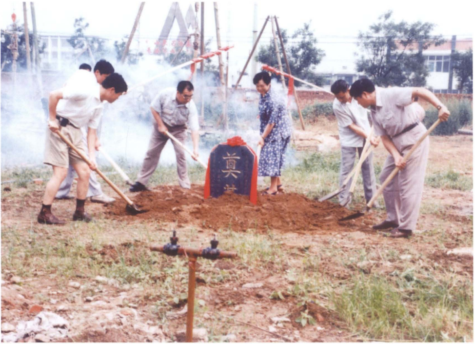
1995年8月市地税局举行办公楼奠基仪式