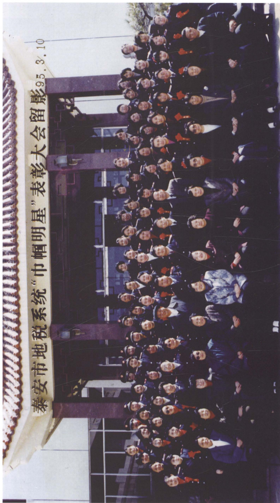
1995年3月，全市地税系统巾帼明星表彰大会合影。