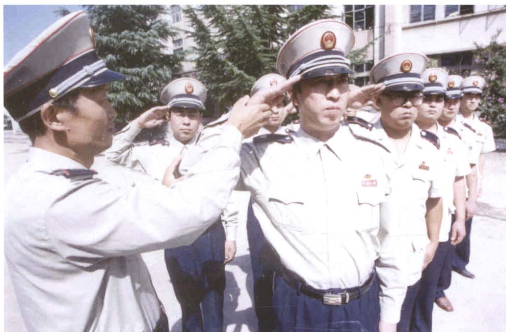
开展半军事化管理