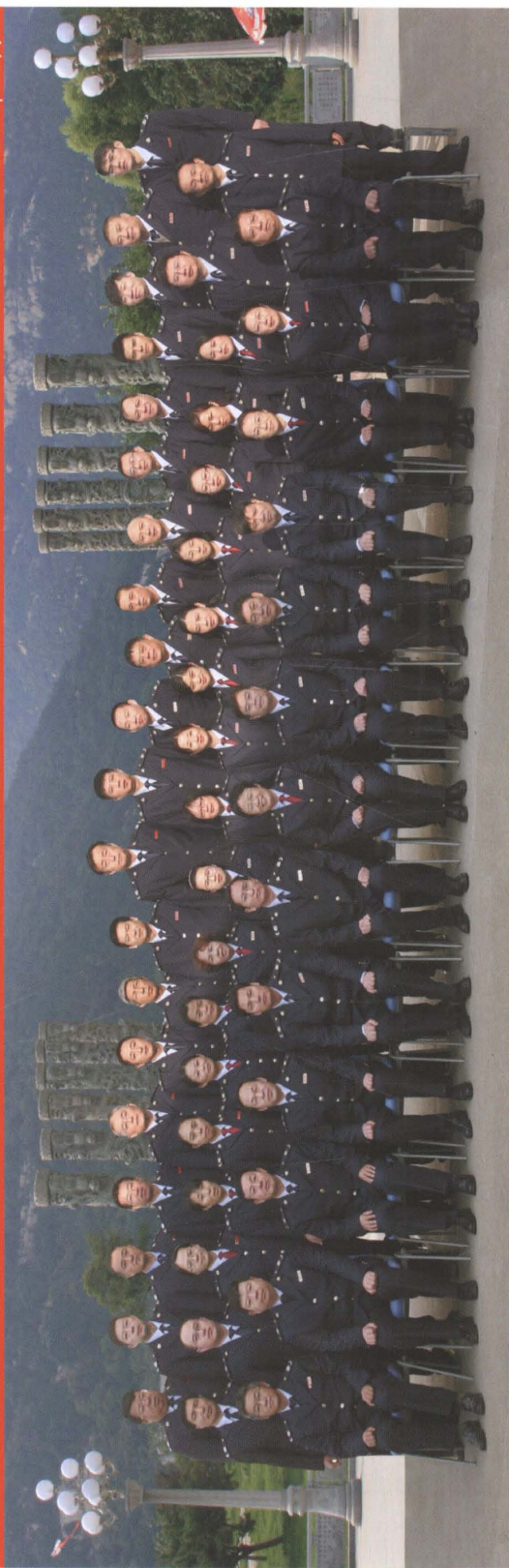
泰安市地方税务局直属征收局全体人员合影