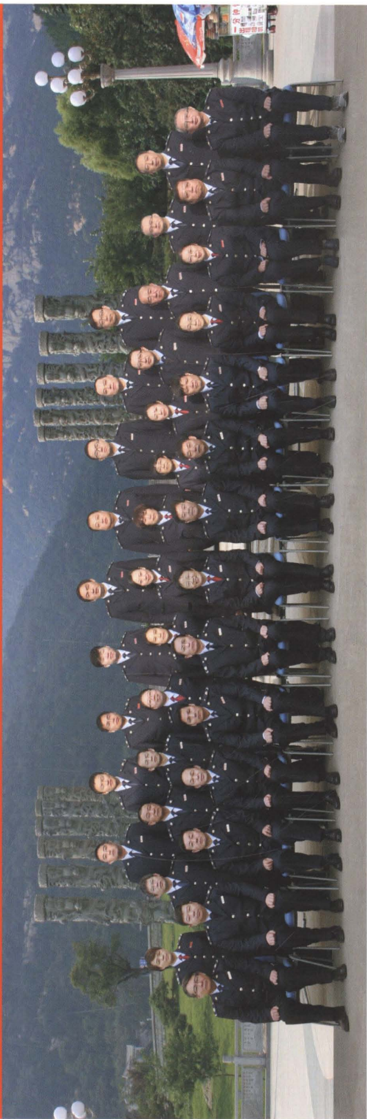
泰安市地方税务局稽查局全体人员合影