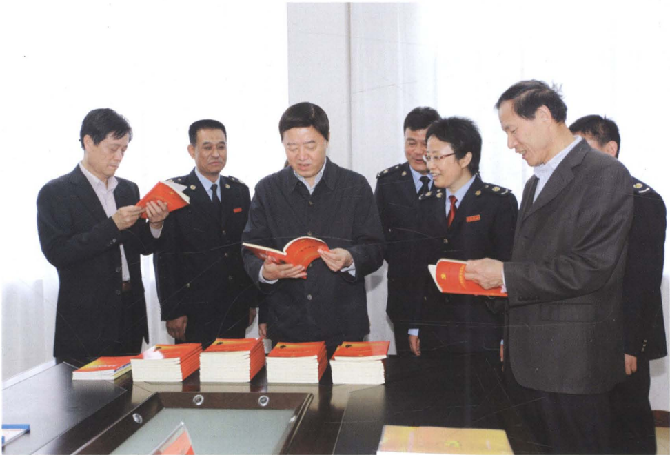
2014年4月，时任国家税务总局党组副书记、副局长解学智（左三）在省地税局党组书记、局长张洪军（左六）陪同下，视察指导泰安地税工作。