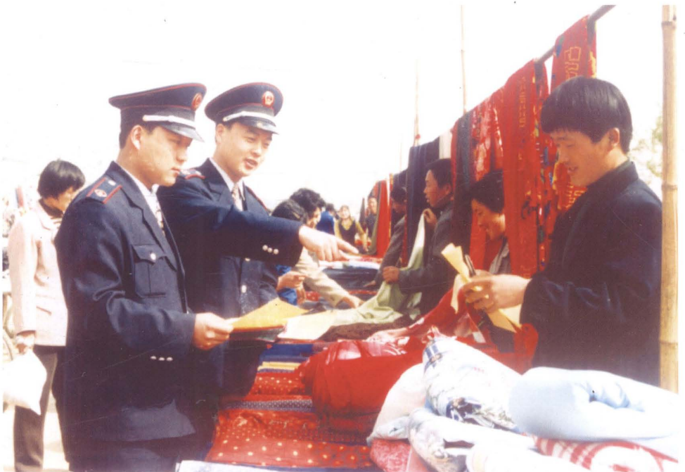
地税干部到集市上收税