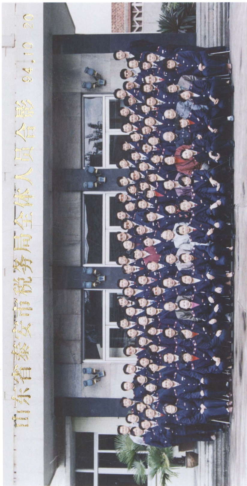
1994年10月，泰安市税务局全体人员合影。