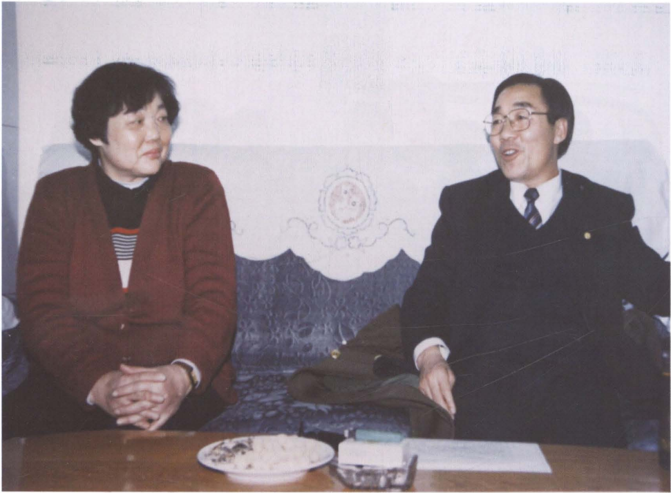
时任泰安市委书记张庆黎（右）到市地税局视察