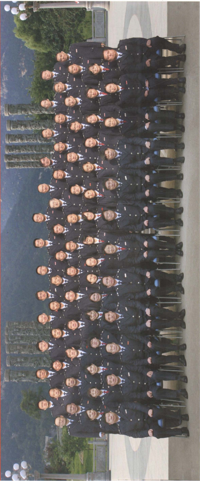
泰安市地方税务局机关全体人员合影