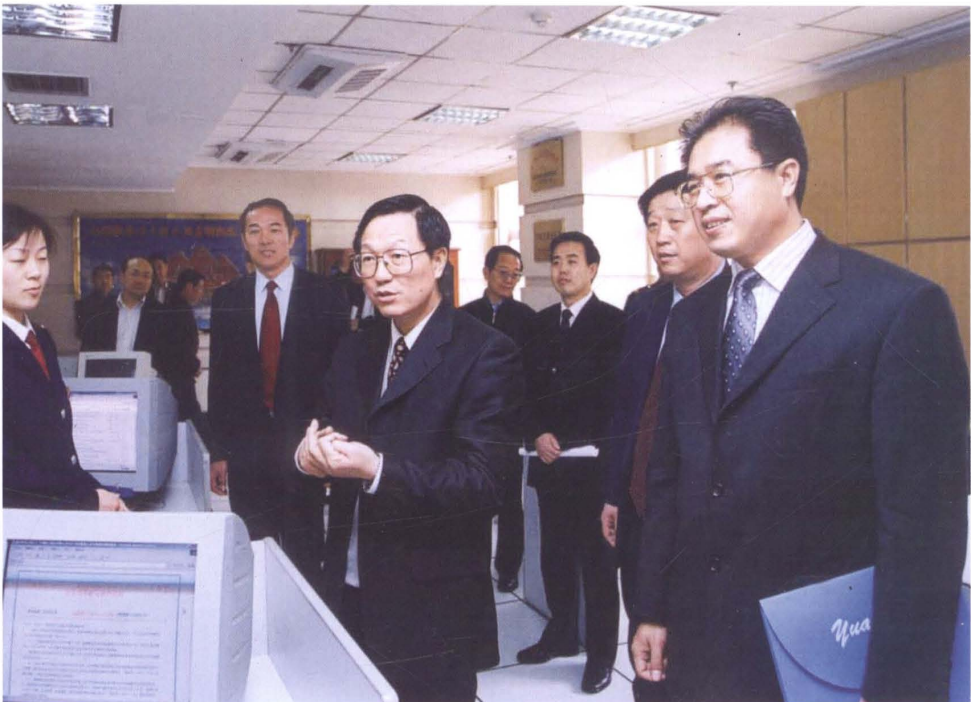
2003年4月，时任国家税务总局党组书记、局长谢旭人（右五）在时任省地税局党组书记、局长于希信（右二）陪同下，到泰安市地税局视察。