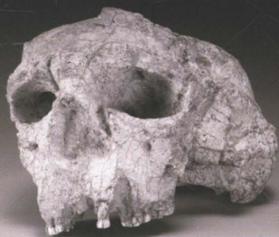
▲ 汉水流域的“郧县人”颅骨化石