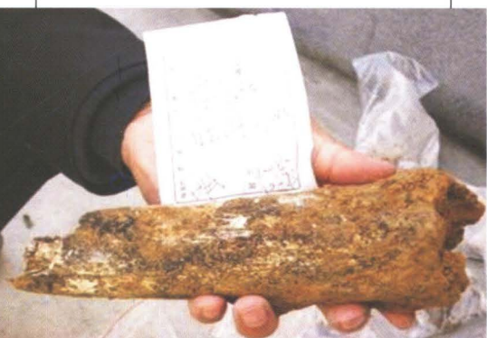
▲ 汉水流域的白龙洞猿人牙齿化石