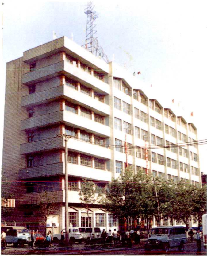
乌鲁木齐市税务局办公大楼 (天山区分局在二、三楼办公)