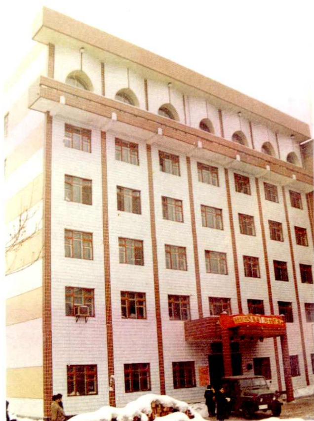
水磨沟区分局办公楼