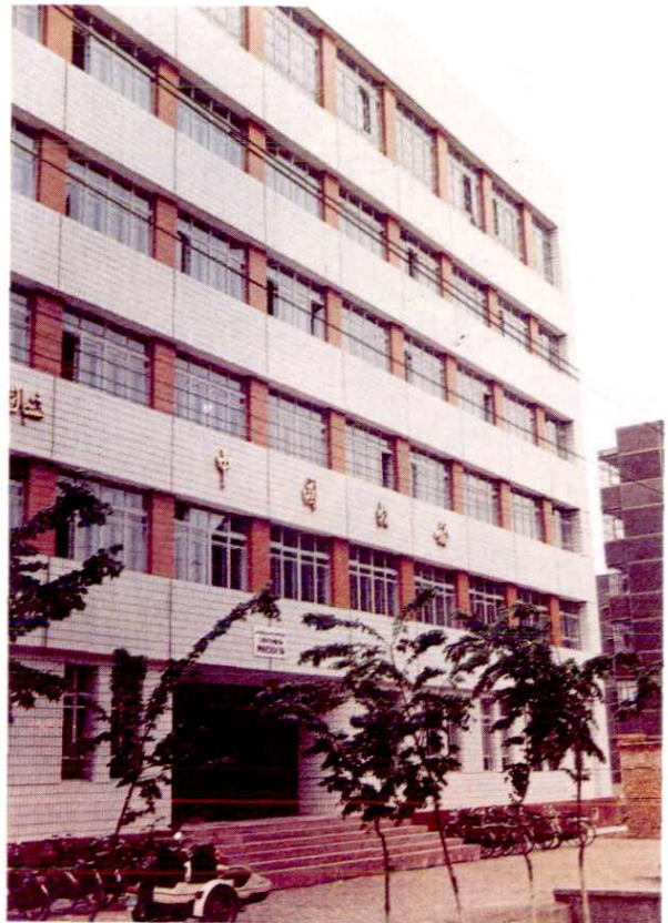
沙依巴克区分局办公楼