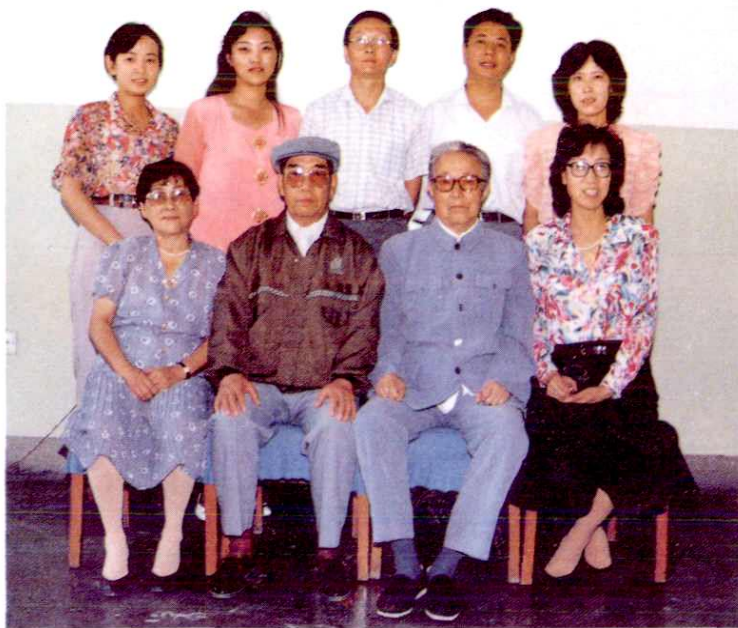
乌鲁木齐税务志办公室工作人员