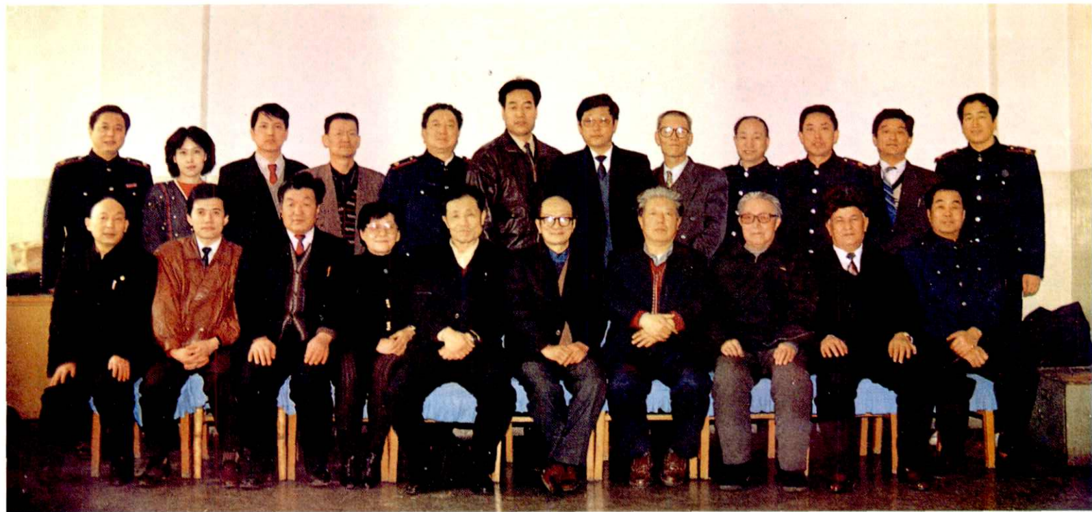
参加《乌鲁木齐税务志》会审会议全体同志合影