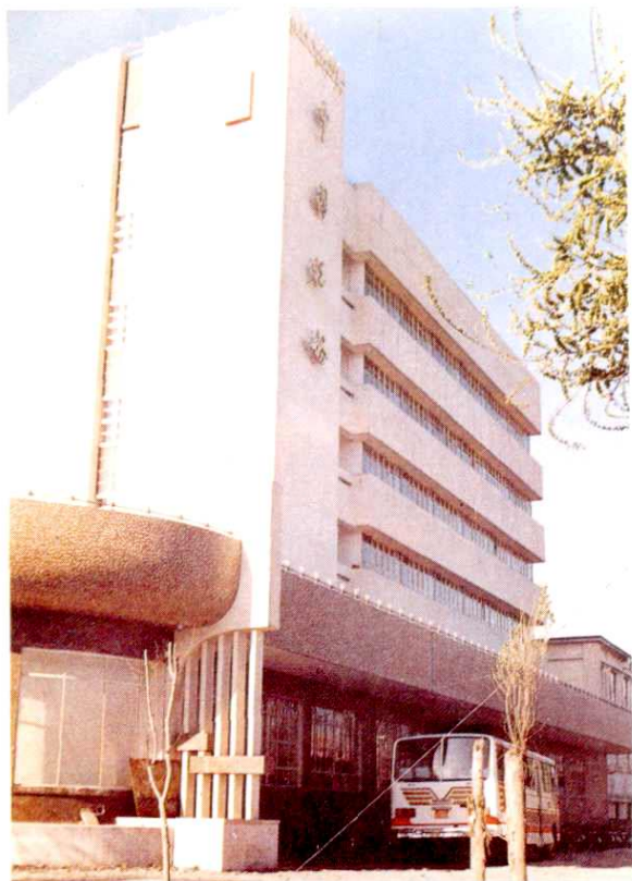
新市区分局办公楼