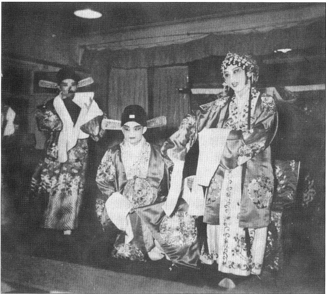
工会组织的业余京剧组在演出节目

《北京晚报》筹备处时，报社成立了工会组织，《北京日报》正式创刊后不久，工会设专职干部一人。1952年，工会设劳保、文教等工作部门，生活困难救济委员会定期审查困难职工申请，批准后予以定期补助。后又由行政与工会出资建立临时困难互助会解决职工因临时生活困难的借贷问题。工会还组织了业余京剧队、舞曲乐队、曲艺组，活跃职工生活，并于节假日为职工代买影剧票。