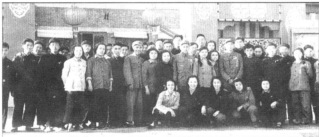
报社部分工作人员在东长安街2号合影。