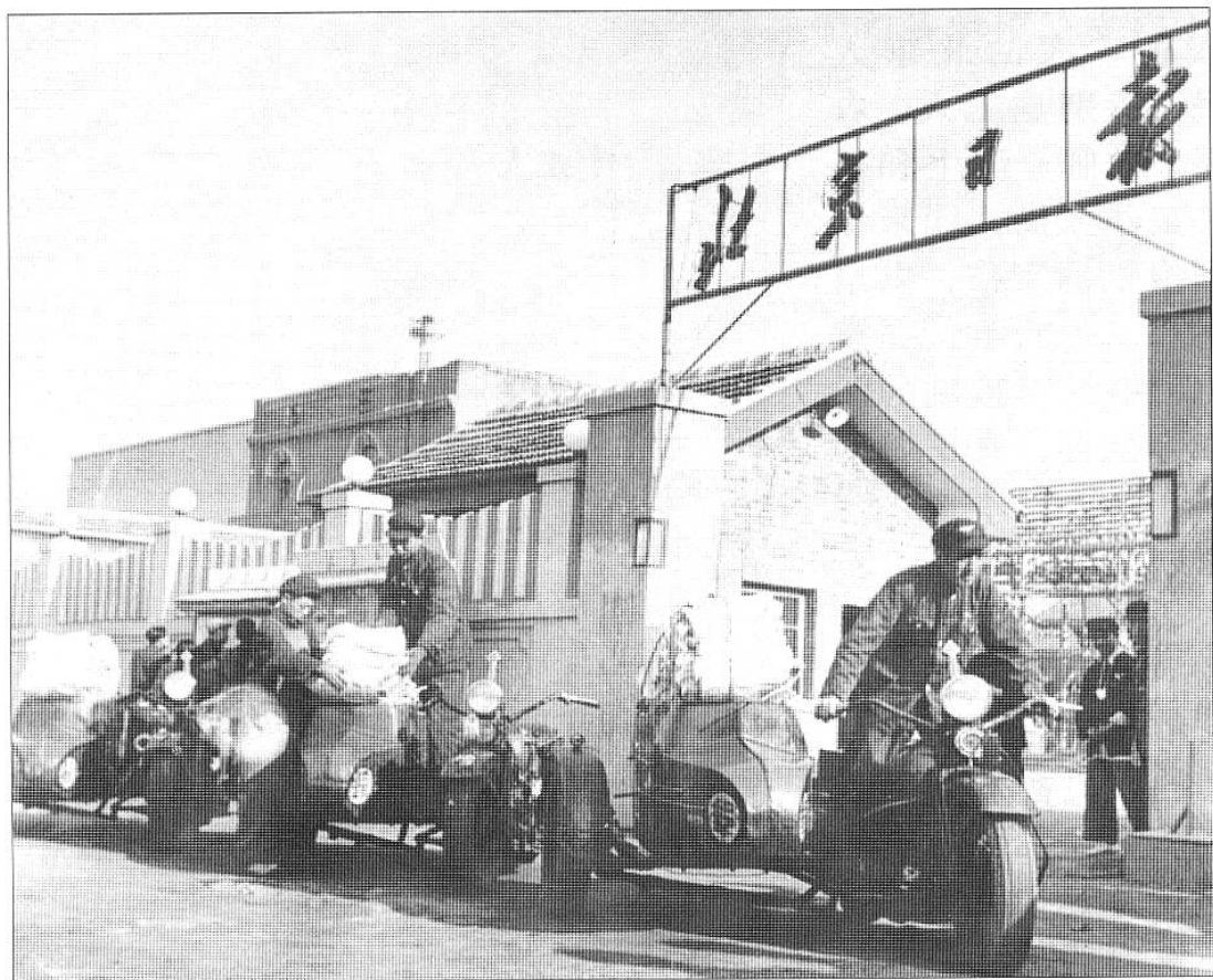
1952 年 11 月，本报迁入东长安街社址。此图为报社门前。

创刊时，《北京日报》每份售价为当时货币 600 元（折合现在人民币 6 分钱），创刊号共发行 35000 份。创刊时报社共有职工 296 人，编辑、记者平均年龄 24 岁，是一支年轻的、朝气蓬勃的队伍。《北京日报》从创刊起，就十分注意出报时间。创刊第二天开始在报头下增加“昨日印完时间”。此后 20 天，由于编辑部和工厂各个环节配合不好，印刷时间不稳定，印完时间没有早于 8 时的。20