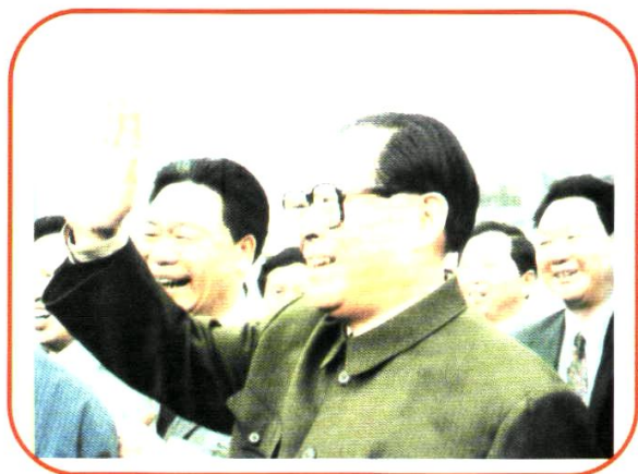
1995年3月25日，中共中央总书记、国家主席江泽民来澧县视察。