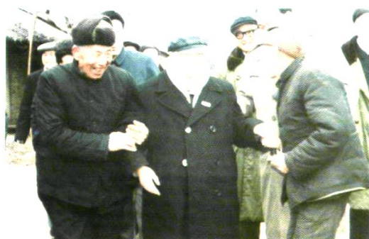
1986年2月27日, 中顾委常委王首道(前排左二)视察澧县, 重访当初“社教蹲点”的澧西乡群星村, 会见农民朋友