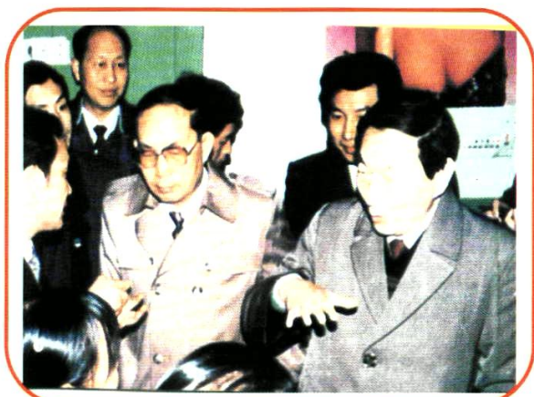
原国务院总理朱镕基(右一)视察澧水流域时与澧县群众亲切交谈。