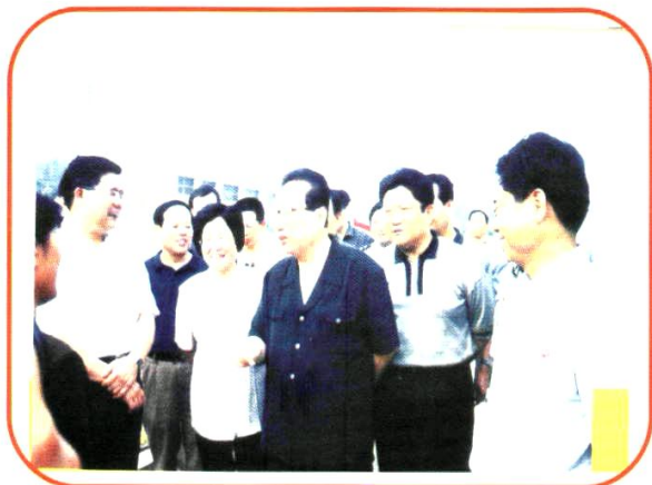
原全国人大常委会委员长乔石(右三)在澧县考察