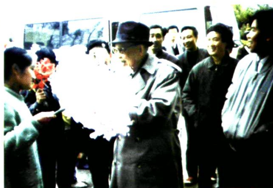
原全国人大副委员长廖汉生(前排右三)视察澧县教育