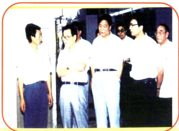
原全国政协主席李瑞环(左二)在澧县视察