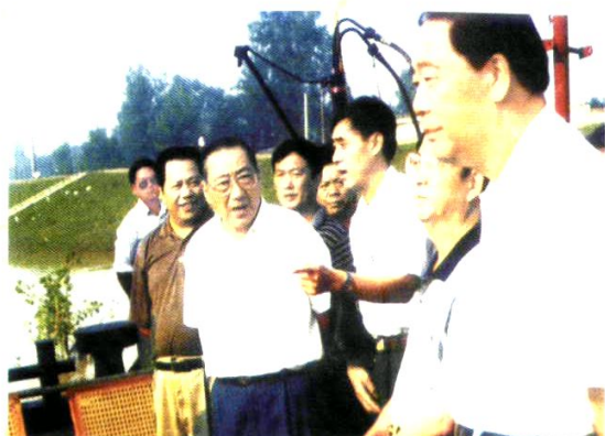
原中共中央政治局常委、国务院副总理李岚清(左三)在澧县视察