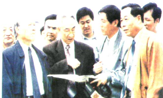
原国务院副总理邹家华(前排左二)视察澧水流域