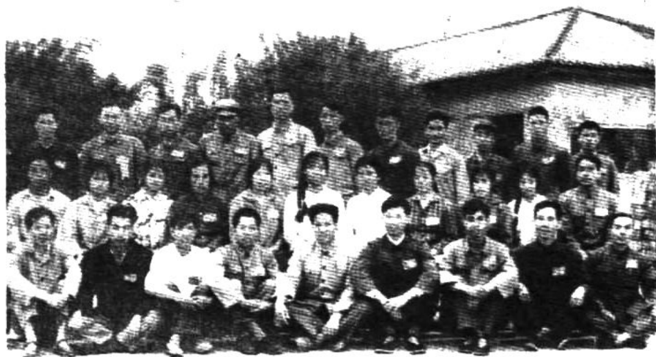
玉溪地区工会代表大会通海代表团合影