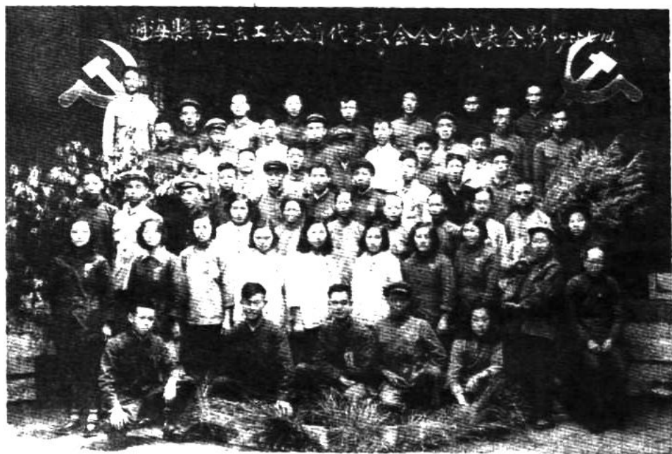
原通海县第二次工会代表大会合影