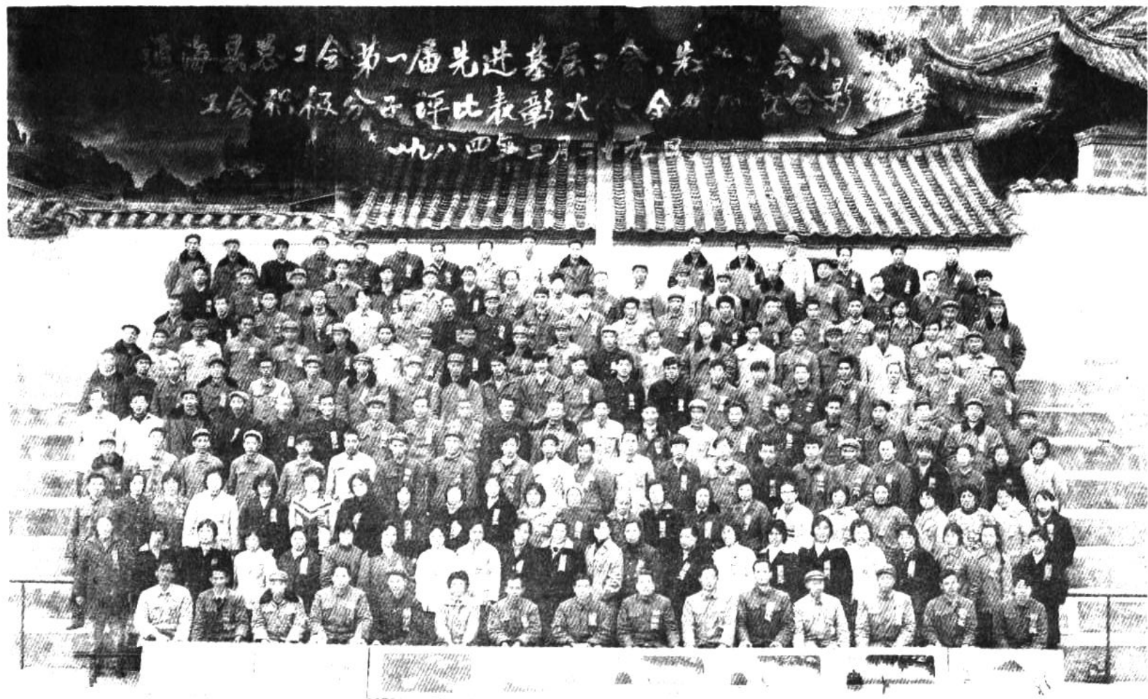
通海县总工会第一届先进基层工会、先进工会小组、 工会积极分子评比表彰大会、全体代表合影纪念。