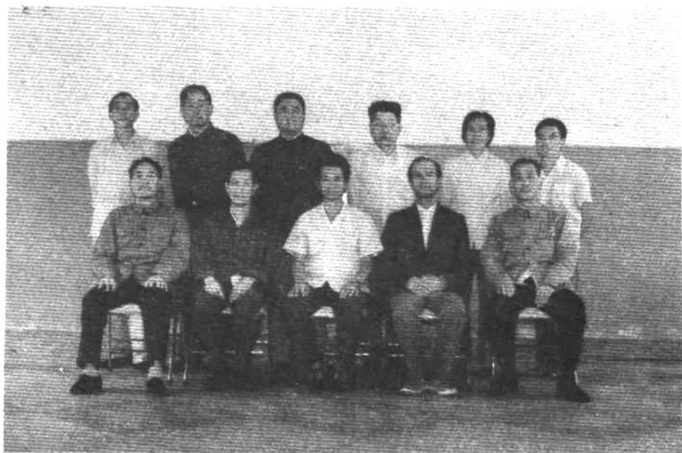
县总工会工作人员及编纂小组合影