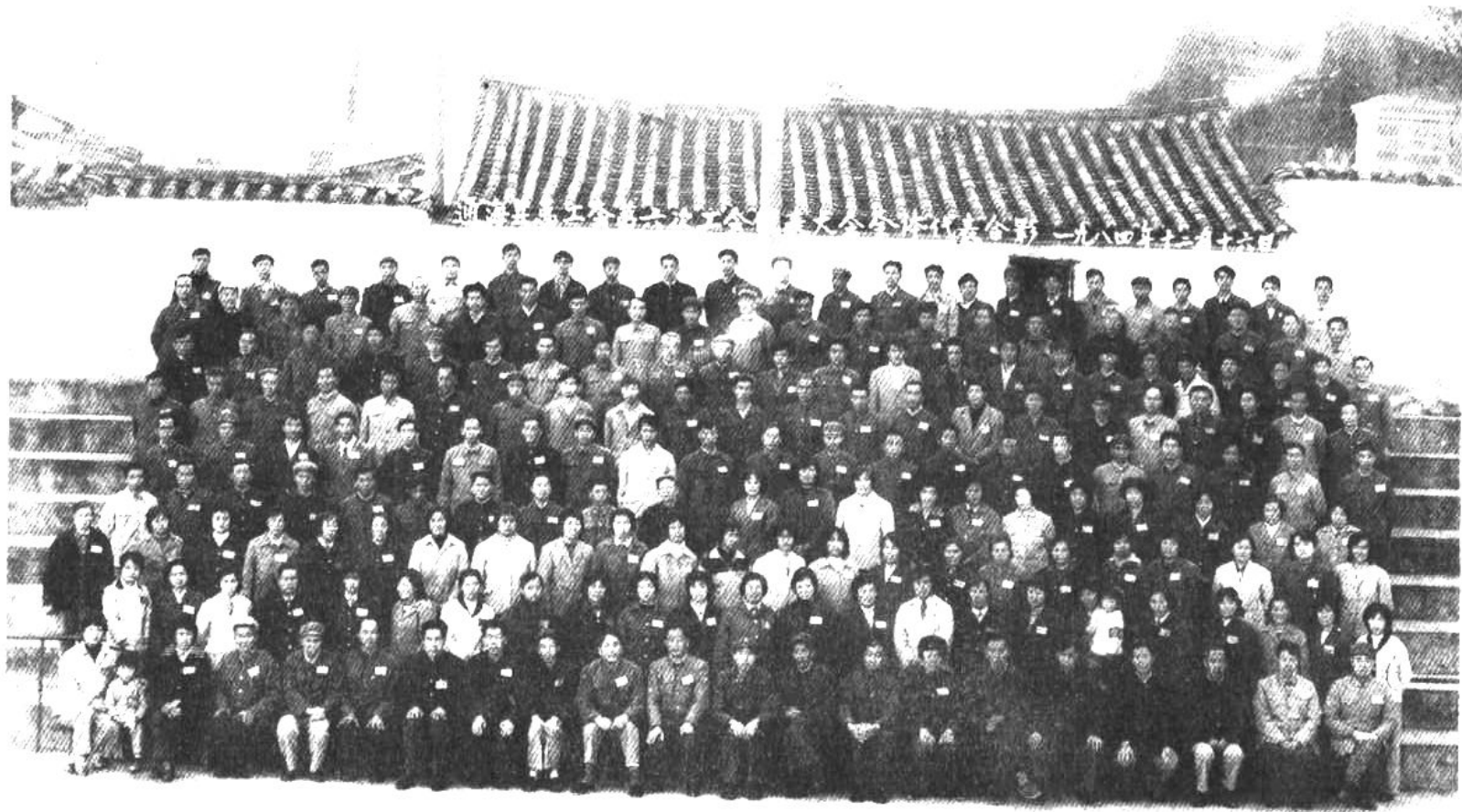
通海县第六次工会代表会代表合影