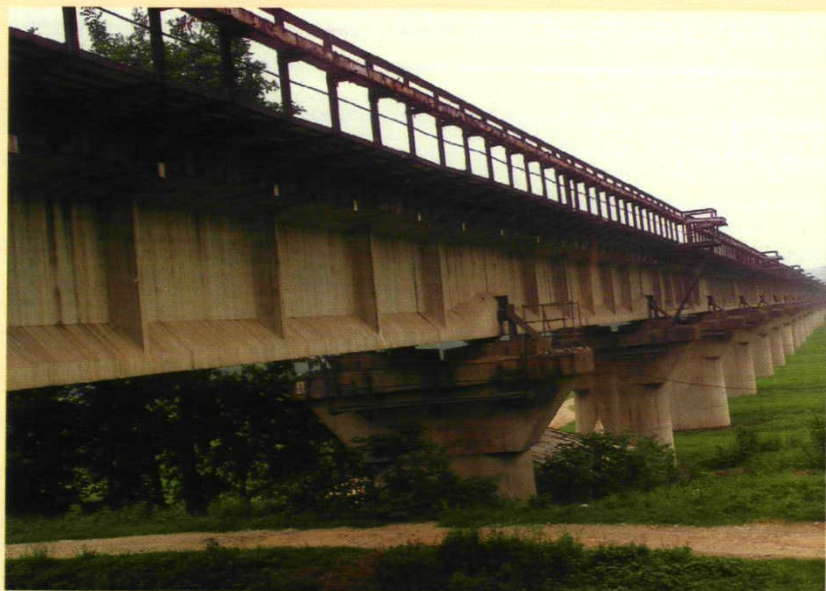
1995年底竣工的临澧道水铁路特大桥