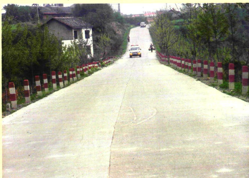
白珠线县道路面硬化工程（板栗坡段）