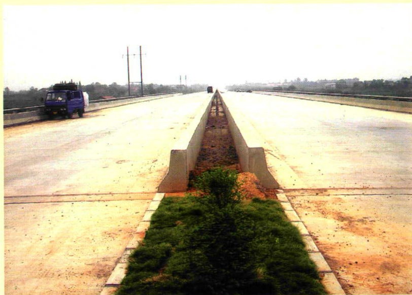
207国道道水一级公路大桥桥面。(2003年12月竣工)