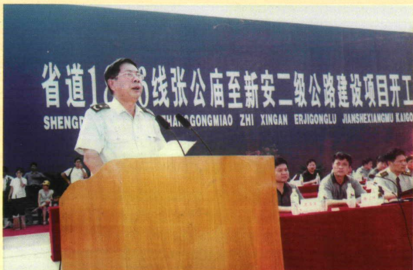
2002年9月8日，省军区原政委乔新柱少将在新张公路建设开工典礼上致辞。