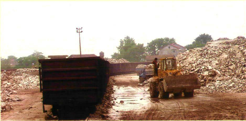
临澧火车站货场装卸作业情景