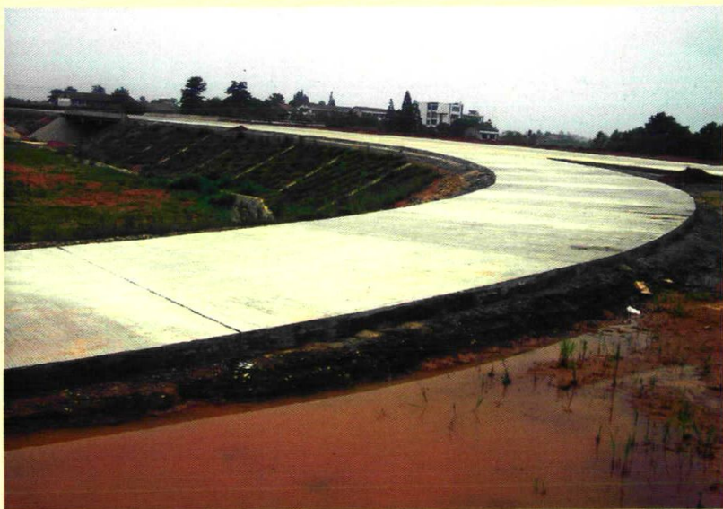
207国道临岗公路望城段临柏公路立交工程