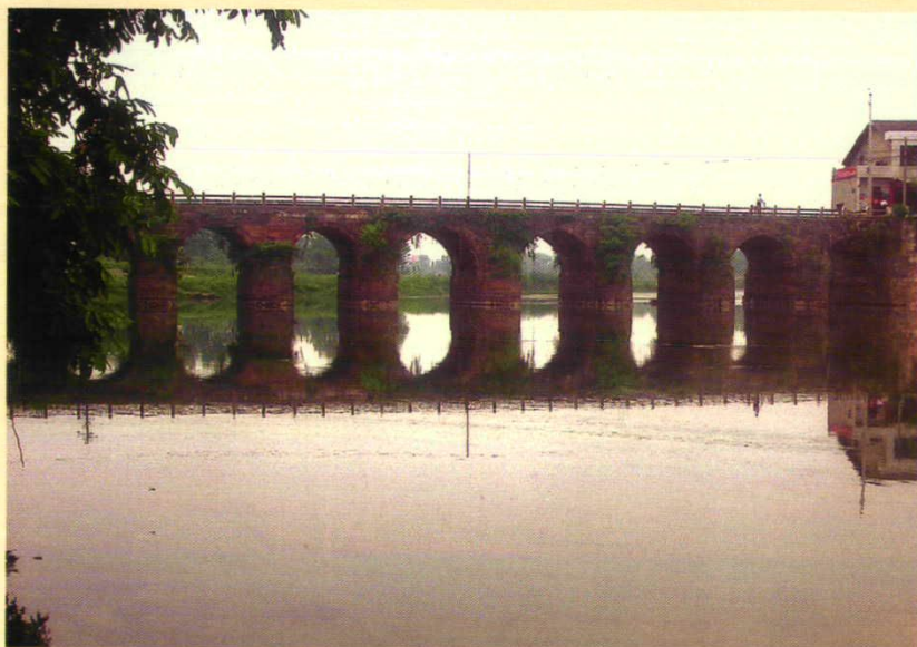
余市桥全景（县道公路桥）