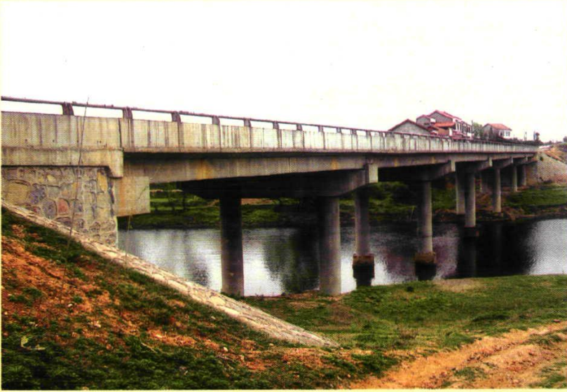
2000年9月竣工的龙潭道水大桥