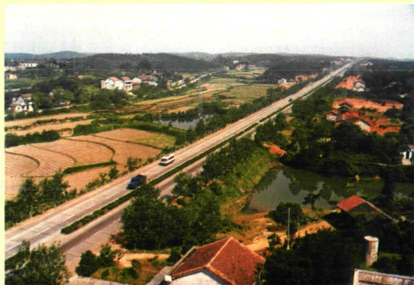
改建后的207国道临澧安福镇金牛岗地段