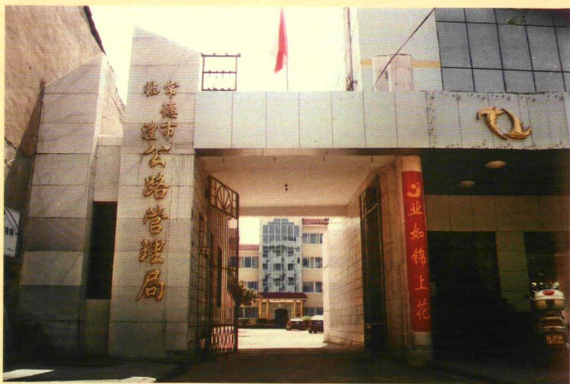
临澧公路管理局办公大楼（位于县安福镇朝阳东街2号）