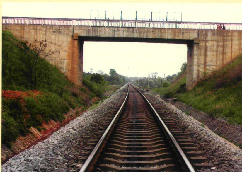
白珠线陈二境内跨铁公路桥