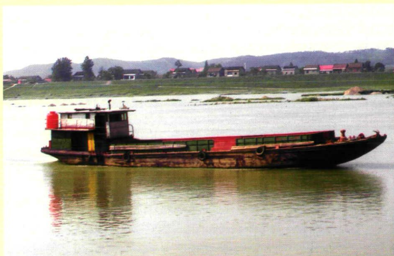
60吨级钢质夹板驳货运船舶