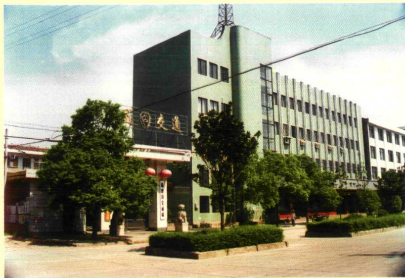
1990年8月1日竣工的临澧县交通局办公大楼。位于县安福镇朝阳西街5号。