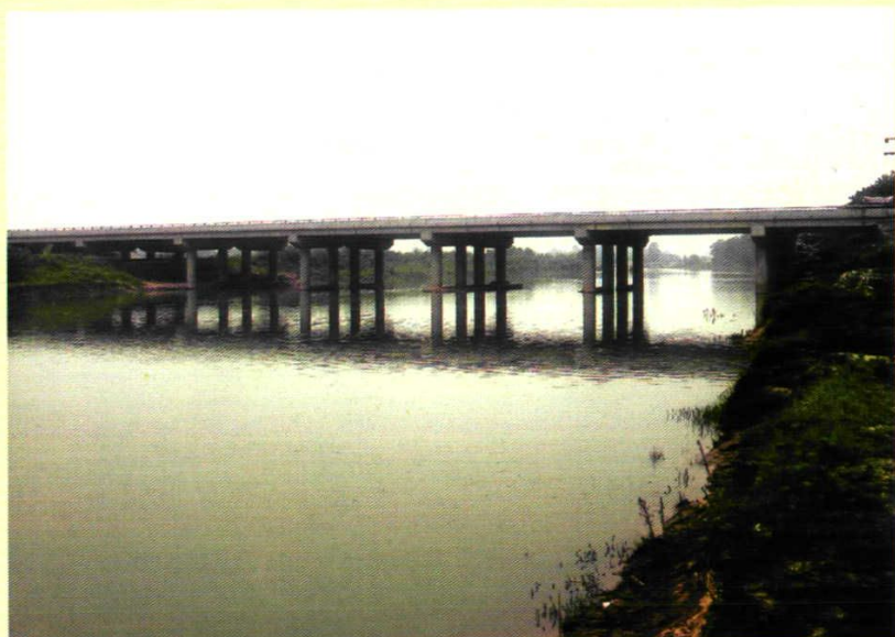
2003年12月竣工的207国道道水一级公路大桥全景。