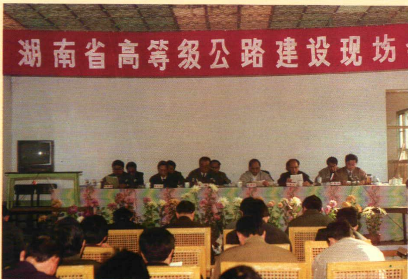
1992年11月15日，全省首次高等级公路建设现场会在临澧县楚园宾馆召开。副省长汪啸风、省政府副秘书长向德武、省交通厅厅长李顺及各地、州、市政府分管领导和交通、公路局长参加了会议。图为会议会场。（主席台前排左起：陈德铨、马其伟、李顺、汪啸风、向德武、刘春林）