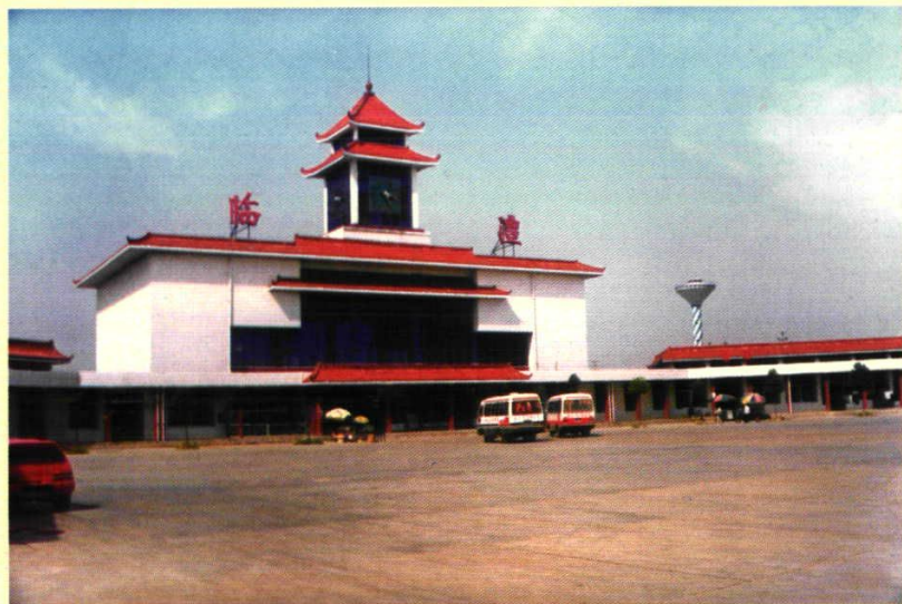
1998年10月竣工正式营运的石长铁路临澧火车站站房及广场