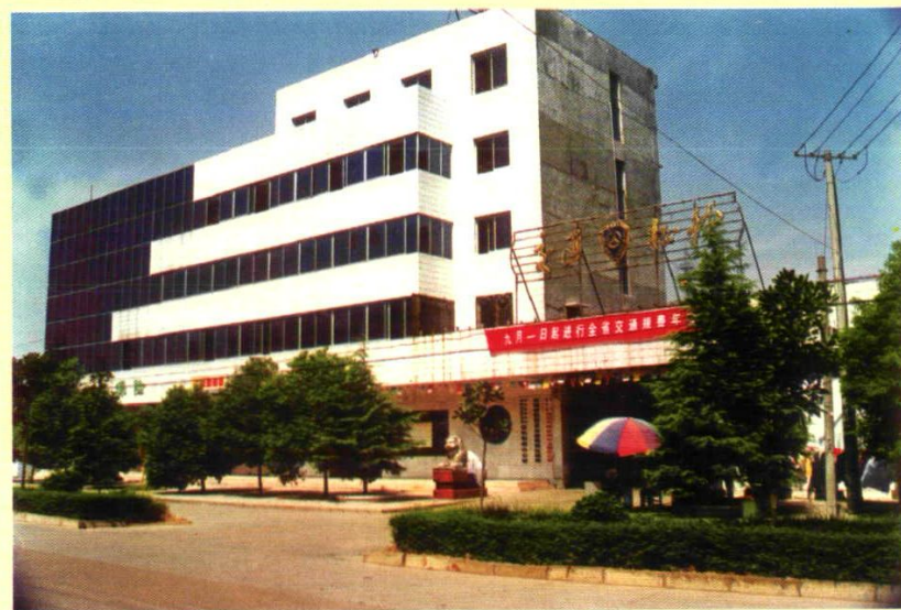
1995年1月新成立的临澧县交通规费征稽所办公大楼，位于县安福镇朝阳西街8号。