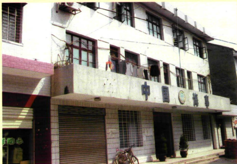
位于合口镇的临澧港监站办公楼。(海事执法机构)