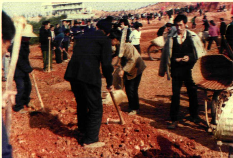
1992年11月，207国道拓改工程开始，图为修梅镇政府东侧施工地段民工劳动情景。