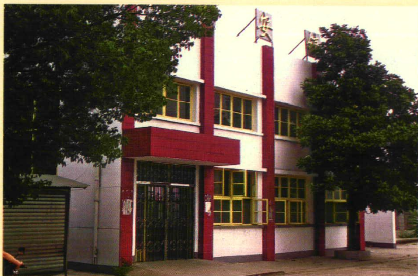
新安镇火车站客运候车室