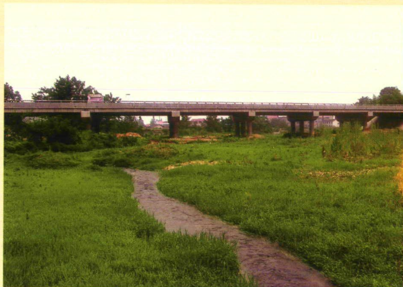
S304省道新安镇与石门易市交界处蔡家溪公路大桥。(2003年12月竣工)