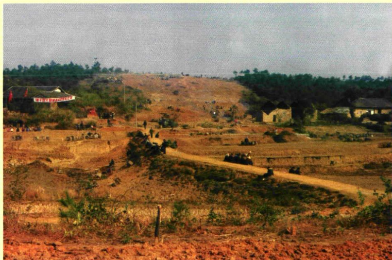
207国道修梅段扫障待拓改状况。