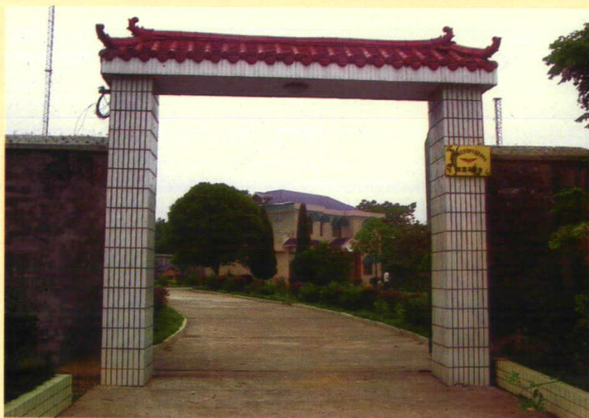
位于四新岗镇的临澧导航站