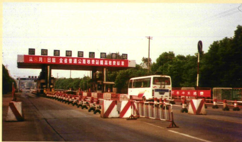
1996年7月竣工的临澧县207国道矮架山收费站。