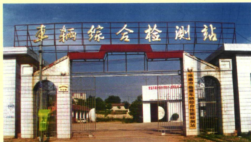
1995年成立位于县城金牛岗地段的“车辆综合性能检测站”