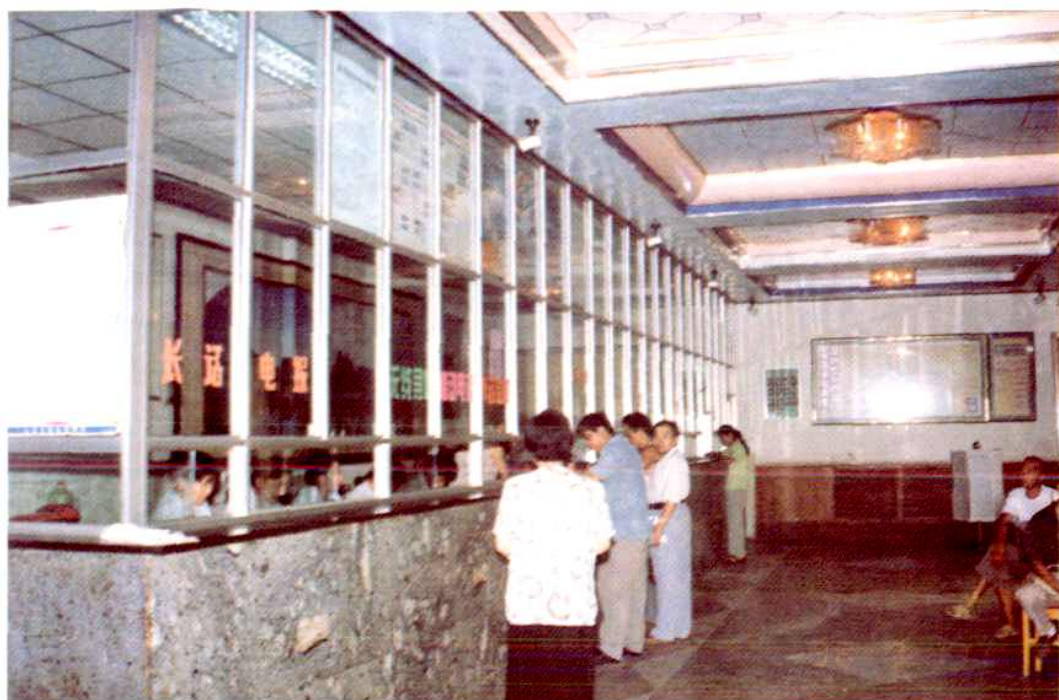
冠县邮电局综合营业室内景（1998年5月）