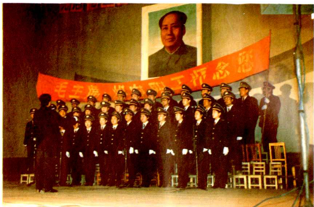
1996年12月26日，冠县邮电职工组织参加了全县纪念伟大领袖毛泽东百年诞辰歌咏大赛