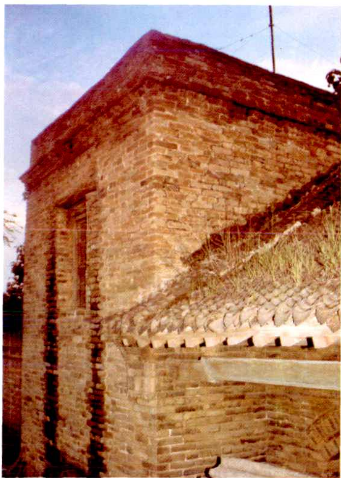
1953年冠县邮电局旧址