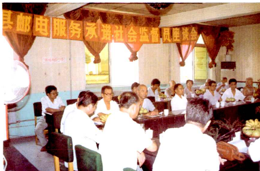
1997年10月冠县邮电局召开社会监督员座谈会