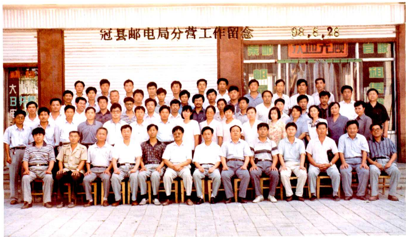
冠县邮电局中层干部分营留念 (1998年8月)