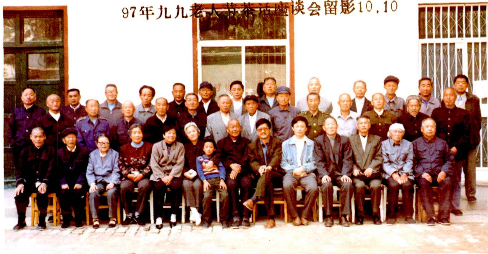
1997年“九九”重阳节，冠县邮电局举办离退休干部职工参加的重阳节茶话会，上图为留念照