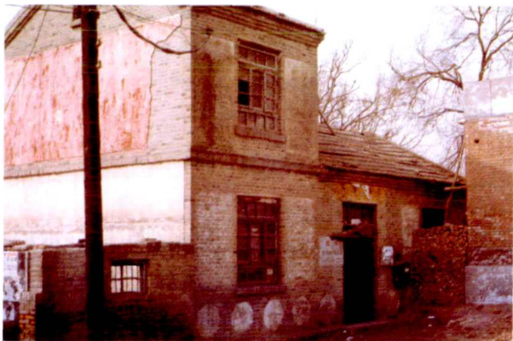
1994年东古城邮电支局旧址