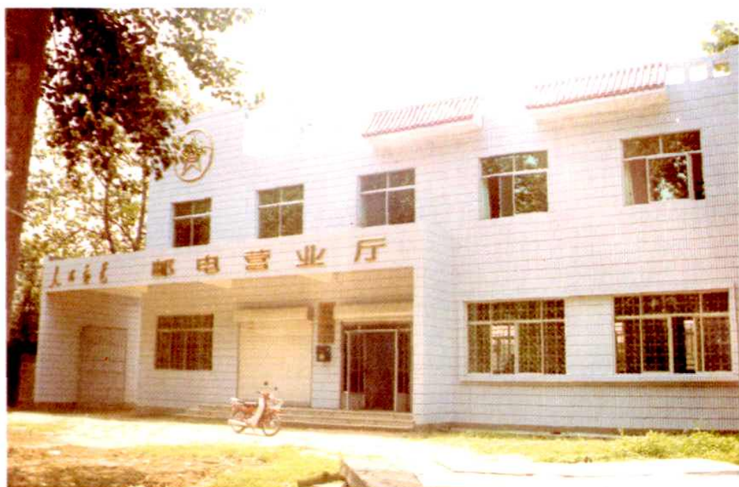
孙疃邮电支局营业楼 (1998年5月)