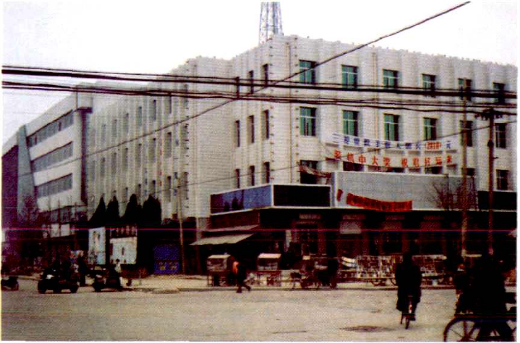
冠县邮电局办公大楼外景