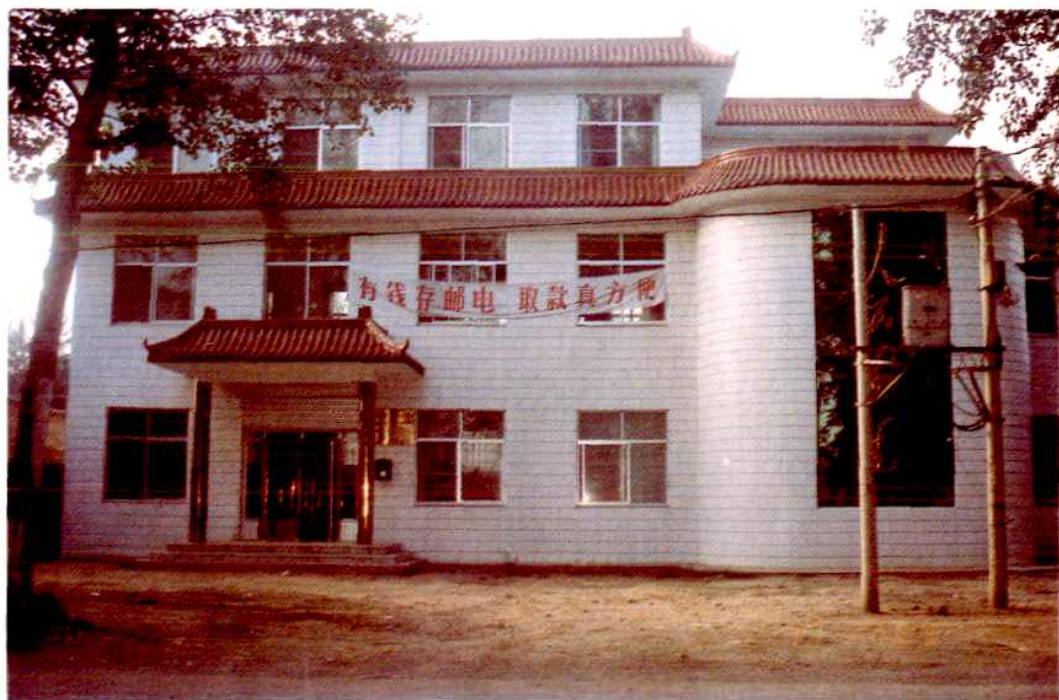
烟庄邮电支局营业楼外景