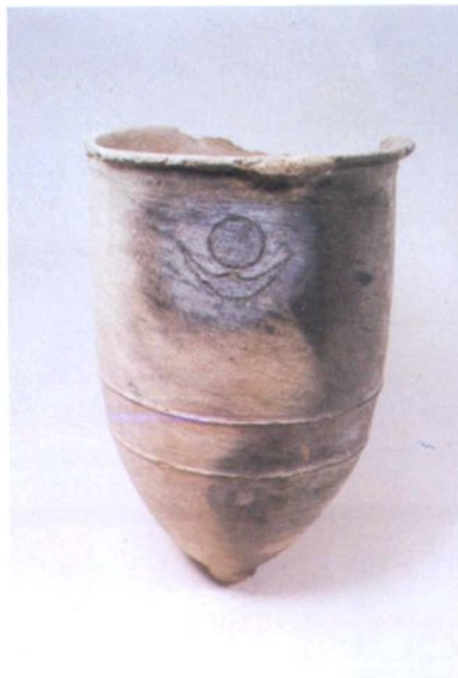
大口尊(大汶口文化)