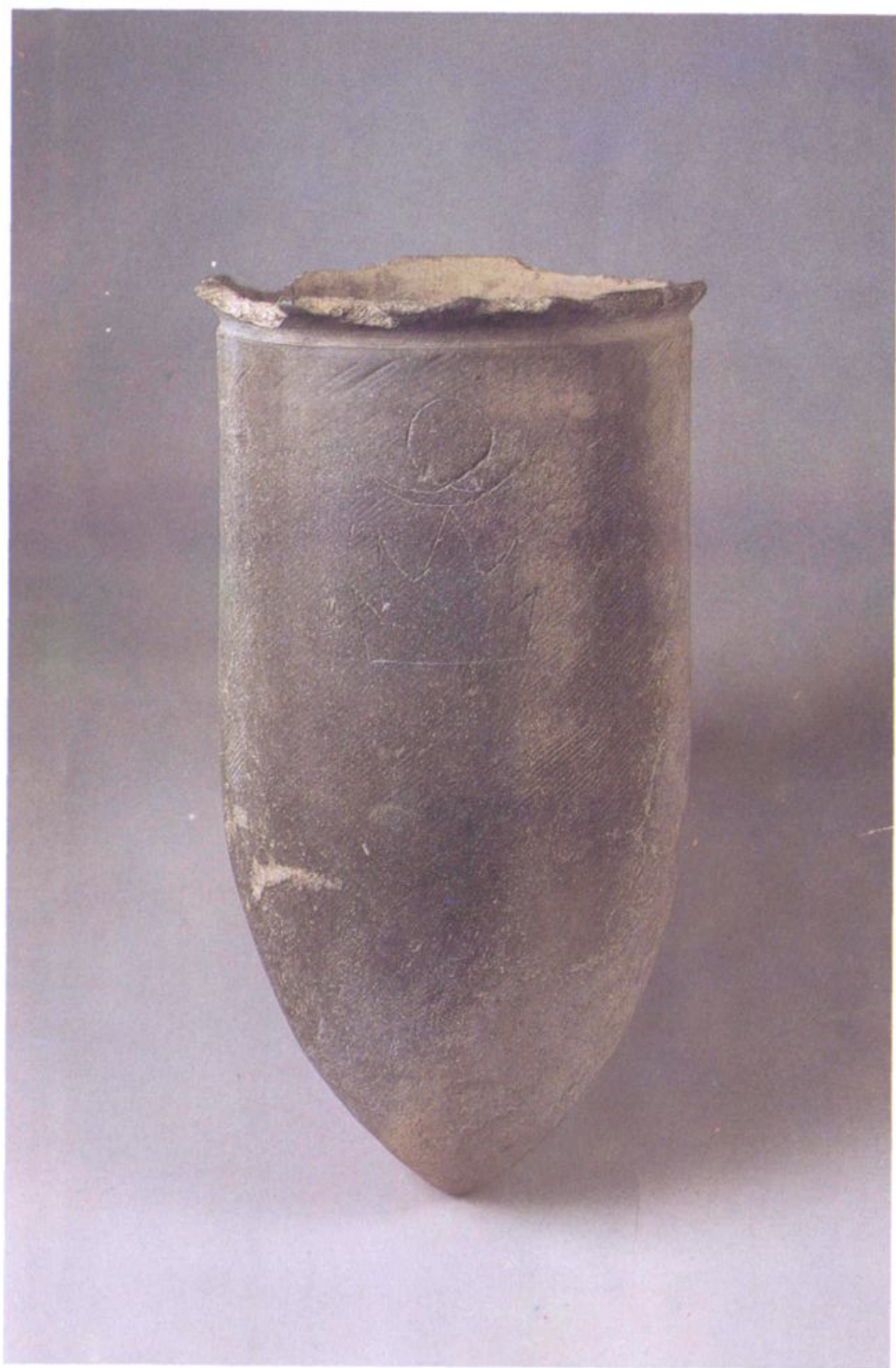
大口尊(大汶口文化)