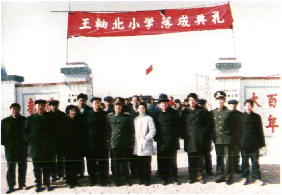
1993年武警学院官兵捐资4万元为王轴北小学建成新学校，副省长(原廊坊市副市长)杨迁(前排右五)参加新学校落成典礼