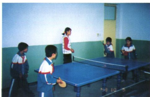
小學生乒乓球比賽