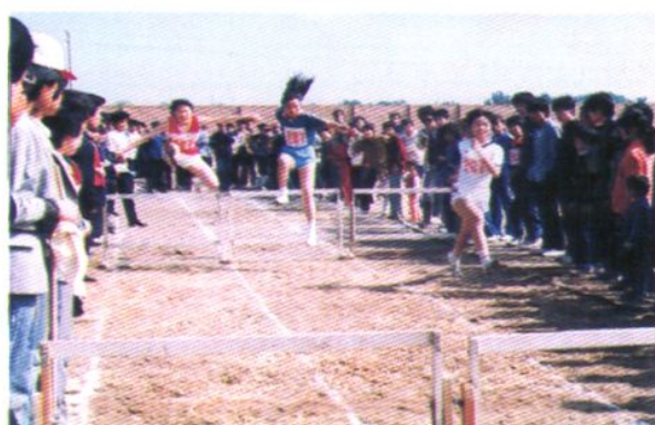
中小學生運動會上女子跨欄項目