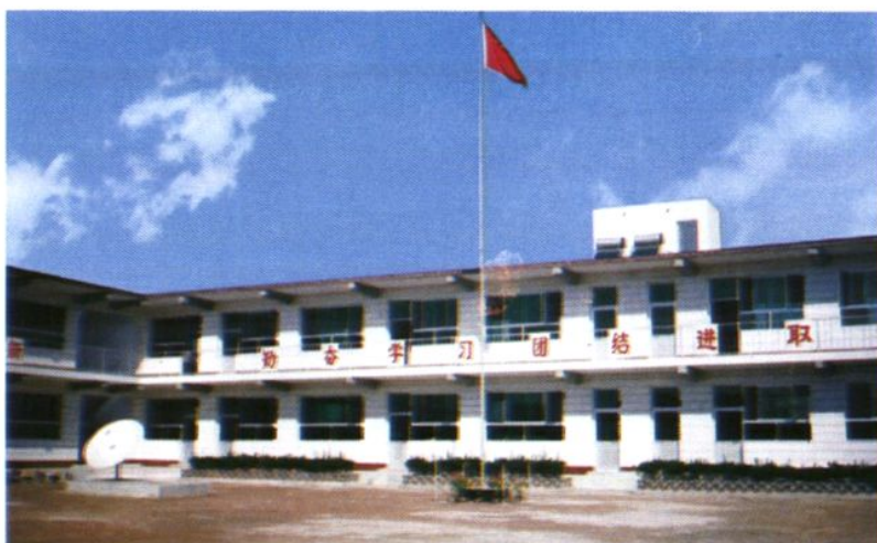
臧屯乡刘演马村投资 80 万元建成的教学楼