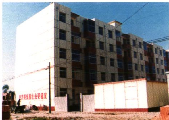
“园丁康居工程”住宅楼