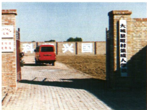
大城县旺村镇成人学校