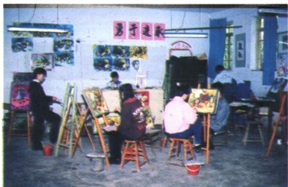
中學生美術組活動