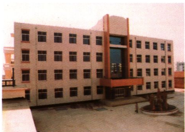
教师进修学校教学楼