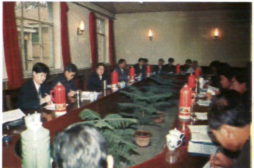
县委常委研究会教育工作