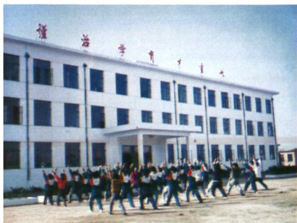
全县第一座中学教学楼——大广安乡中学教学楼