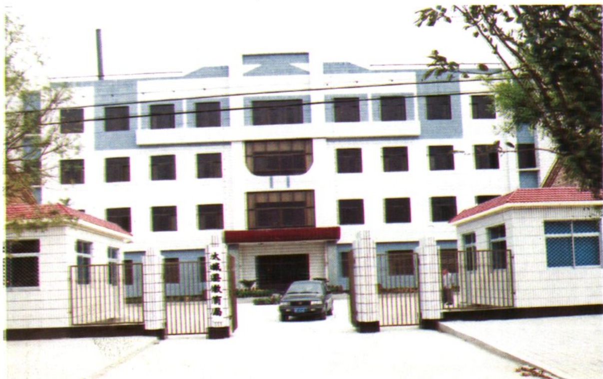
大城教育局办公楼