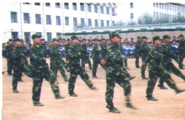
職業中學學生軍訓表演