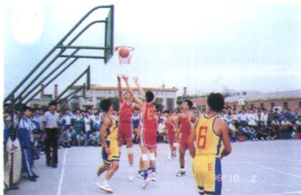
廊坊市重點中學籃球賽在大城舉行