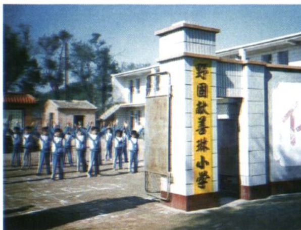
臧屯乡野固献村王善琳捐资 35 万元建起的村小教学楼