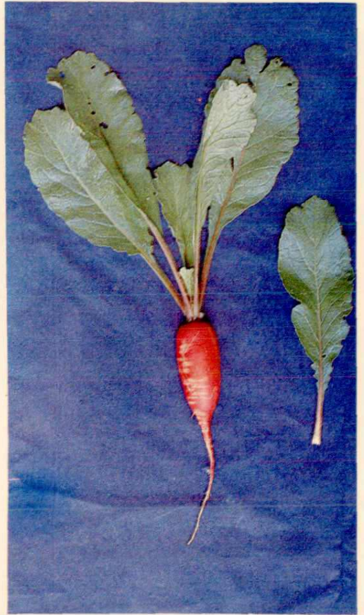
右上呼市五纓 右下赤峰鞭杆红