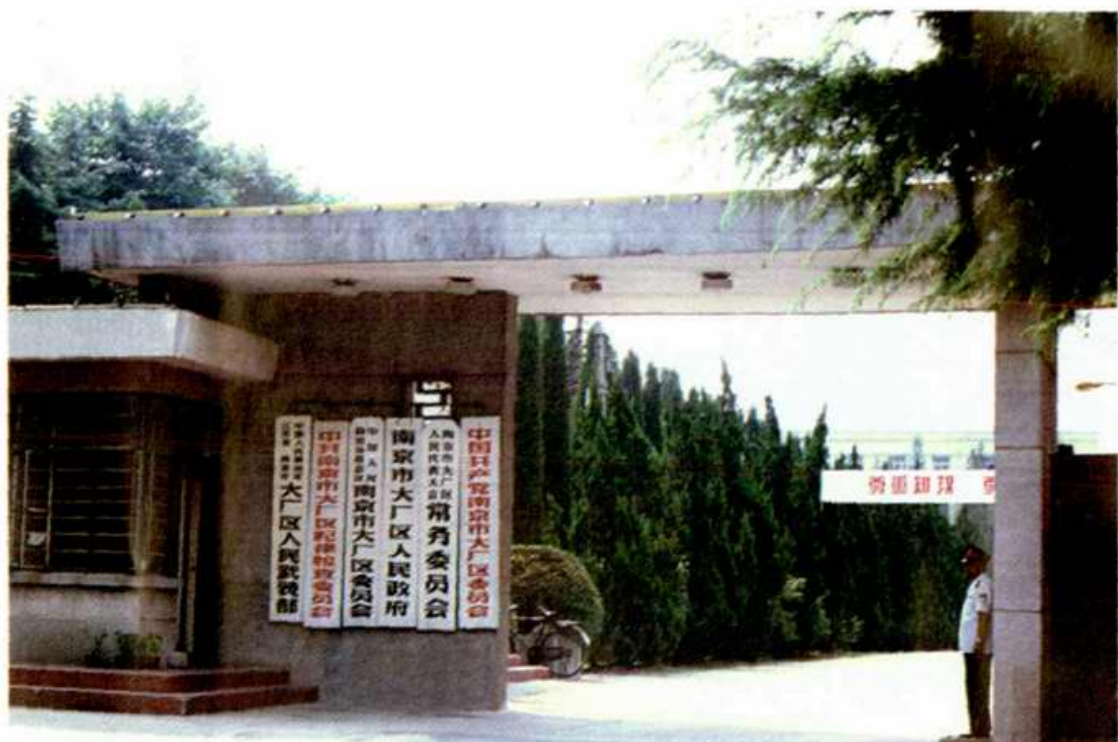
位于晓山的南京市大厂区人民政府