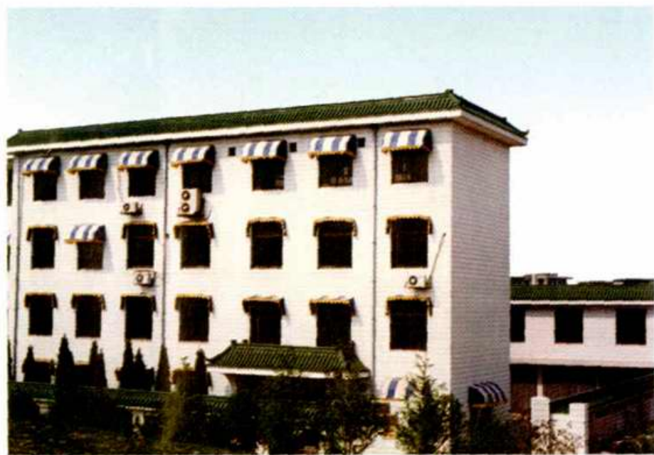
位于新华路6街区的大厂区房地产管理局办公楼