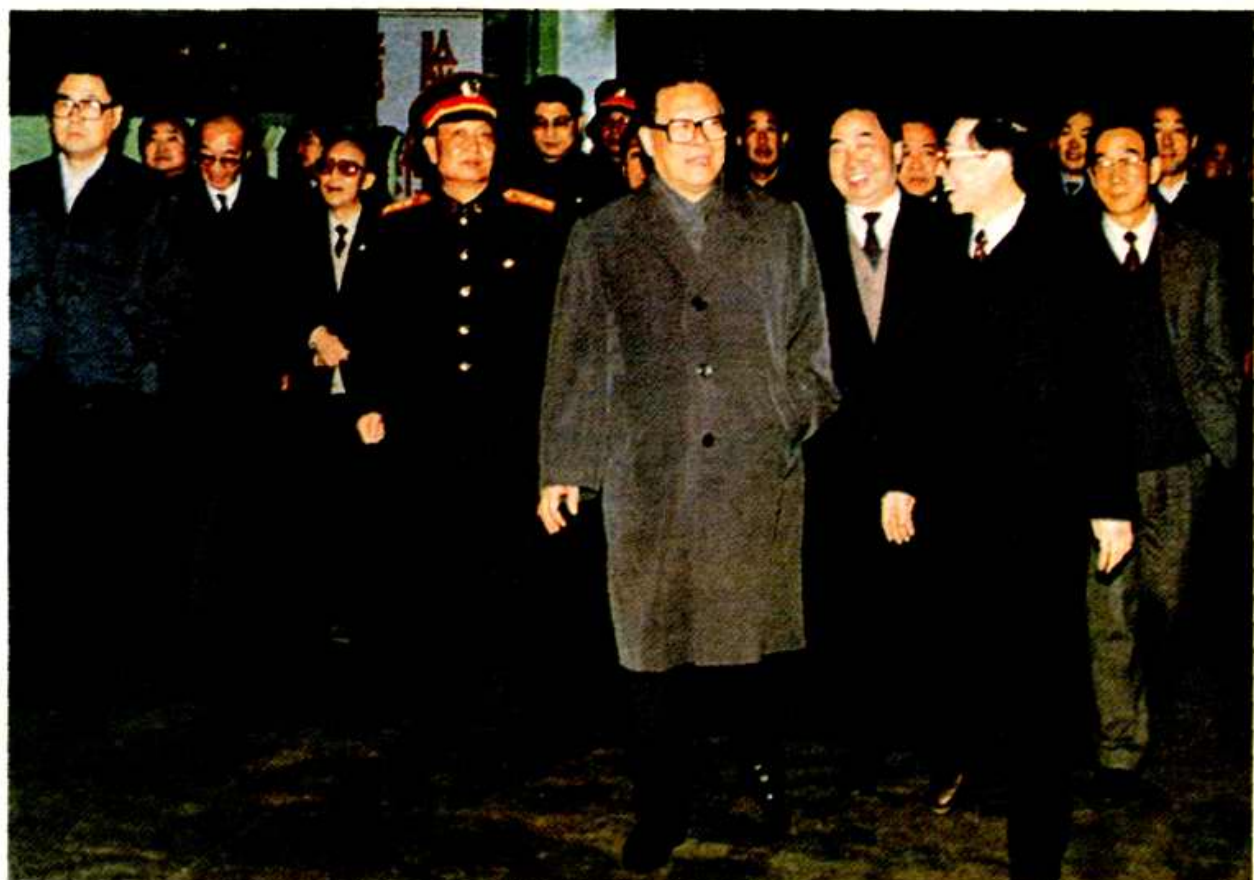
1992年1月25日,国家主席江泽民视察扬子石油化工公司