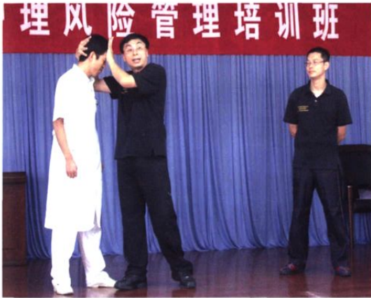
▲ 7月29日，香港护士训练及教育基金会专家来到我院，对我院护理人员进行了暴力行为处理技巧培训。