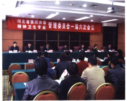
▲ 12月8日，河北省医院协会精神卫生专业管理委员会一届六次会议在沧州召开。