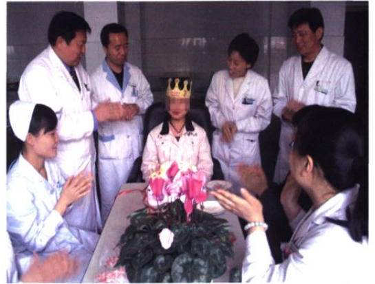
▲ 我院深入开展行风建设，不断提高服务质量。图为临床四科为住院患者过生日。