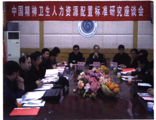
▲ 1月10日，卫生部“中国精神卫生人力资源配置标准研究”课题组来我院调研工作。