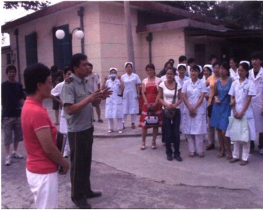
▲ 7月23日，我院邀请消防专家进行消防培训。图为消防专家讲解火灾逃生技巧。