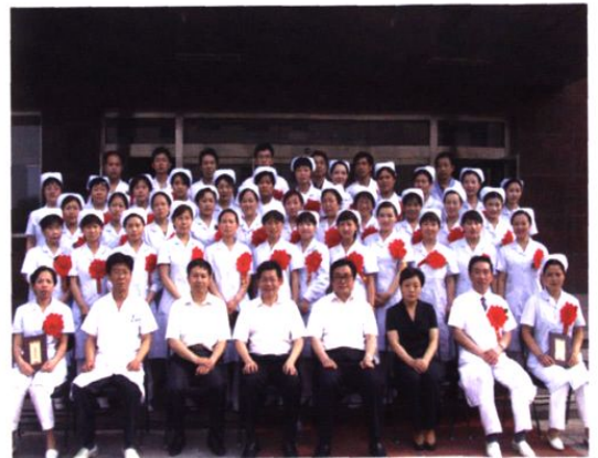
▲ 5月12日国际护士节期间，我院举行隆重的优秀护理人员表彰活动。图为院领导与受表彰护理人员合影。