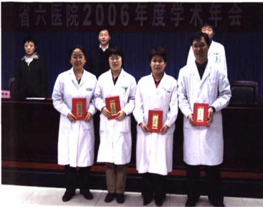
▲ 2007年3月17日，我院召开2006年度学术年会。图为2006年度优秀论文奖获得者。