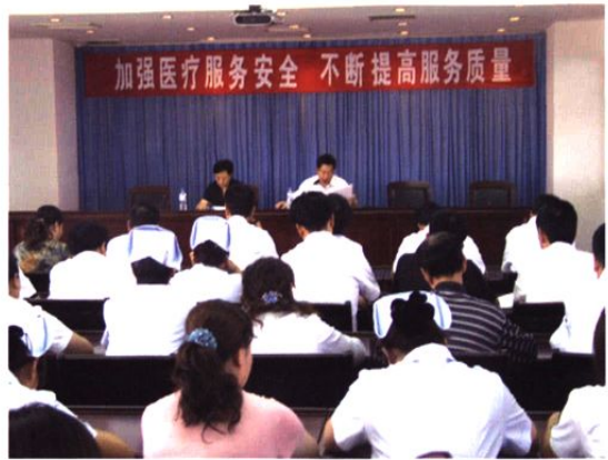
▲ 2007年5月16日，我院召开医疗服务安全和服务质量管理工作会议。