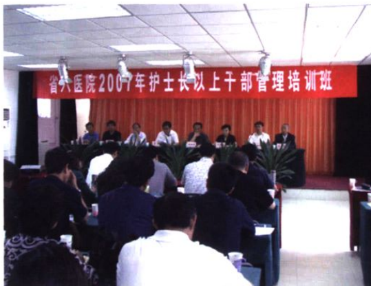
▲ 5月19日，我院举办第五届护士长以上干部管理培训班。图为培训班开幕式现场。