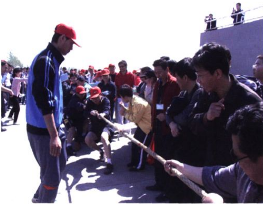
▲ 2007年4月7日，我院举办第五届职工春季田径运动会。图为拔河比赛。