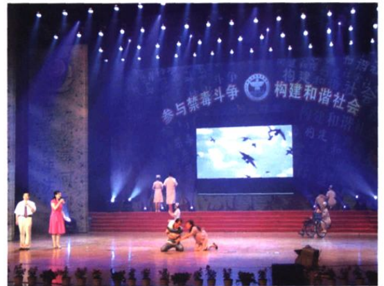
▲ 2007年6月26日，我院节目代表省卫生厅参加了全省禁毒宣传文艺晚会。图为演出现场。