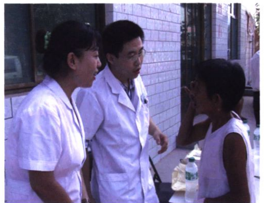
▲ 2007年，我院团委组织开展“爱心传递”活动。图为我院青年医护人员为群众送医进农村。