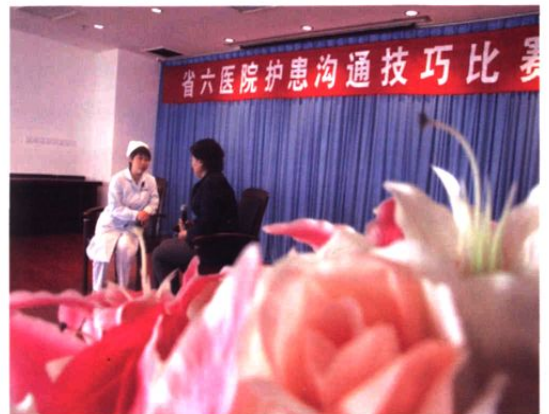
▲ 4月19日，我院举办了护理沟通技巧比赛。图为比赛现场。