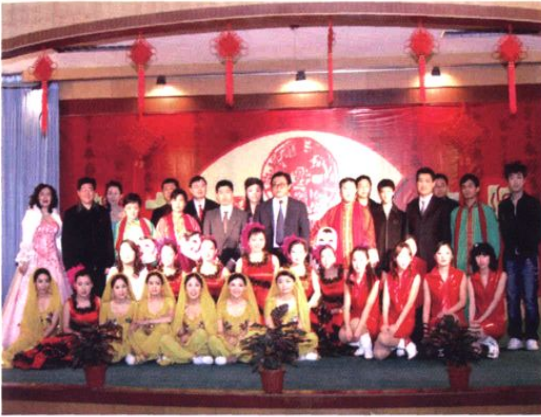
▲ 2007年，我院开展了丰富多彩的文化活动。图为迎新春文艺演出后，院领导与部分演职员合影。