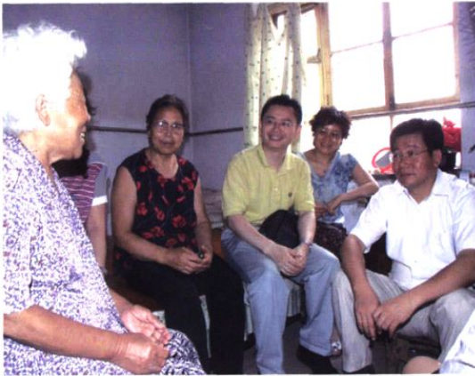
▲ 7月2日，卫生部重性精神疾病管理治疗项目督导组对我院精神卫生项目工作进行督导检查。图为督导组专家到示范区检查工作。