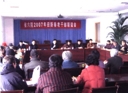
▲ 2007年7月27日，我院召开老干部座谈会。图为座谈会现场。