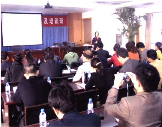
▲ 2007年11月8日--10日，我院举办《中国精神障碍防治指南》普及培训班。图为培训班现场。