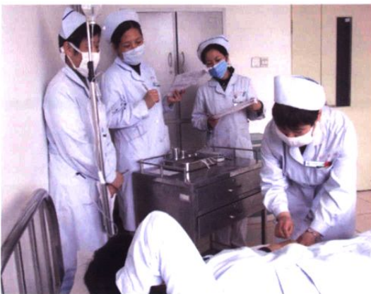
▲ 我院深入开展“三基”练兵活动。图为护理操作考核现场。