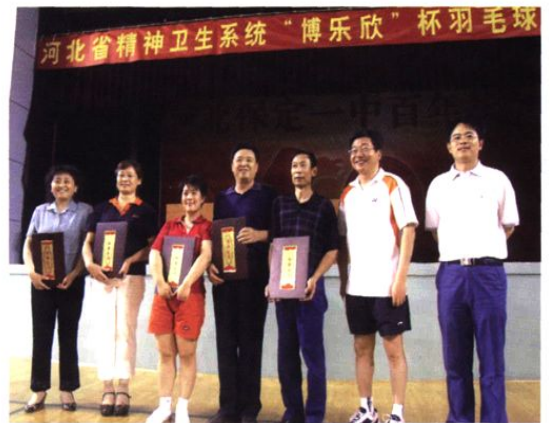
▲ 2007年6月2日，我院组织举办了河北省精神卫生系统羽毛球团体赛。图为颁奖仪式现场。