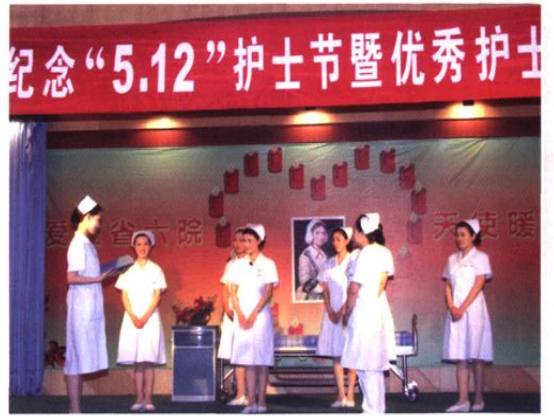
▲ 5月12日，我院护理人员进行护理操作汇报表演。图为演出现场。