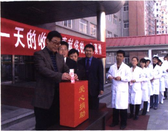
▲ 我院积极响应省政府号召，开展“博爱一日捐”活动。图为院领导带头捐款。