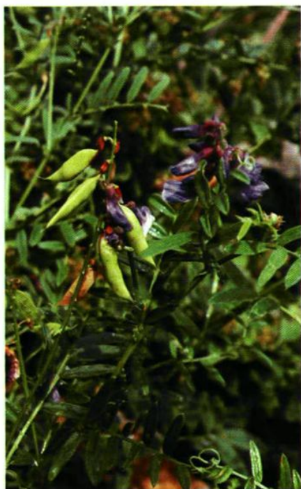
52. Vicia cracca L. 广布野豌豆