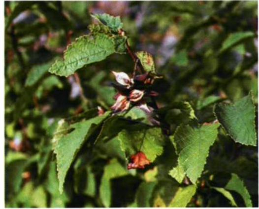
15. Ostryopsis davidiana Deene. 虎榛子