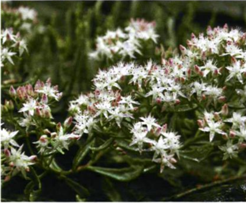
35. Rhodiola dumulosa (Franch.) S. H. Fu 小丛红景天