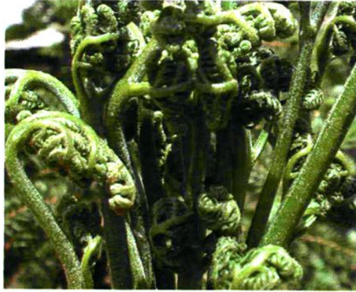
1. Pteridium aquilinum (L.) Kuhn var. latiusculum (Desv. Underw. ex Heller) 蕨