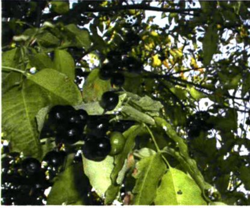
55. Phellodendron amurense Rupr. 黄檗