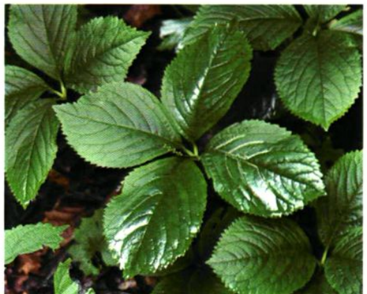
12. Chloranthus japonicus Sieb. 银线草