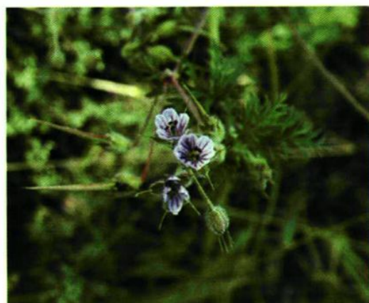
54. Geranium dahuricum DC. 粗根老鹳草