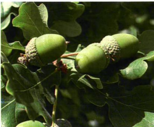
16. Quercus mongolica Fisch. ex Ledeb. 蒙古栎