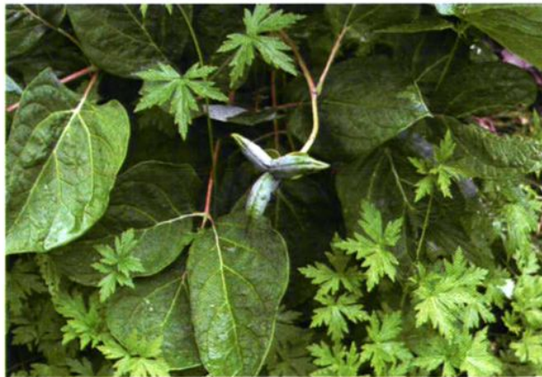
28. Paeonia lactiflora Pall. 芍药