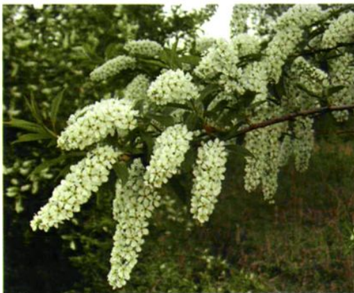
49. Palus racemosa (Lam.) Gilib. 稠李