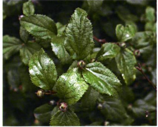
36. Deutzia grandiflora Bge. 大花溲疏