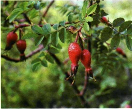
47. Rosa bella Rehd. et Wils. 美蔷薇