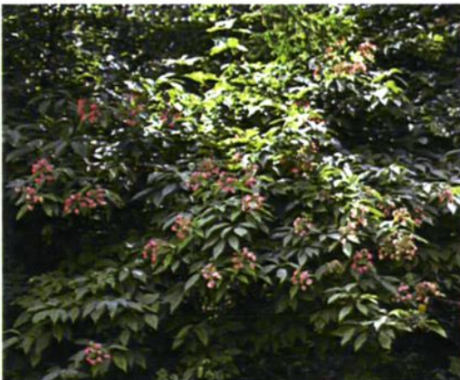
37. Hydrangea bretschneideri Dipp. 东陵绣球(东陵八仙花)