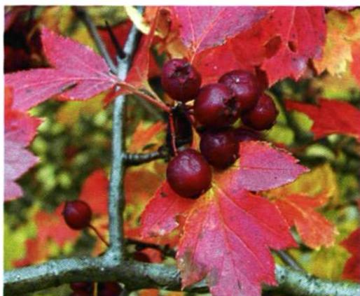
40. Crataegus pinnatifida Bge. 山楂