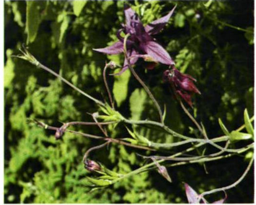
26. Aquilegia yabeana Kitag. 华北楼斗菜