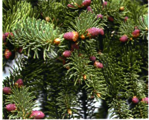
8. Picea meyeri Rehd. et Wils. 白杆