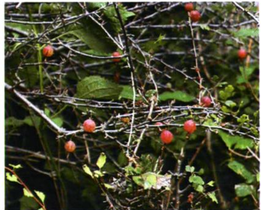
38. Ribes burejense Fr. Schmidt 刺梨