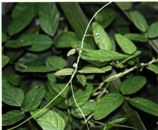
51. Glycine soja Sieb. et Zucc. 野大豆