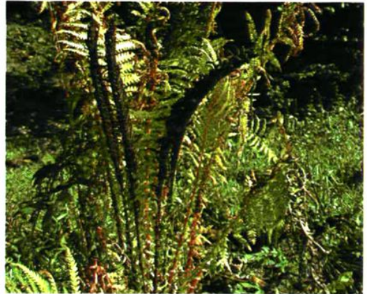
3. Matteuccia struthiopteris (L.) Todaro 荚果蕨