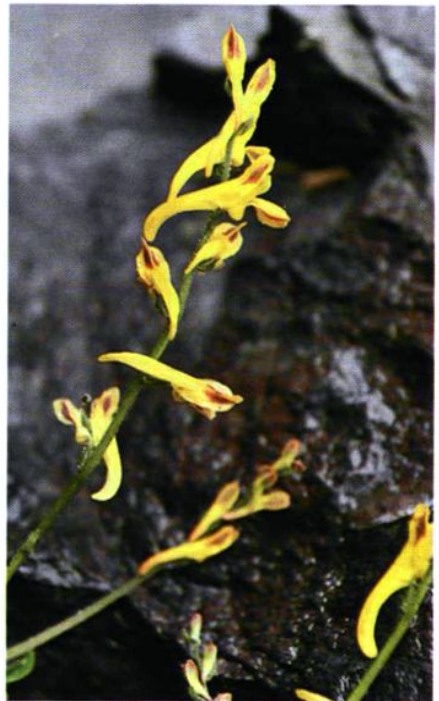
32. Corydalis pallida (Thunb.) Pers. var. chanetii (Lévl.) S. Y. He 河北黄堇