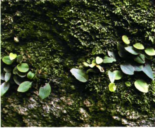
6. Pyrrhosia petiolosa (Christ) Ching 有柄石韦