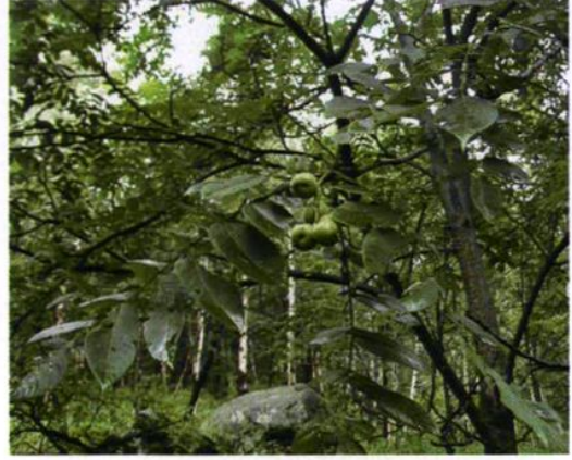
13. Juglans mandshurica Maxim. 核桃楸