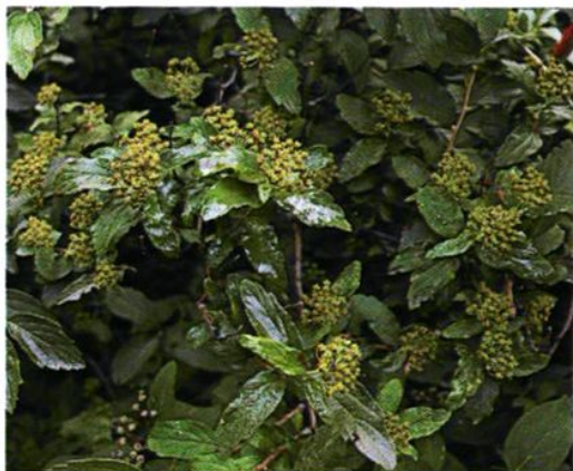
39. Spiraea elegans Pojark. 美丽绣线菊