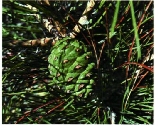
10. Pinus tabulaeformis Carr. 油松