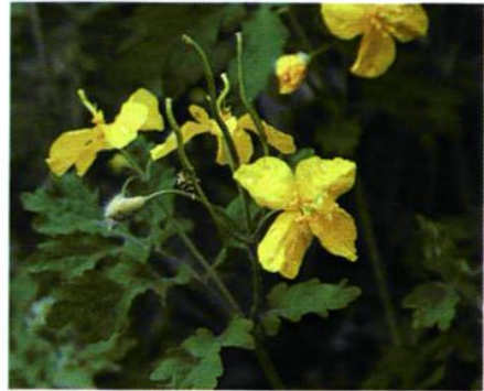
31. Chelidonium majus L. 白屈菜