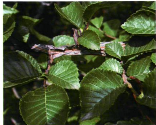
17. Ulmus macrocarpa Hance 大果榆