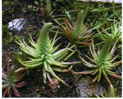
34. Orostachys fimbriatus (Turcz.) Berger 瓦松