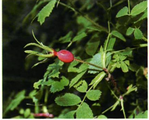
46. Rosa dawurica Pall. 刺玫瑰