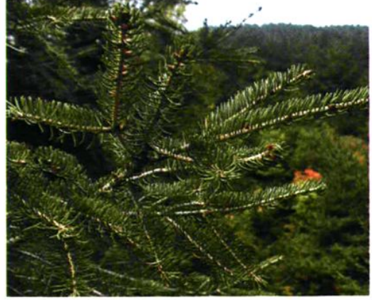
7. Picea wilsonii Mast. 青杆