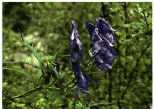
24. Aconitum jeholense Nakai et Kitag. var. angustius (Wang) Zhao. 华北乌头