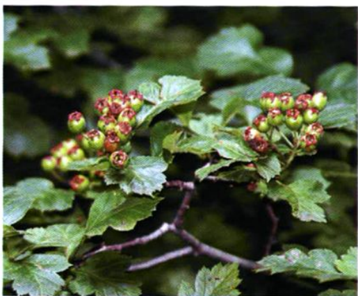
41. Crataegus sanguinea Pall. 辽宁山楂