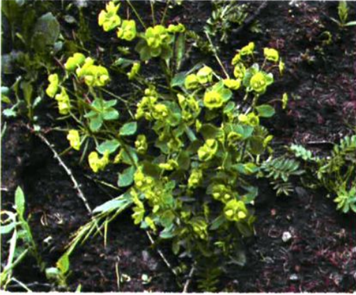
57. Euphorbia pekinensis Rupr. 大戟