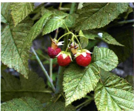
44. Rubus idaeus L. var. borealisinensis Yü et Lu 华北覆盆子