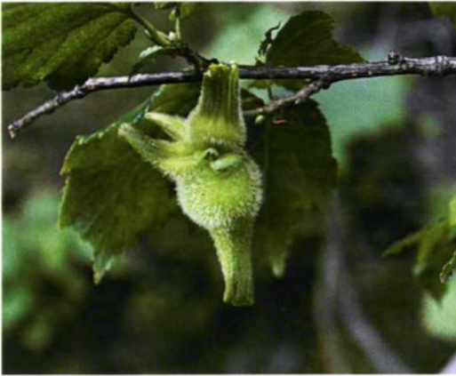
14. Corylus mandshurica Maxim. et Rupr. 毛榛