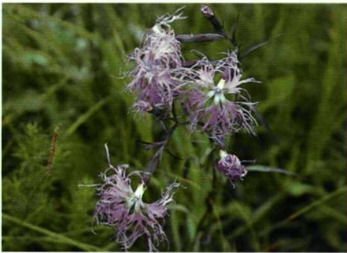
21. Dianthus superbus L. 瞿麦