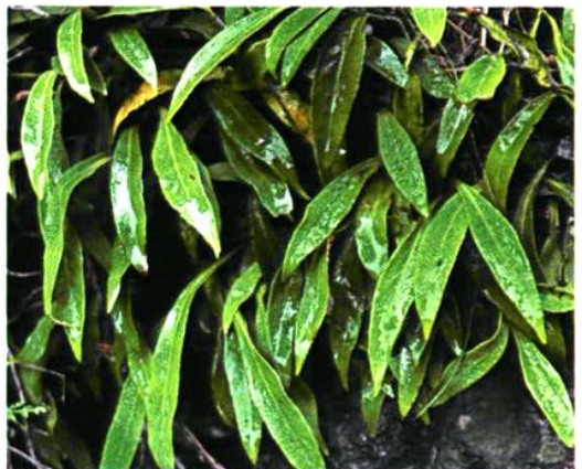
5. Pyrrosia davidii (Baker) Ching 华北石韦