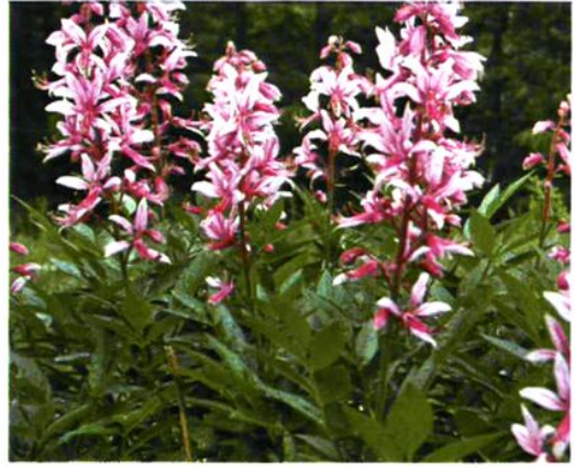
56. Dictamnus dasycarpus Turcz. 白鲜