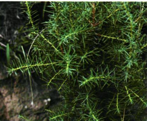
11. Juniperus rigida Sieb. et Zucc. 杜松