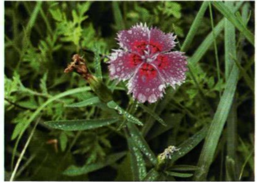
20. Dianthus chinensis L. 石竹