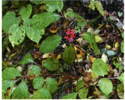
28. Paeonia lactiflora Pall. 芍药