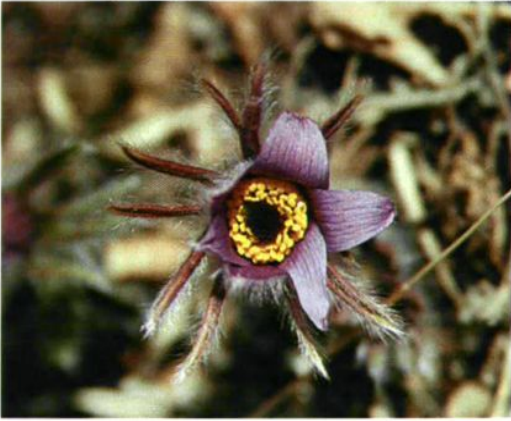
27. Pulsilla chinensis (Bunge) Regel 白头翁