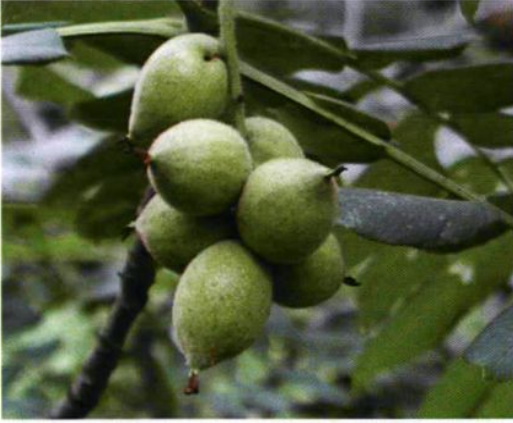
13. Juglans mandshurica Maxim. 核桃楸