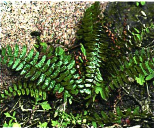
4. Polystichum craspedosorum (Maxim.) Diels 鞭叶耳蕨