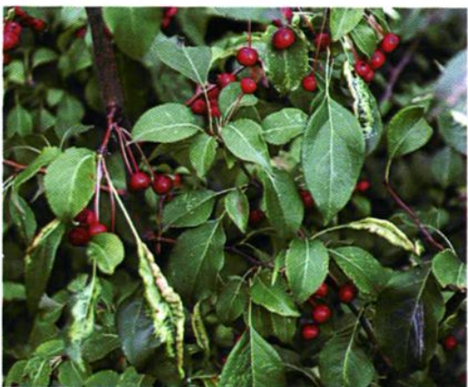
43. Malus baccata (L.) Borkh. 山荆子