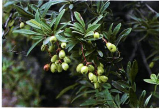
29. Berberis poiretii Schneid. 细叶小檗