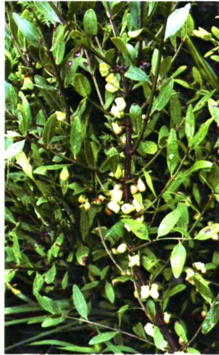
59. Euonymus alatus (Thunb.) Sieb. 卫矛