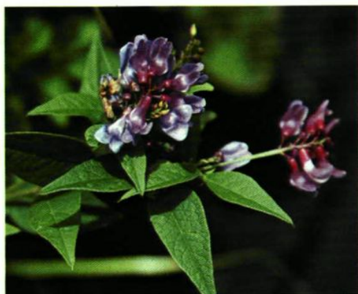
53. Vicia unijuga A. Br. 歪头菜