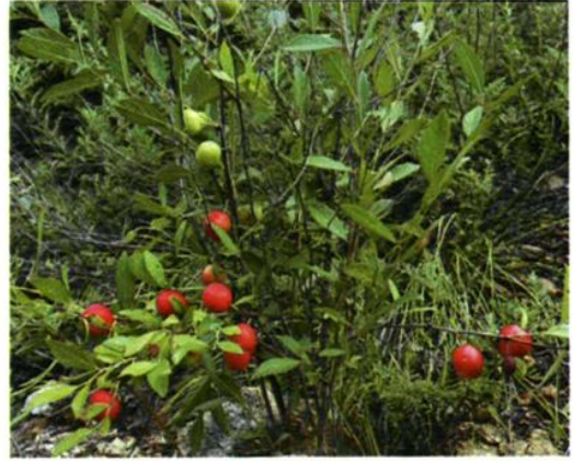
48. Cerasus humilis (Bge.) Sok. 欧李