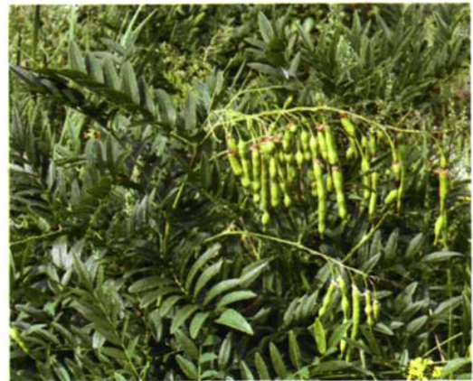
50. Sophora flavescens Ait. 苦参