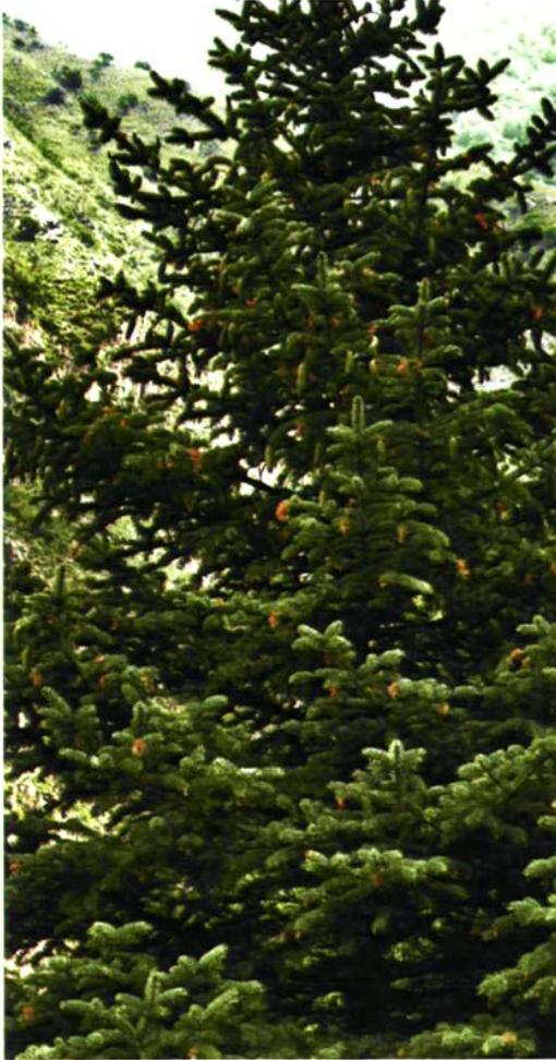
8. Picea meyeri Rehd. et Wils. 白杆