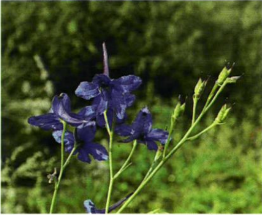
25. Delphinium grandiflorum L. 翠雀