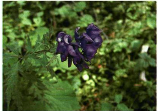
22. Aconitum kusnezoffii Reichb. 草乌头