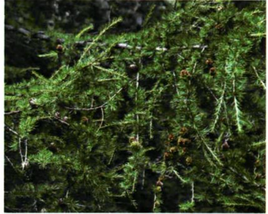
9. Larix principis-rupprechtii Mayr 华北落叶松