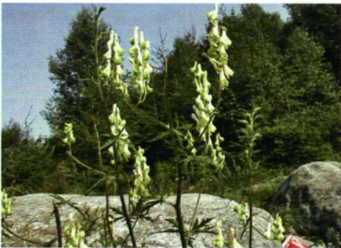
23. Aconitum barbatum Pers. var. puberulum Ledeb. 牛扁