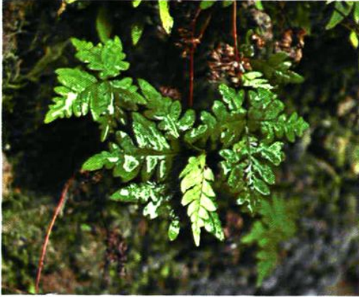
2. Aleurites argentea (Gmel.) Fée 银粉被蕨