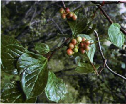
30. Schisandra chinensis (Turcz.) Baill. 北五味子