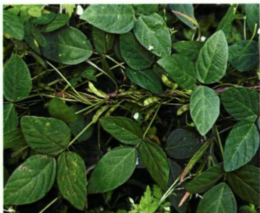
51. Glycine soja Sieb. et Zucc. 野大豆