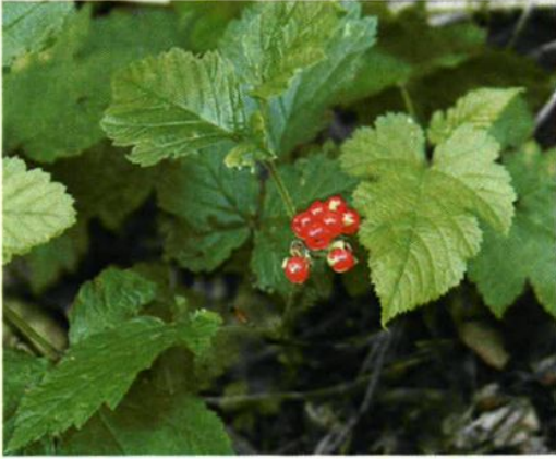
45. Rubus crataegifolius Bge. 牛迭肚