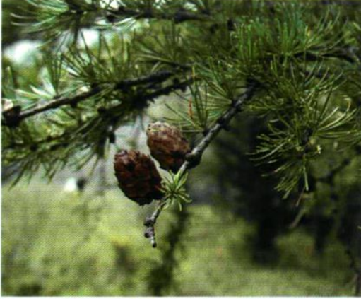
9. Larix principis-rupprechtii Mayr 华北落叶松