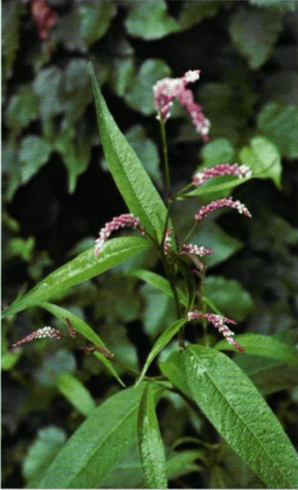
18. Polygonum hydropiper L. 水蓼