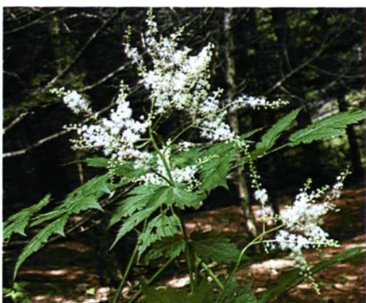
42. Filipendula palmata (Pall.) Maxim. 蚊子草