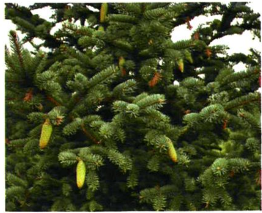
8. Picea meyeri Rehd. et Wils. 白杆