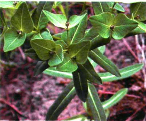
58. Euphorbia fischeriana Steud. 狼毒大戟