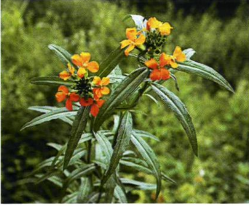
33. Erysimum bungei (Kitag.) Kitag. 糖芥