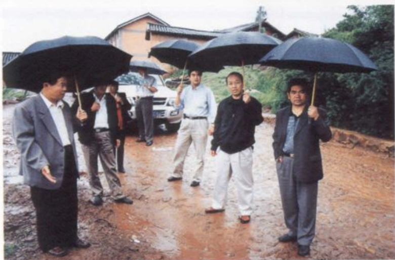
公路水毁情况调研