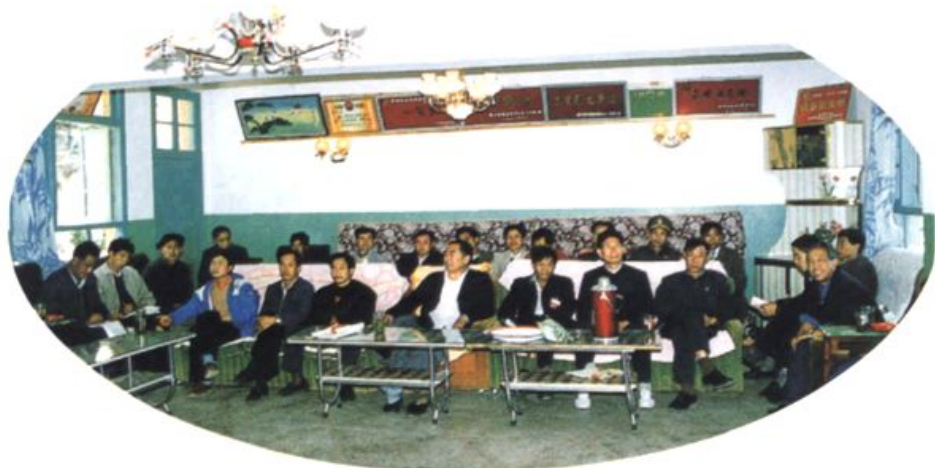
三届政协委员小组活动