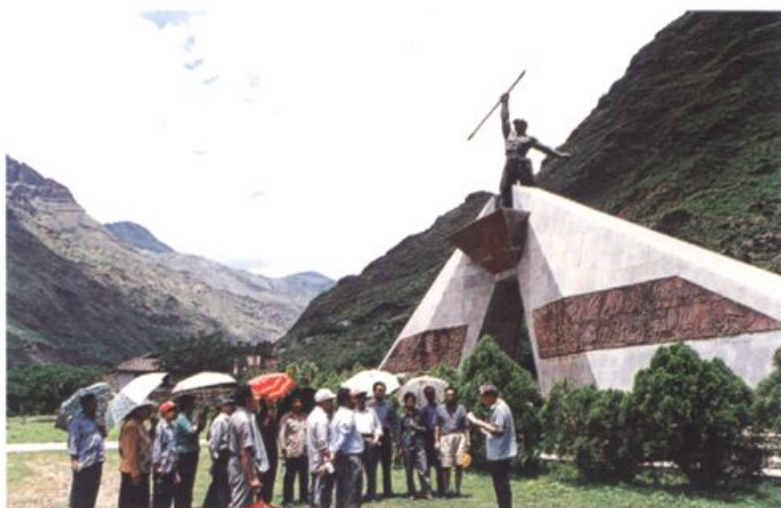
皎平集镇建设视察