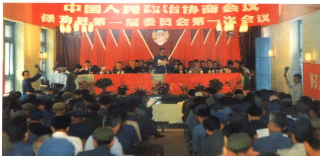
1984年4月28~5月2日，县政协一届一次全体会议 在县政府小礼堂召开