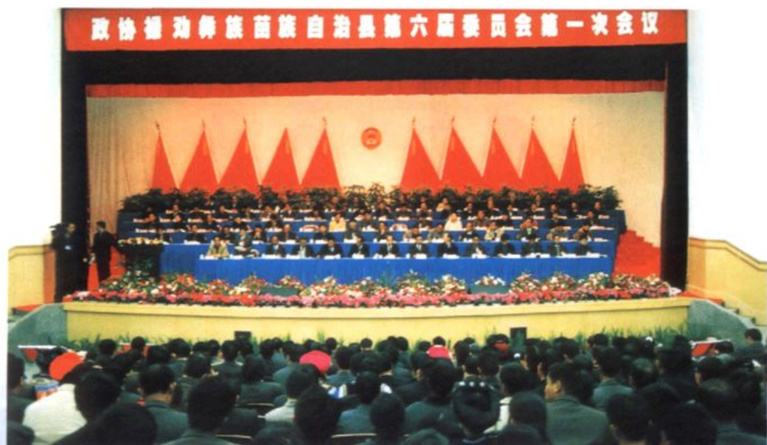
2003年2月23~27日，县政协六届一次全体会议在禄劝 会堂召开