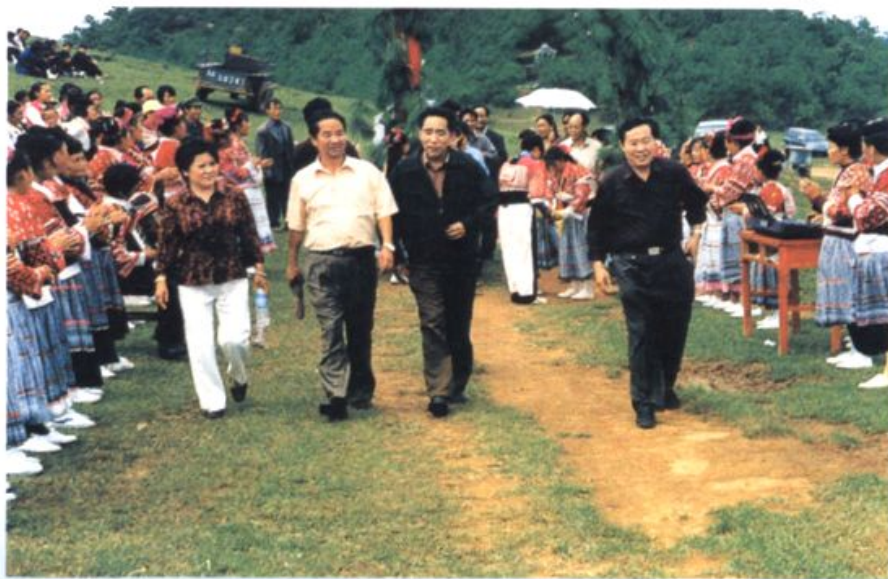
扶贫初见成效后与当地群众共度花山节