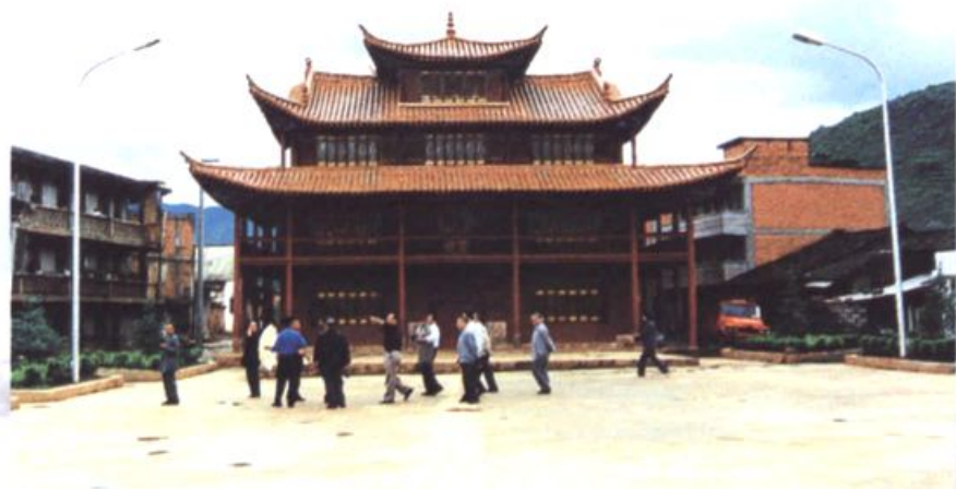
老干部视察转龙集镇建设