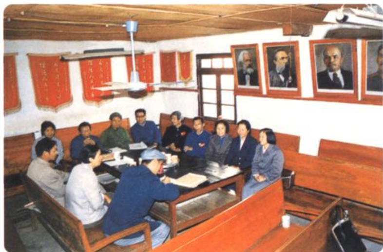
一届政协委员小组活动