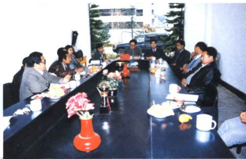
六届政协委员小组活动