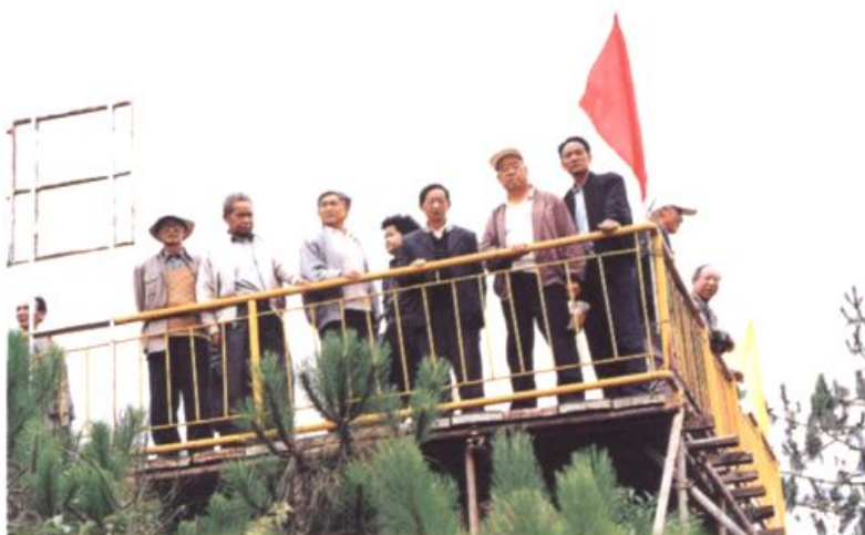
老干部视察云龙水库建设工程