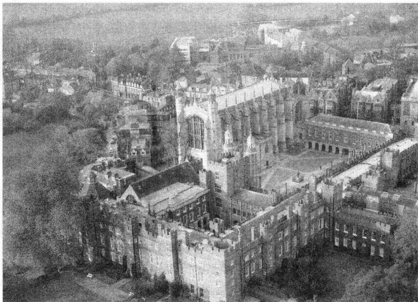
英国 1440 年建造的伊顿公学(学校有教堂、修道院辅助建筑)

欧洲的建筑,尤其是教堂,多为尖顶,犹如一把利剑直刺天空,这恰恰是西方“征争文化”的象征。征争文化强调的是征服自然,改造自然。而与之截然相反的中国和合文化,是反对把天与人割裂、对立,主张“天人协调、天人合一”。正因此,中国的很多寺庙都是顺山势走向而建,绵延起伏的长城建筑也是如此,就是怕伤了山的“脉气”。