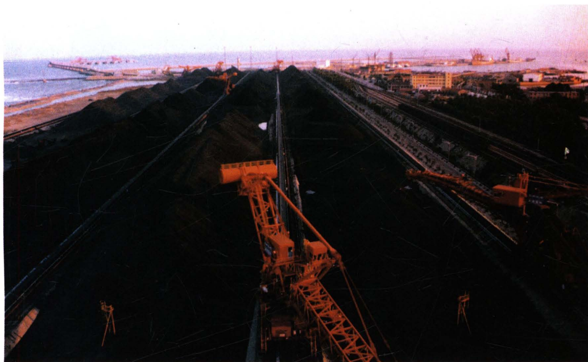
石臼港全貌