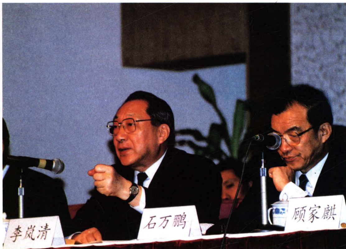
在 1996 年全国口岸工作会议上,李岚清副总理做重要指示