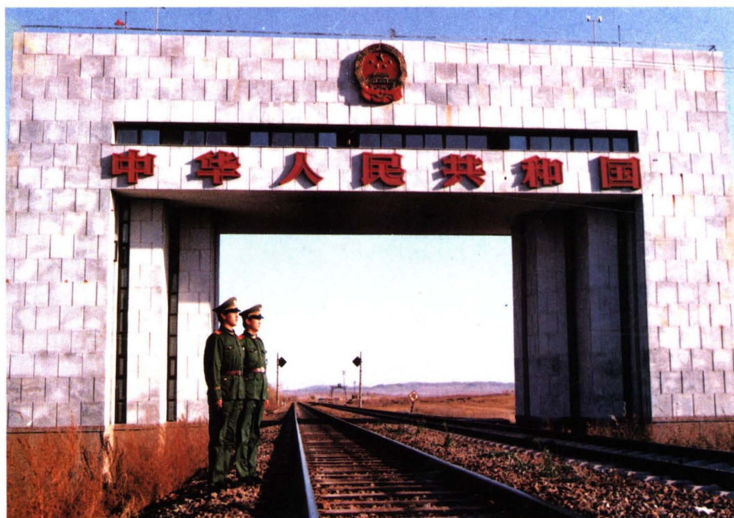
满洲里口岸国门