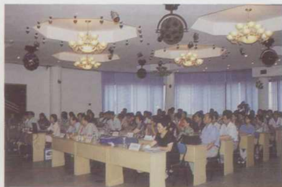
市七院长肝病科成立30周年学术报告会会场