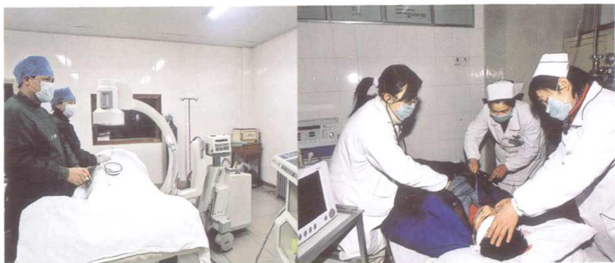
C字臂X光机下冠状动脉造影