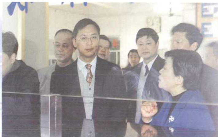
武昌区委书记罗长刚（时任区长）视察医院