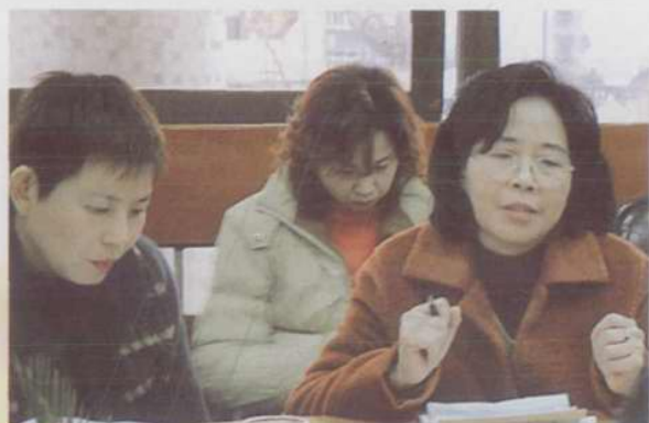
乙肝核心抗原成果获国家专利