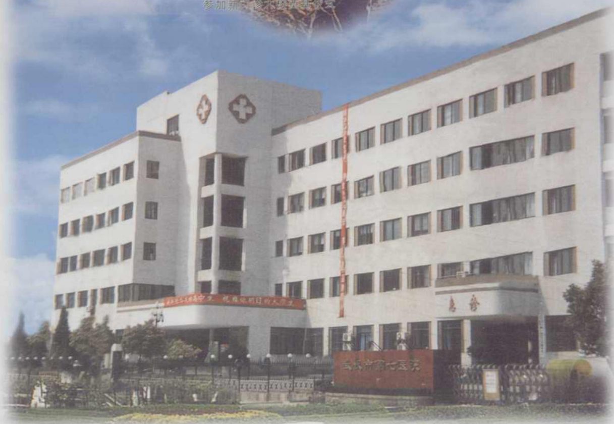
市七医院门诊大楼