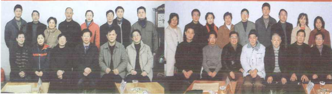
项目技术成果鉴定会