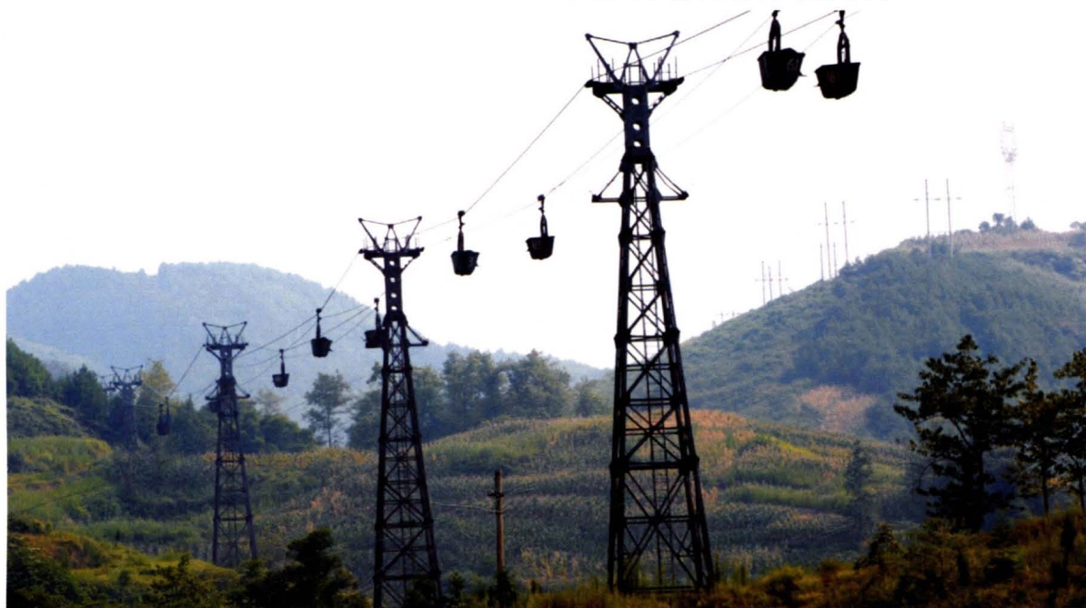
广能集团绿水洞煤矿空中运煤索道