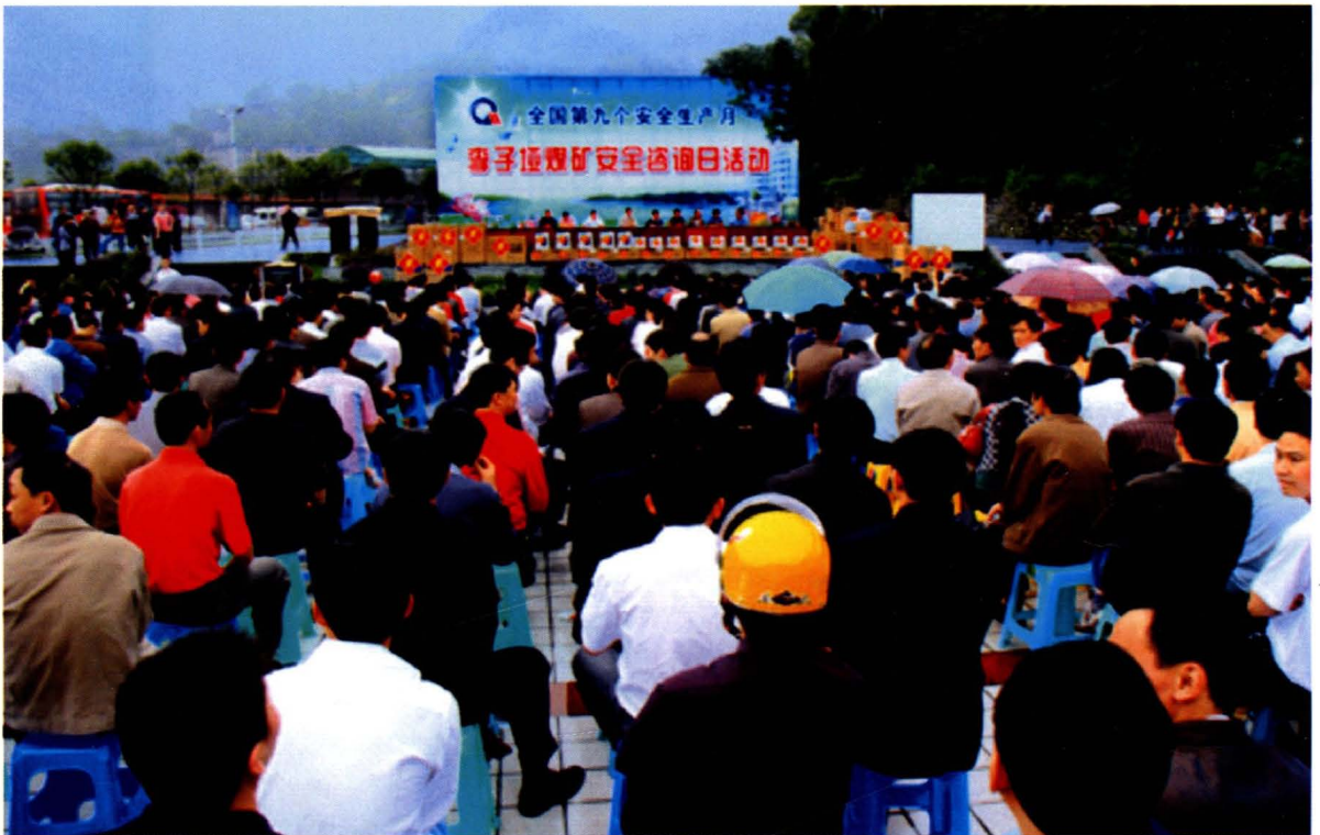
广能集团举行全国安全咨询日活动