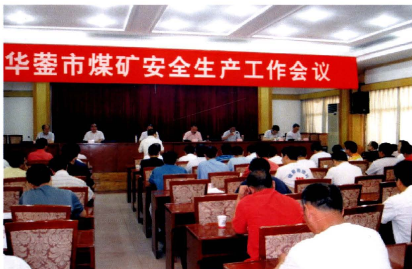
华蓥市每月定期召开煤矿安全生产工作会议