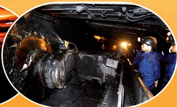
绿水洞煤矿大倾角综合采煤工作面