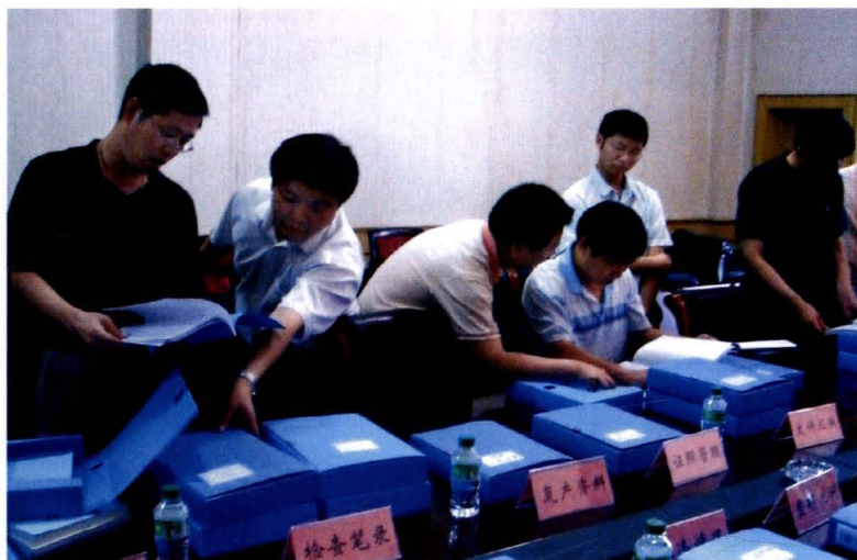
2008年5月，国家督察组一行在华蓥检查煤矿安全生产工作