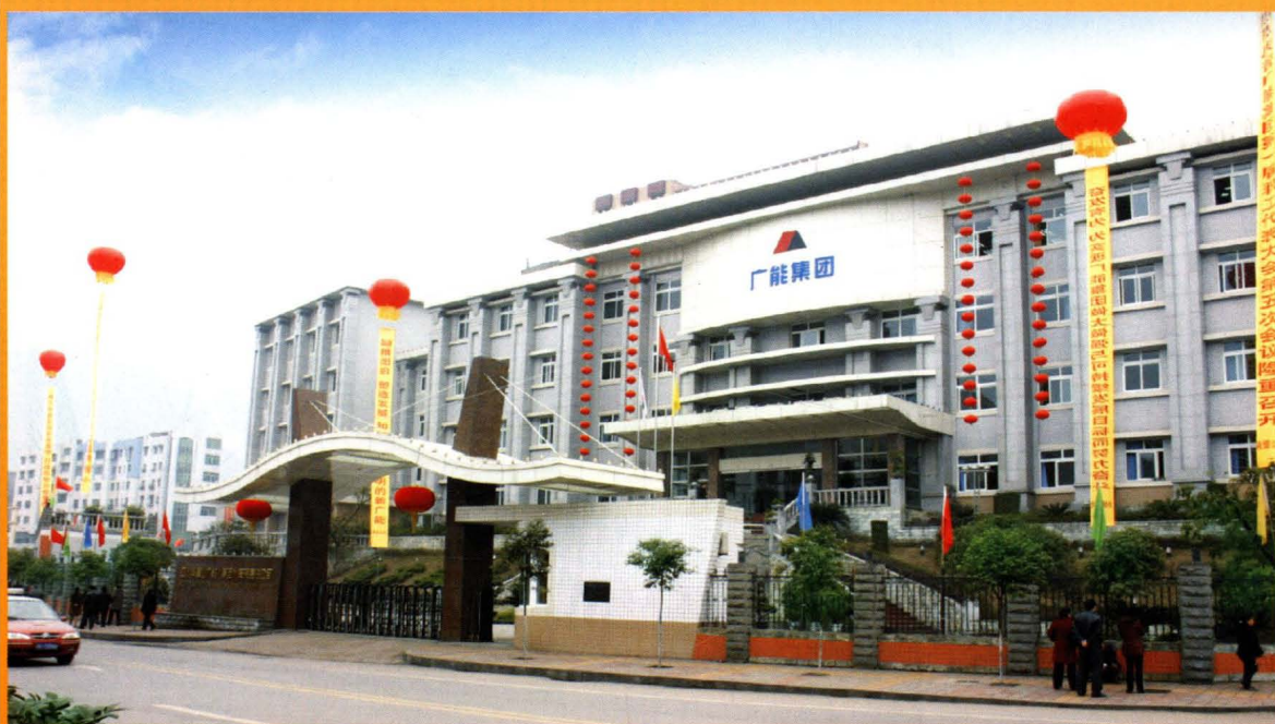
广能集团公司办公楼