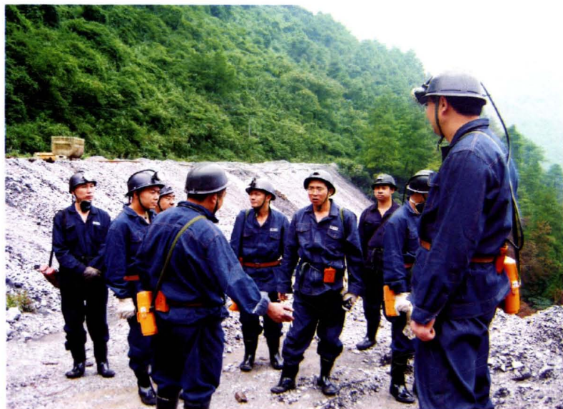
华蓥市政府市长欧太元 检查煤矿安全生产工作