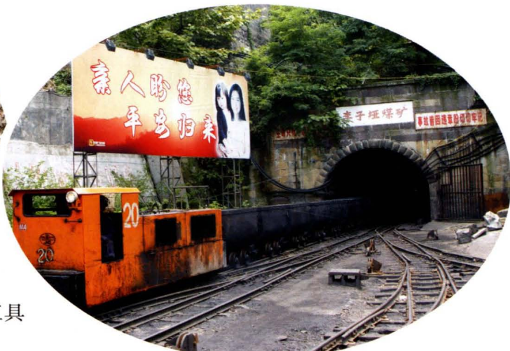
华蓥山矿务局现代运输工具