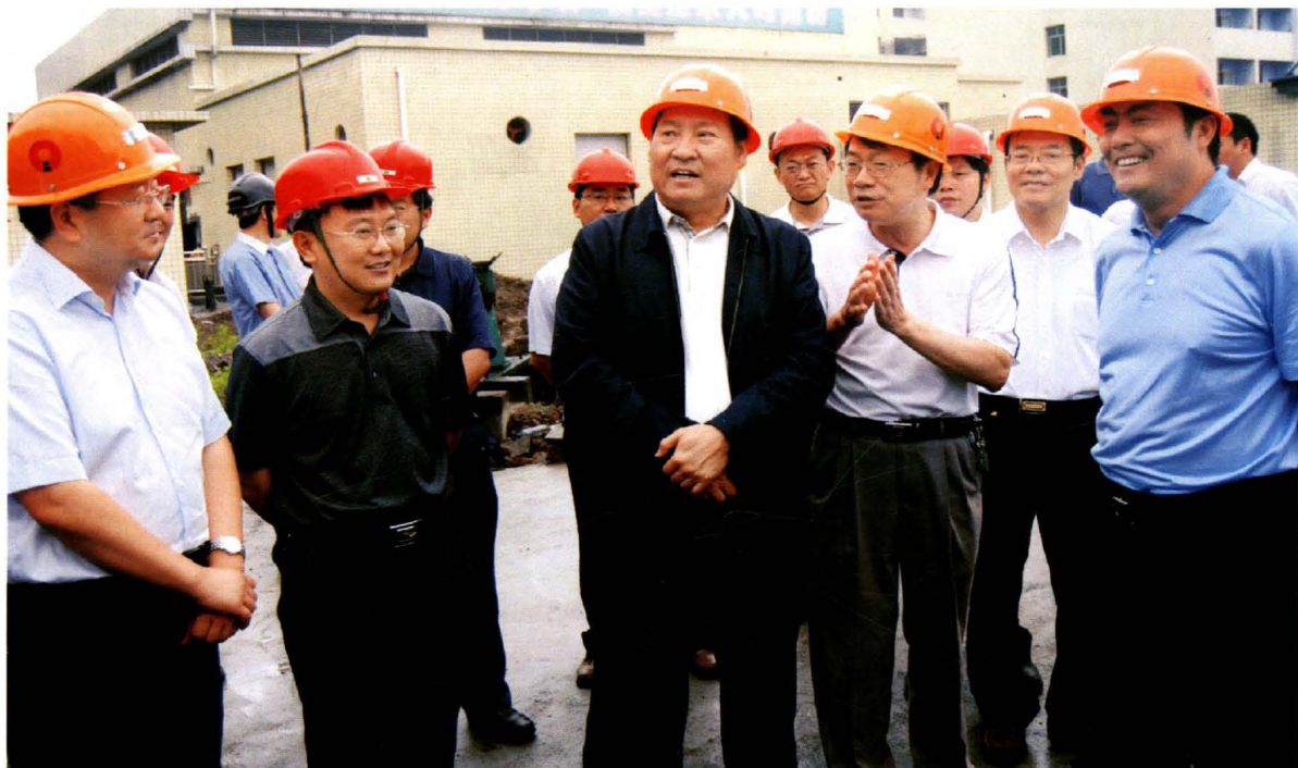
2009年6月20日，国家煤监局局长赵铁锤（左三）在广能集团公司龙滩煤矿调研