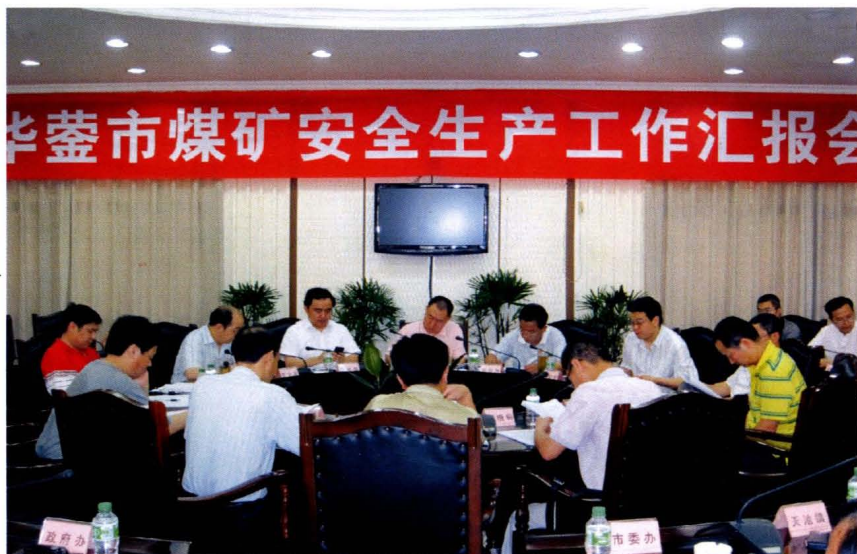
2009年6月25日，四川煤监局领导听取华蓥市煤矿安全生产工作汇报