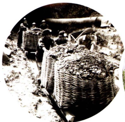
华蓥山矿务局建设初期运煤工具