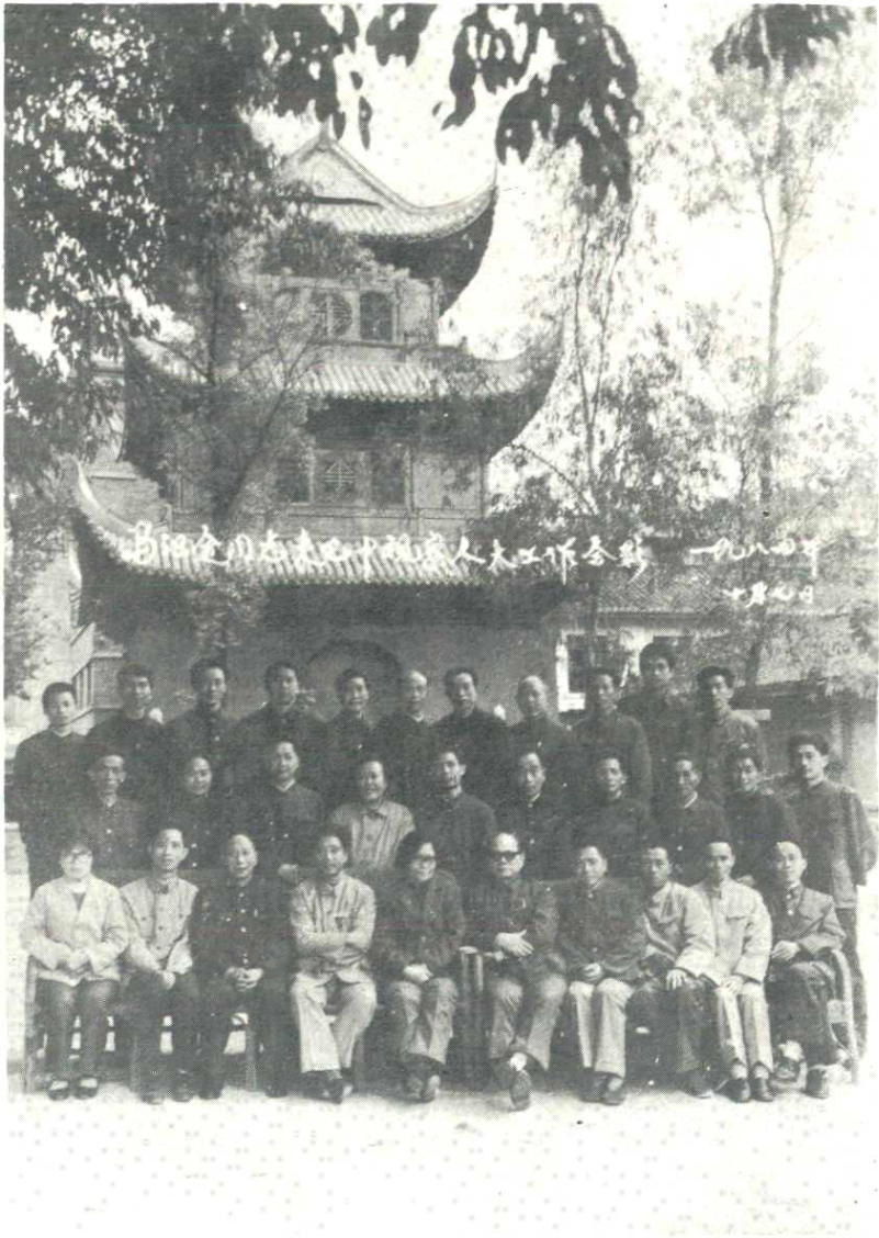
四川省人大常委会副主任马识途同志来巴中视察人大工作时与县级党政领导及县人大常委会机关全体同志合影 右起第五人为马识途同志