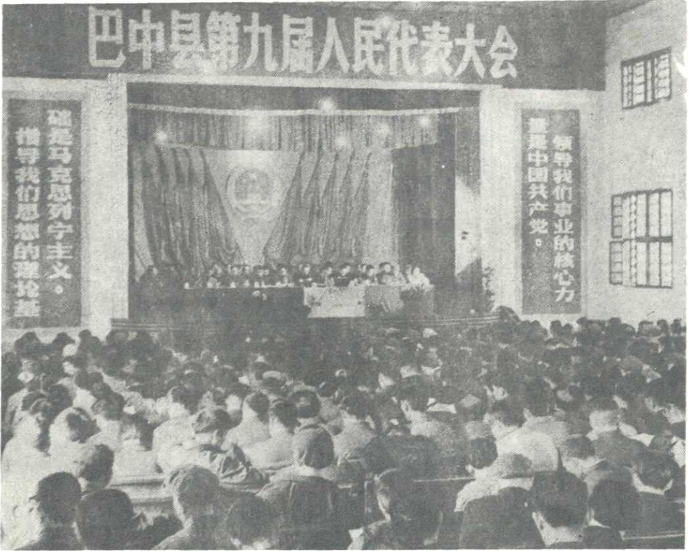
巴中县第九届人民代表大会第一次会议开幕