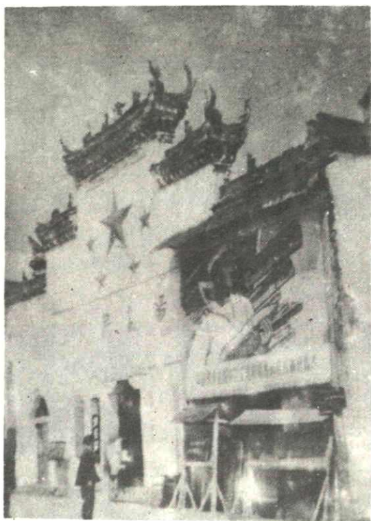
川 陕 省 第 三 次 工 农 兵 代 表 大 会 会 址