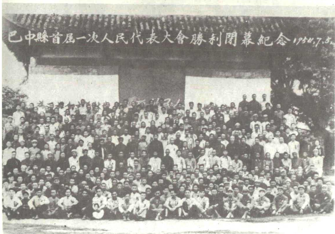
巴中縣首屆人民代表大會第一次會議閉幕合影