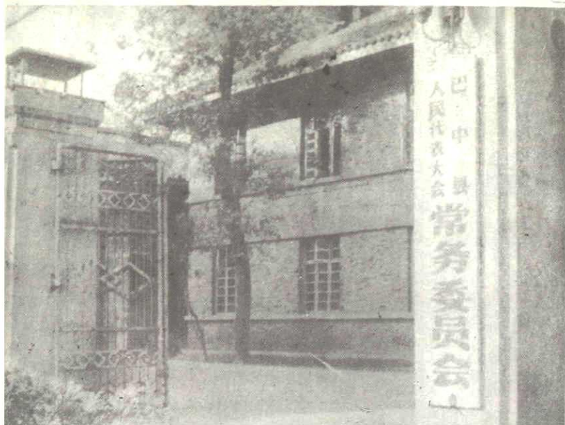
巴中縣人大常委會辦公地址