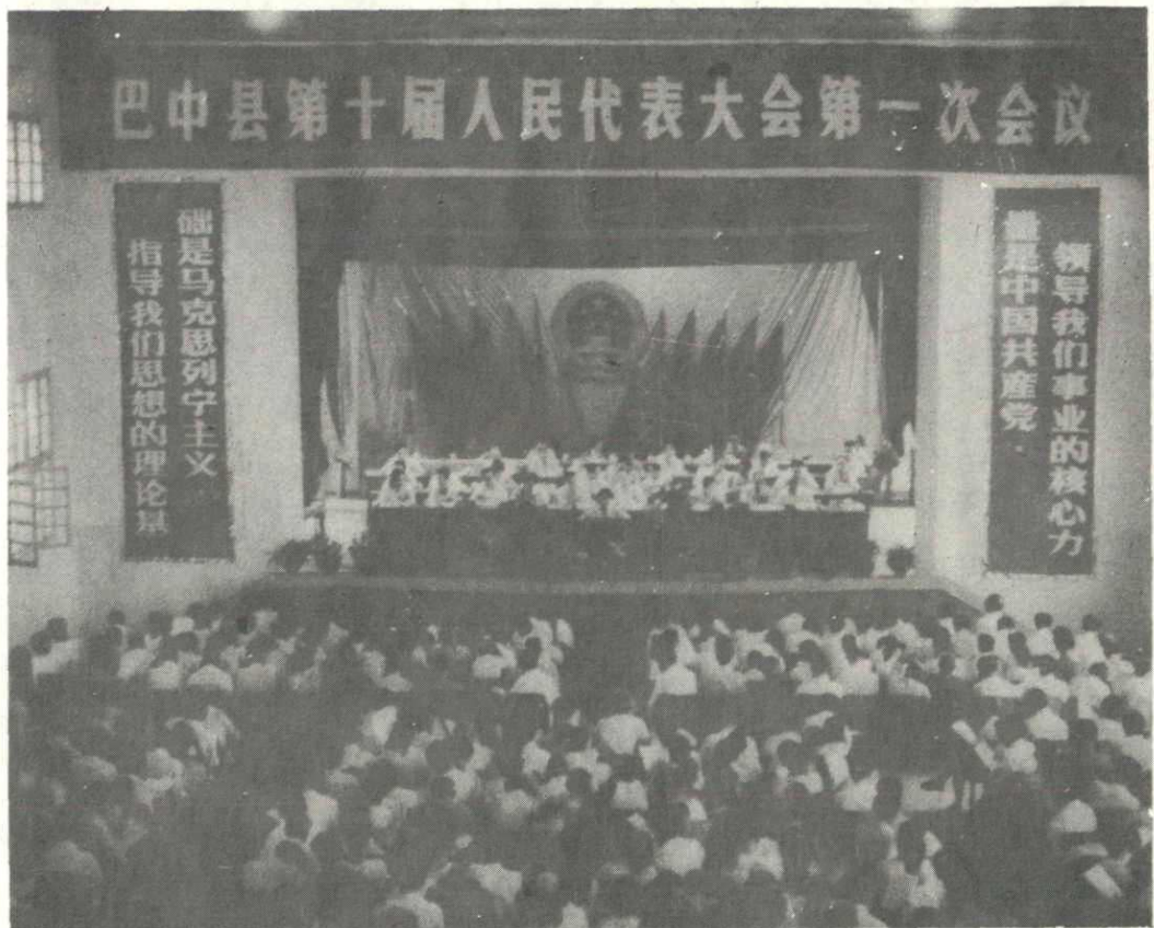
巴中县第十届人民代表大会第一次会议开幕