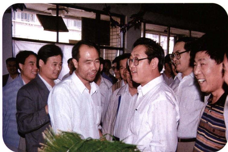
1998年11月，省长孙文盛（右三）在绛县视察