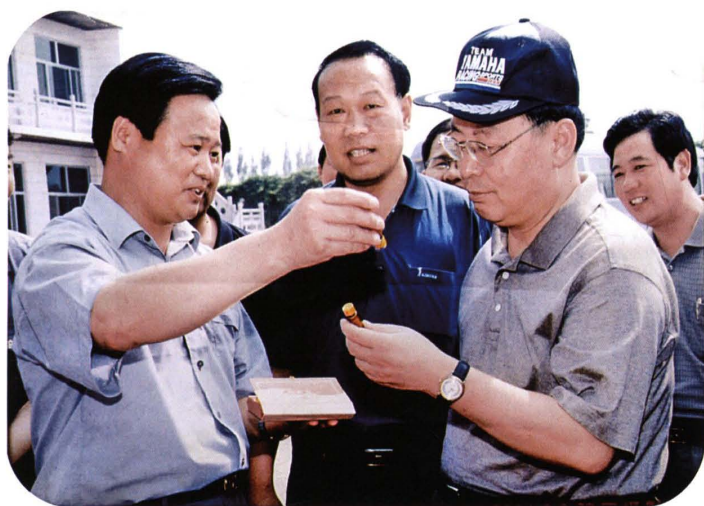
2001年6月，省委书记田成平（前排右一）在绛县视察