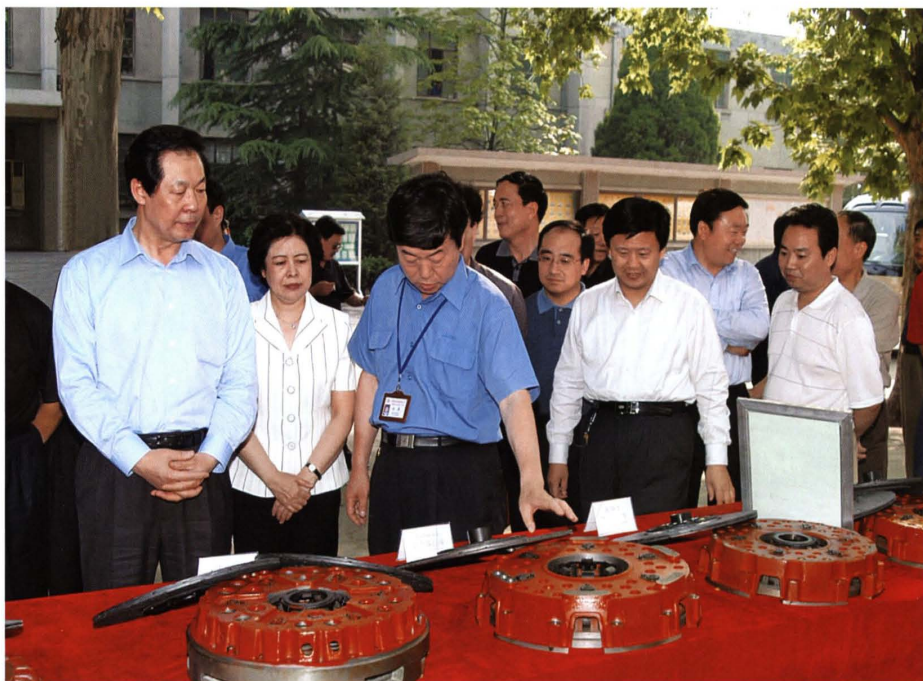
2005年5月，省委书记张宝顺（左一）、副省长胡苏平（左二）在绛县视察