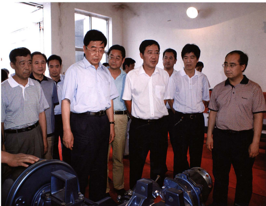
2008年7月，省长孟学农（前排左二）在绛县视察企业