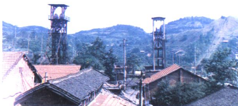
1968年建成投产的蛇形山井