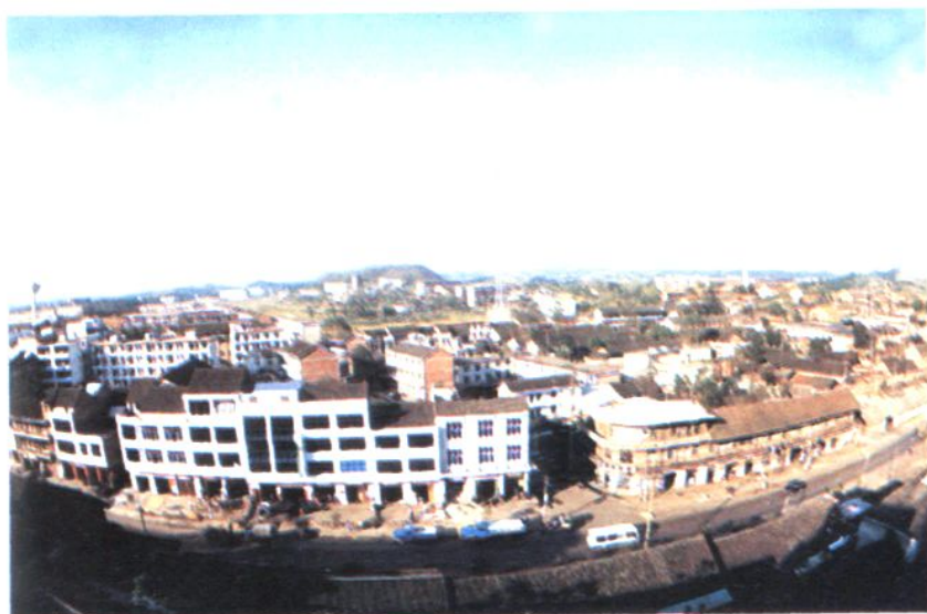
生产优质主焦煤的牛马司煤矿