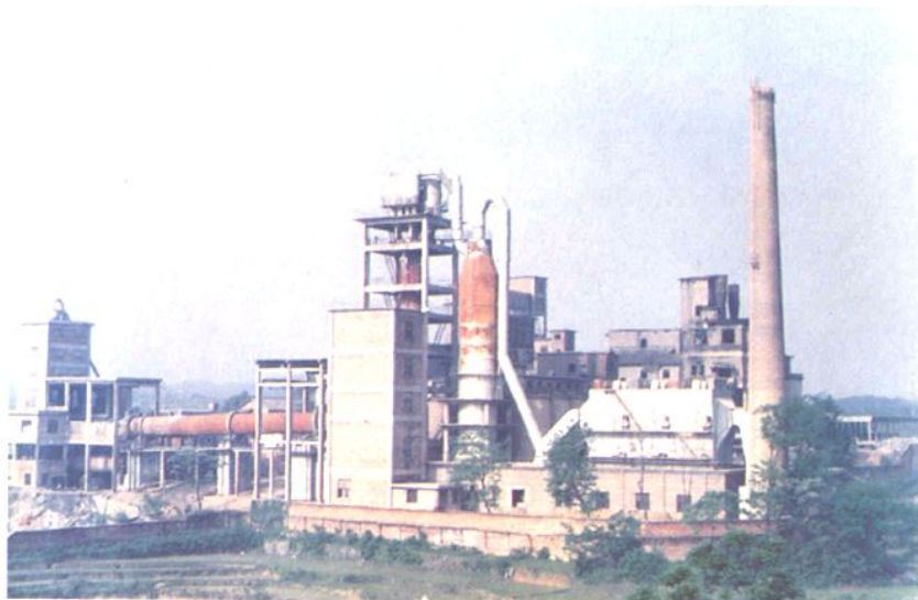
设计年产能力14万吨 的涟邵矿务局水泥厂