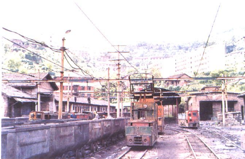
设计年产能力 60 万吨的 利民煤矿平硐井口运输线