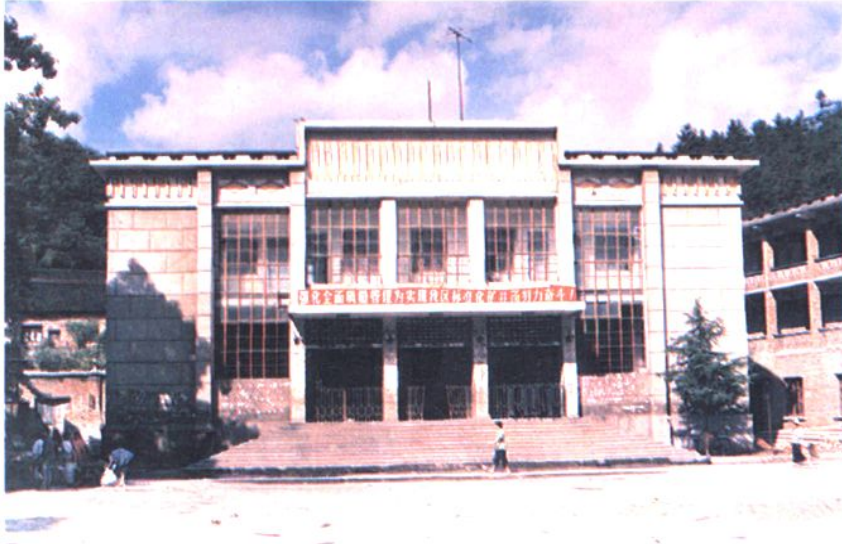
60年代建成的省煤炭 基建二处办公楼