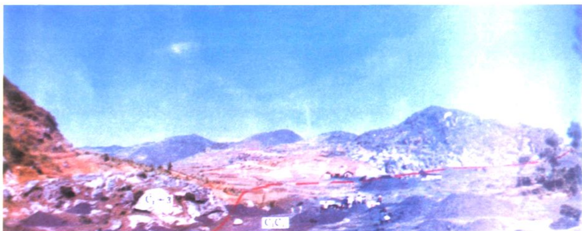
湘中渣渡矿区东段金盘仑断层导致壶天群灰岩与测水组5号煤层直接接触