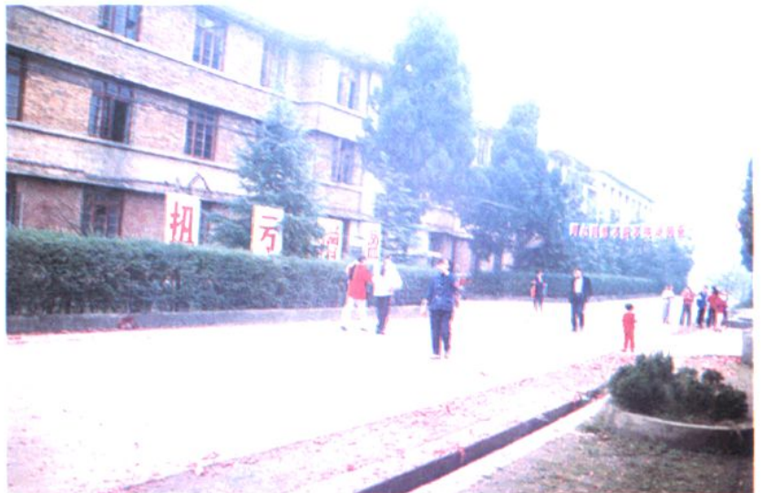
1964年建成的洪山殿 煤矿矿部