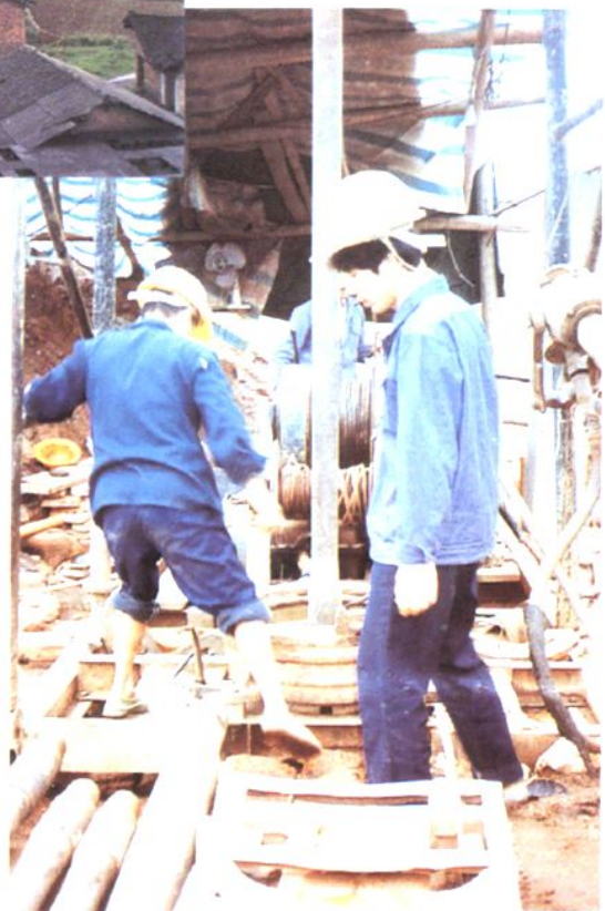
涟邵地质钻探队在野外施工钻孔