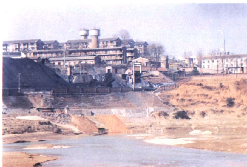
位于大洋江畔的 芦茅江煤矿