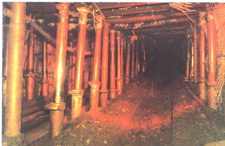
矿井单体液压支柱工作面