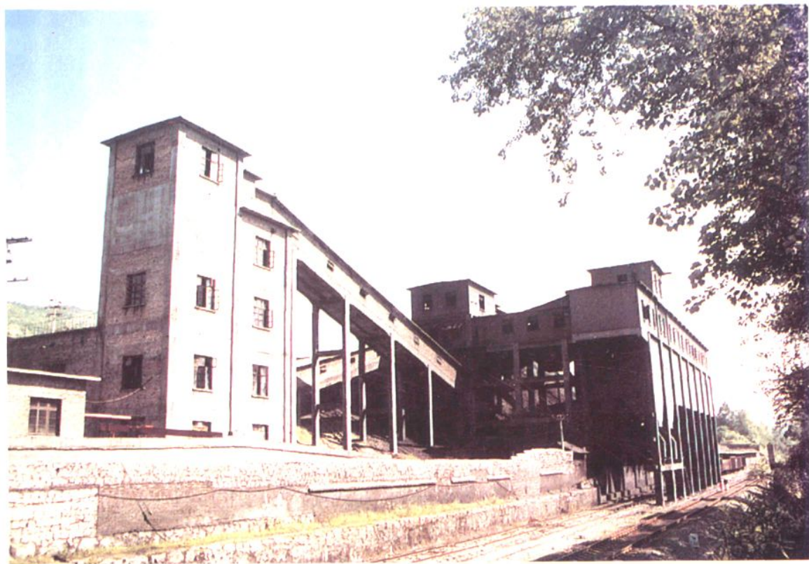
金竹山矿土朱工区现代化煤仓