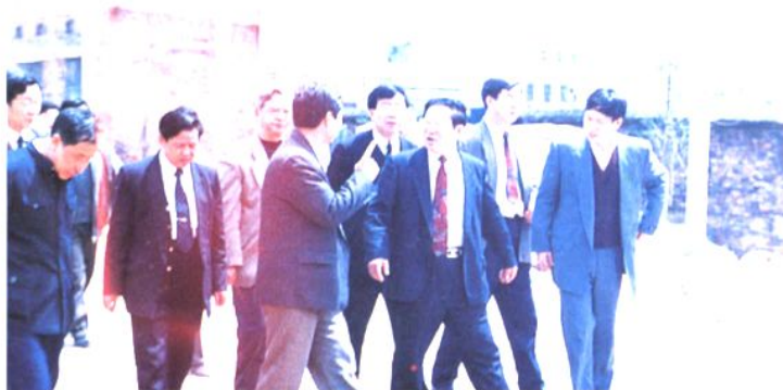
煤炭部副部长朱登山视察桥头河矿碳酸钙厂