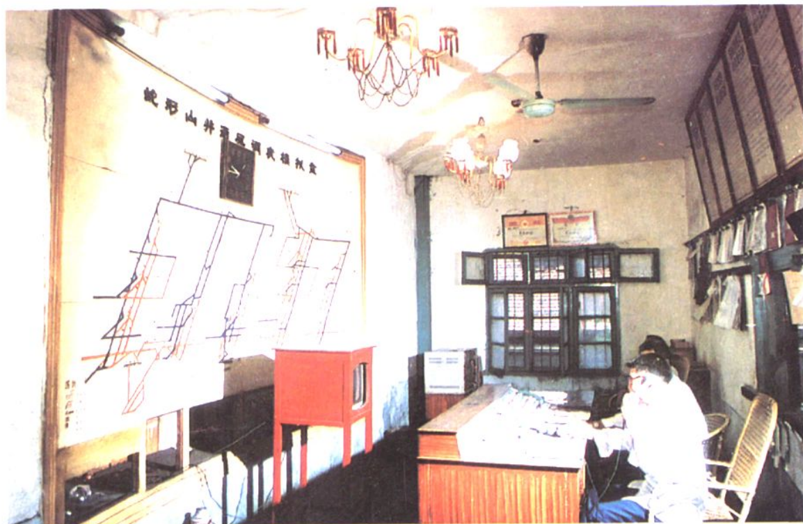
洪山殿煤矿蛇形山井通风调度模拟盘