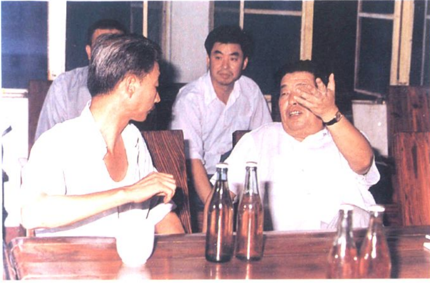
1987年8月，湖南省省长熊清泉视察涟邵矿务局