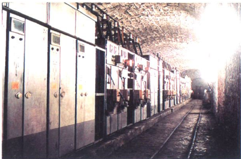
地处湘中大水矿区的恩口 煤矿井下中央变电所