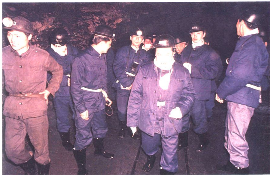
1990年6月，湖南省省委副书记、省长陈邦柱在斗笠山煤矿井下视察