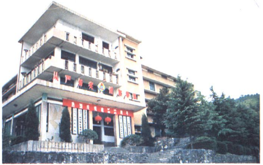
70年代中期建成的 利民煤矿办公楼