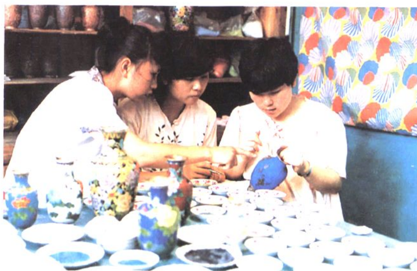
恩口瓷厂生产的瓷器