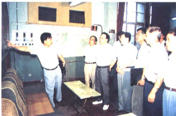
煤炭工业部部长王森 浩在涟邵矿务局视察