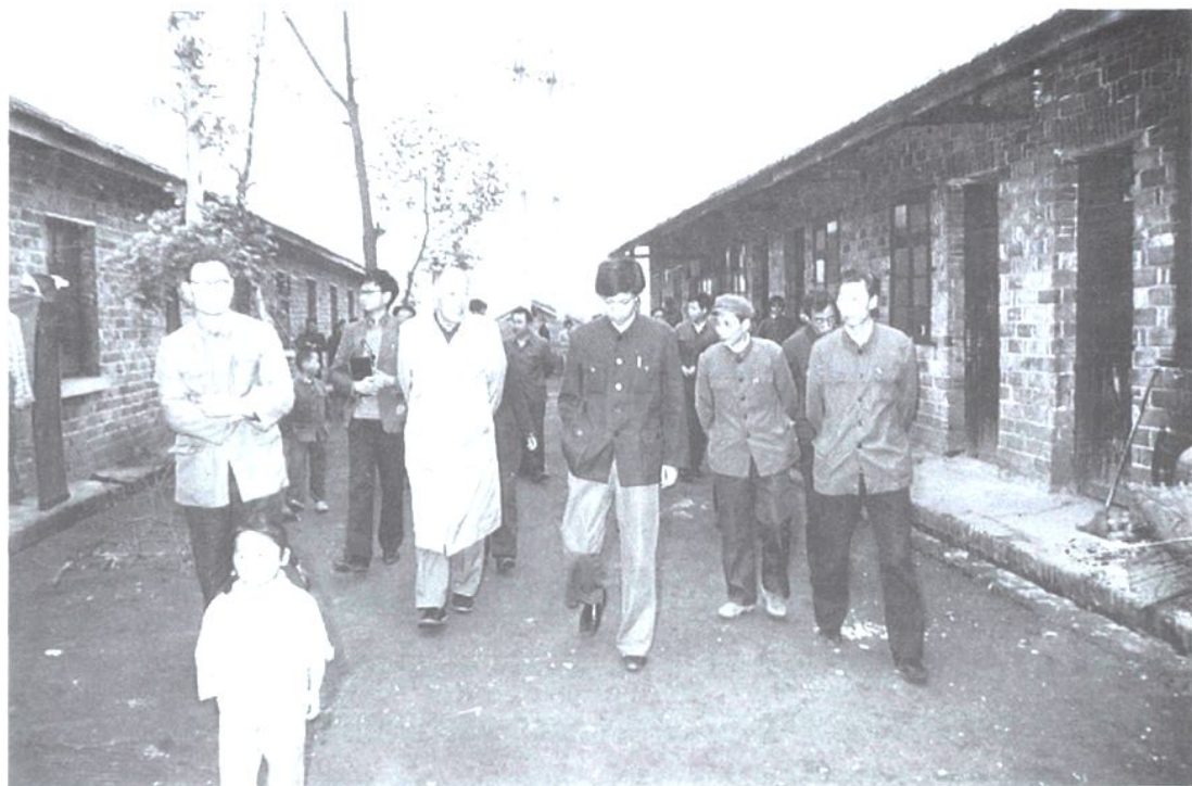
1986年5月，煤炭工业部副部长邹桐视察斗笠山煤矿家属区