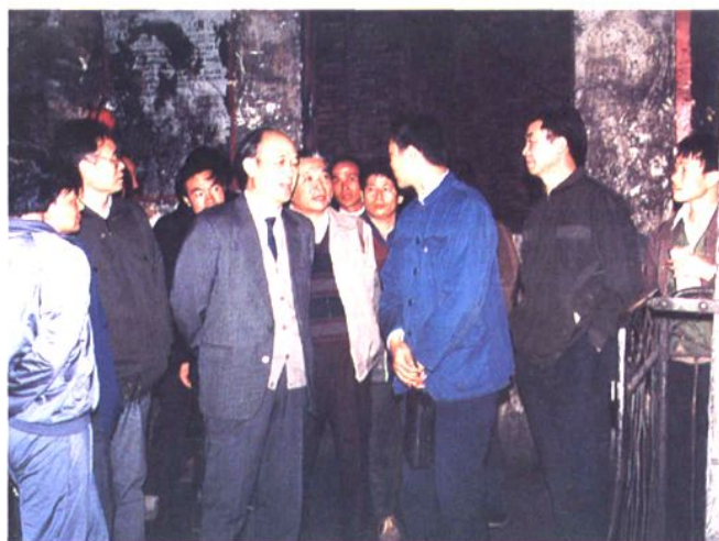
能源部部长黄毅诚 在斗笠山煤矿视察