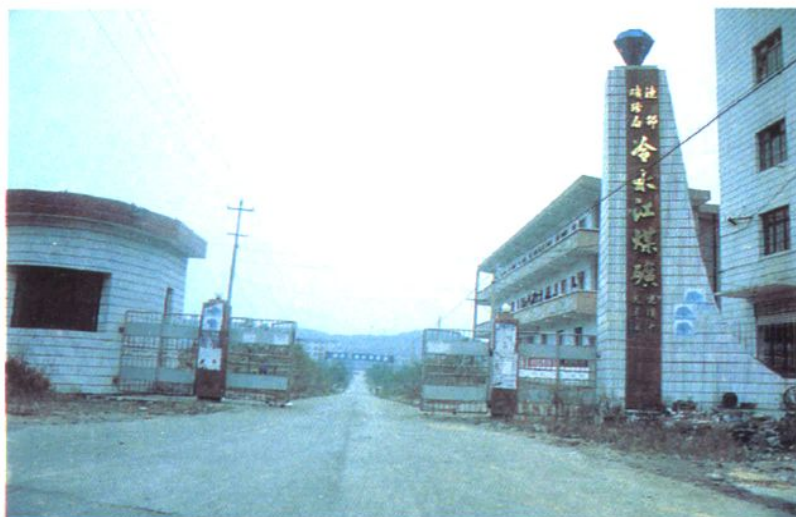
1985年建成的 冷水江煤矿