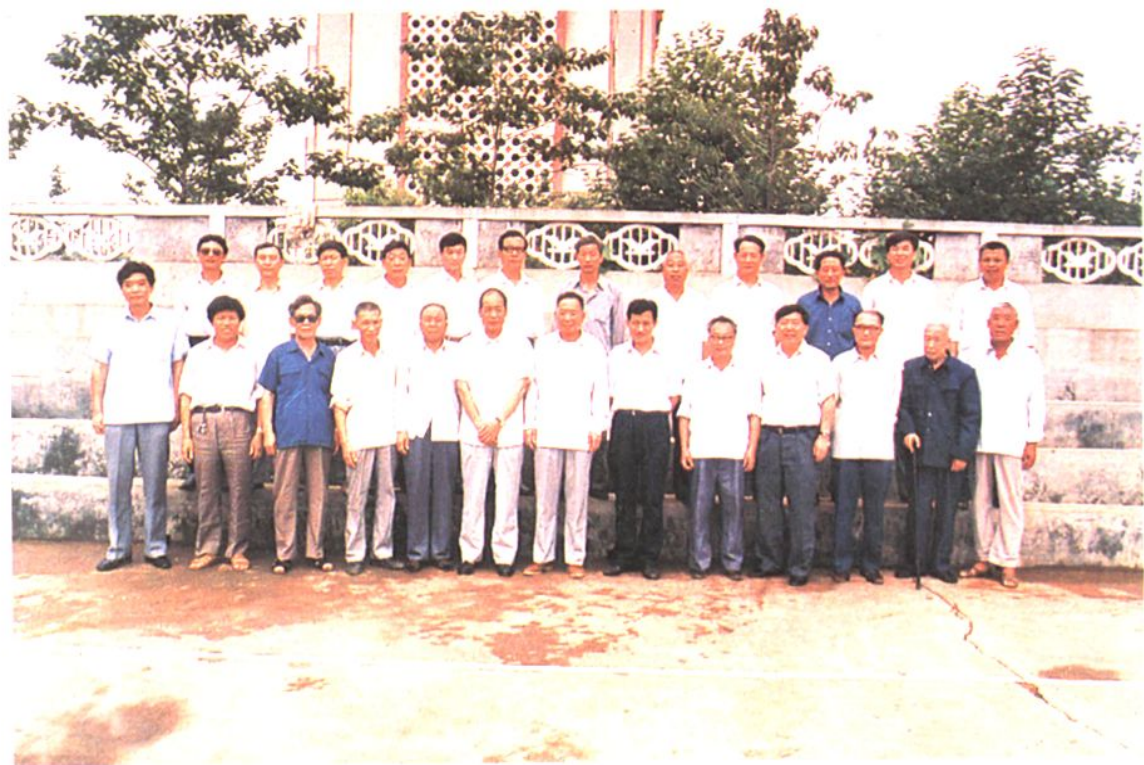
参加建局三十周年座谈会的历任局领导