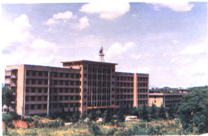
1981年在娄底市区建成的涟邵局办公楼