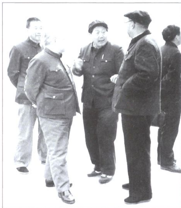
1986年12月12日，煤炭工业部部长于洪恩视察涟邵矿务局