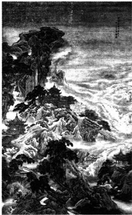
袁江、袁耀《蓬莱仙境图》

而作为地名出现的蓬莱,追根溯源应寻找到汉武帝刘彻。他在方士们的诱导下来到远离中原的东夷边地寻求海上神山,结果一直没能如愿。于是便在海边筑起一座小城,命名蓬莱,聊以自慰,从此便有了蓬莱这一地名,也便有了与仙山蓬莱并立的人间蓬莱。由于人间蓬莱与传说中的仙山蓬莱离得很近,加上帝王们海上求仙故事的大肆渲染,这两种概念不同的蓬莱便常常被人们混淆在一起,把此蓬莱当成了彼蓬莱。蓬莱,是蓬莱人用几千年的文化堆积起来的蓬莱。它的名字从仙界落到人间,同时有着文化的加入,薪火相传,在汹涌澎湃的黄渤二海之滨,永远闪烁着迷人的光芒。