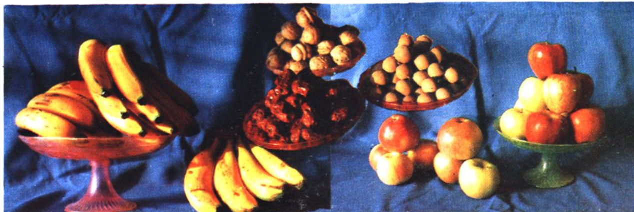
省农副产品公司主营的干、鲜果品