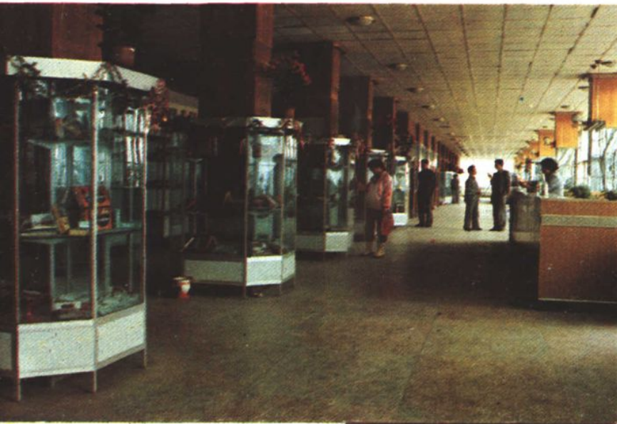
农副产品大楼批发 大厅