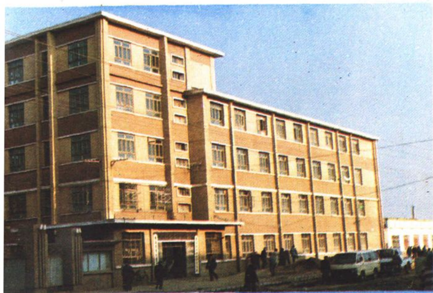
新建成的农副产品 营业大楼