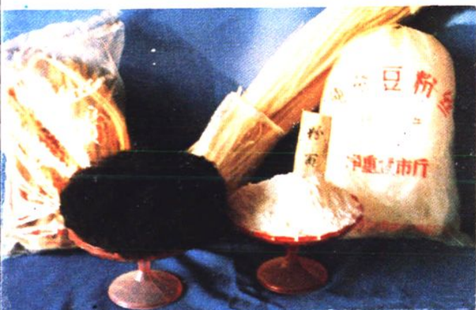
省农副产品公司主营的干菜 调味品