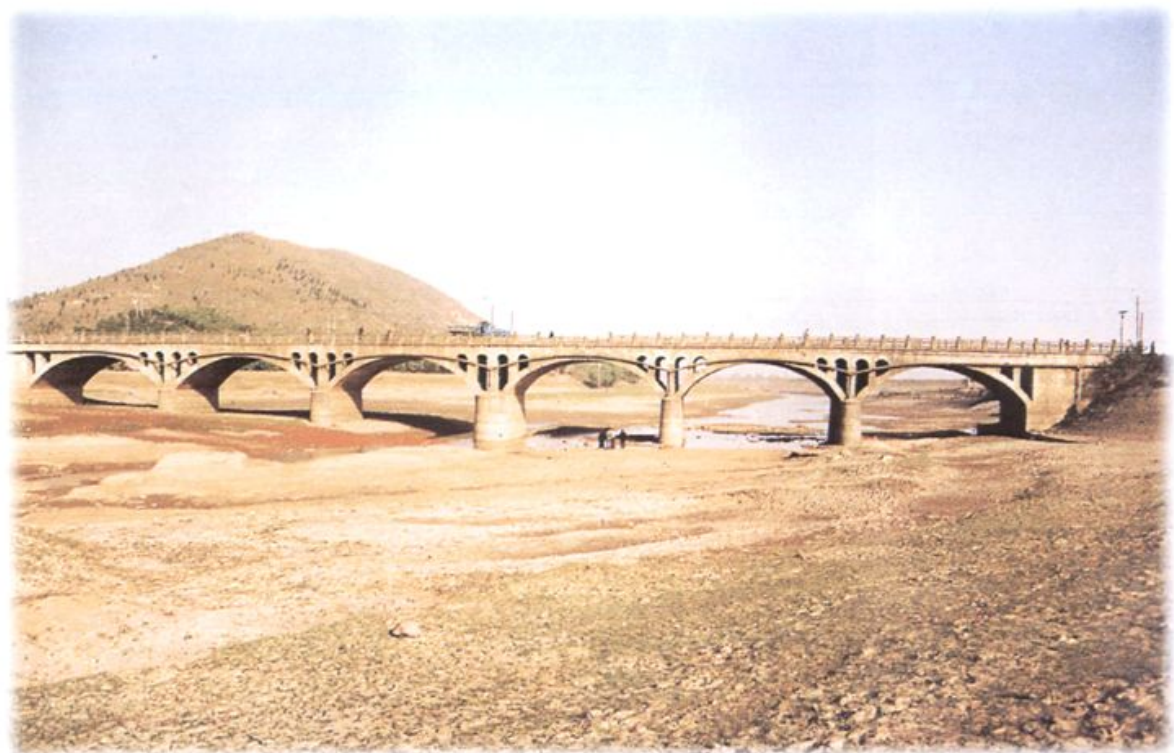
铜陵市最长的石拱桥——顺安大桥