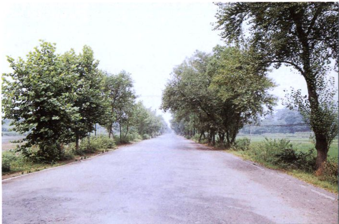
繁（昌）木（镇）路之一段