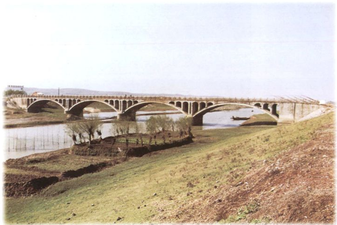
铜陵市最长的钢筋混凝土双曲拱桥——黄浒大桥