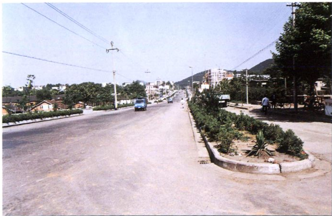
拓宽改造后的铜官路