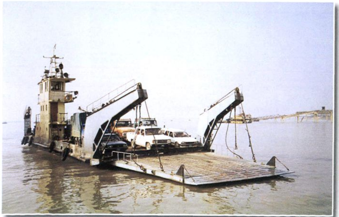
自航渡船在长江中航行