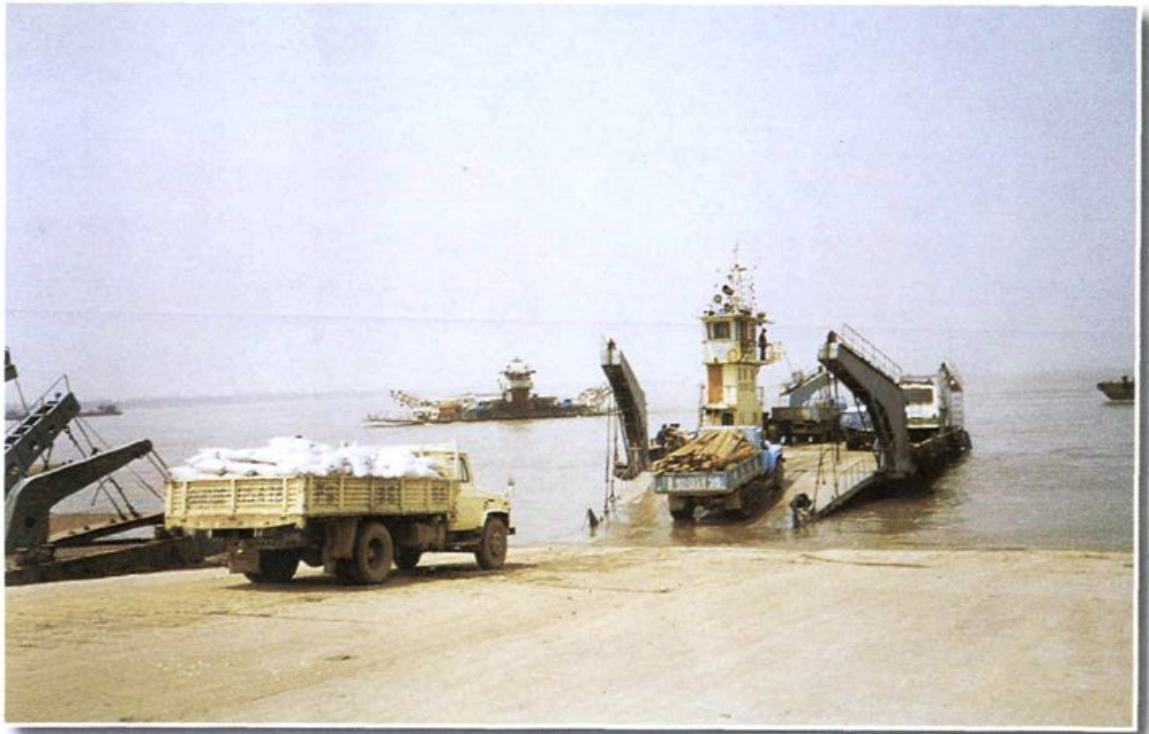
铜陵长江汽车轮渡码头