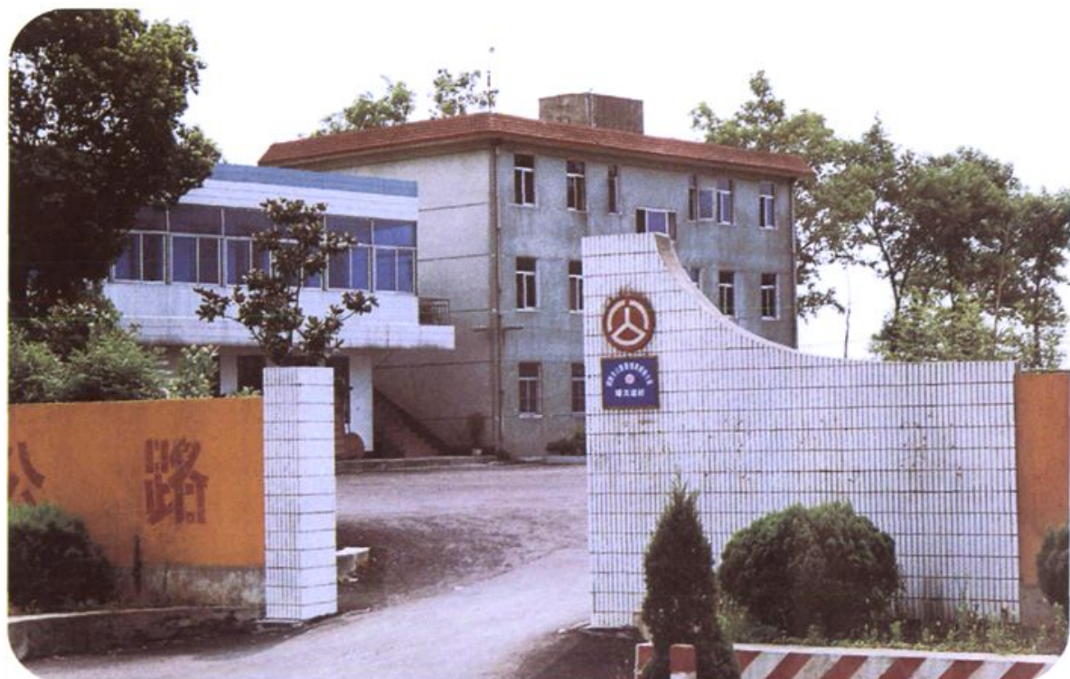
铜陵市文明道班之一——蟠垅道班