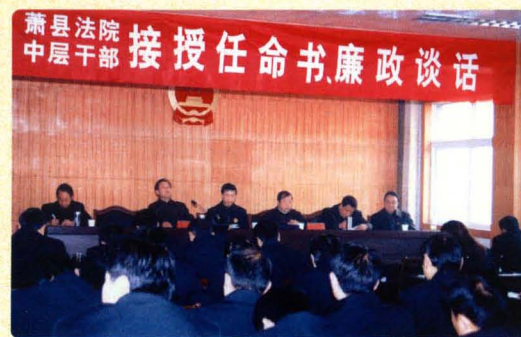
新任中层干部接受任命书、廉政谈话。