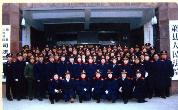
换装前院机关干警合影