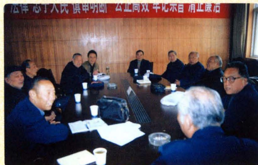
离退休老干部支部在座谈讨论