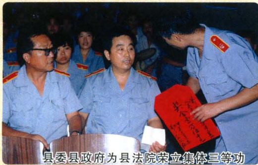
县委县政府为县法院荣立集体三等功 召开表彰奖励大会。