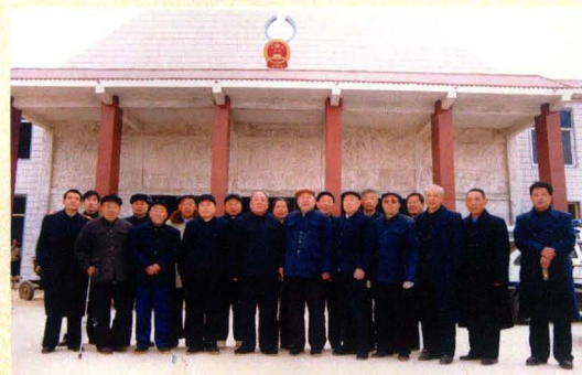
组织离退休干部参观基层法庭建设成果