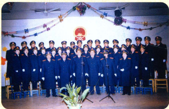
春节联欢会上,院党组班子与干警大合唱。