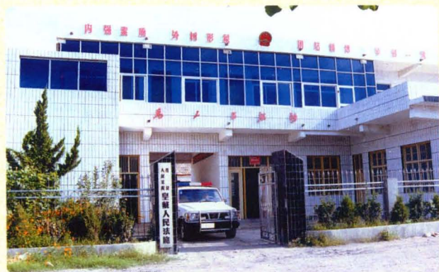
规范化建设的皇藏人民法庭外貌