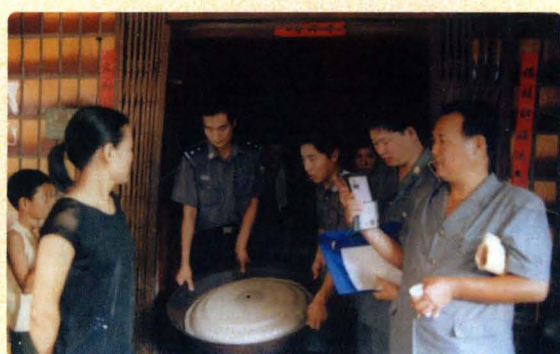
严格执法 文明执行