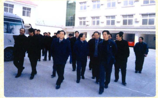
省市县领导来院检查指导工作