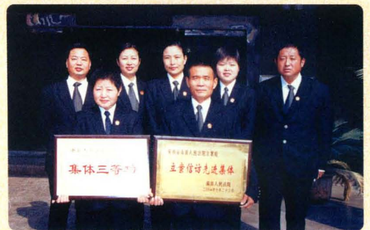
立案信访工作受到省高院和最高院的表彰