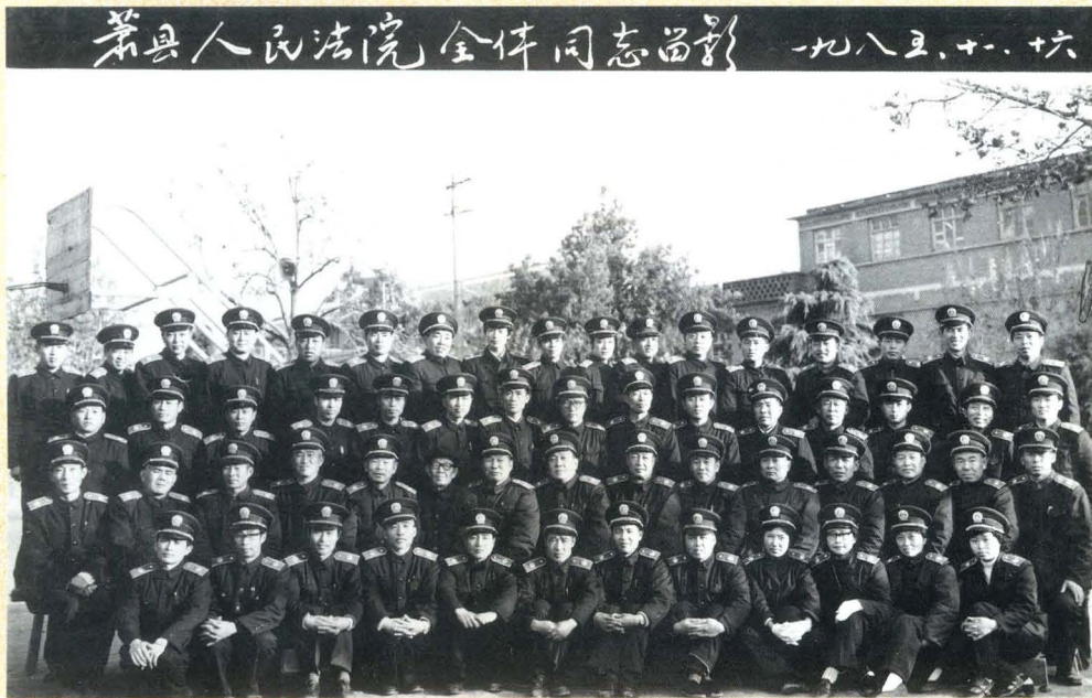
1985年县法院全体同志合影