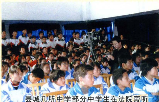
县城几所中学部分中学生在法院旁听 案件审理、接受法治教育。