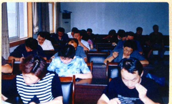
中层领导闭卷测试法律业务