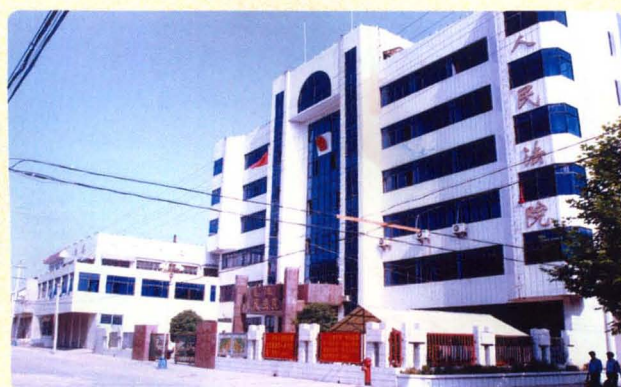
1995年建成的县法院办公审判大楼外貌