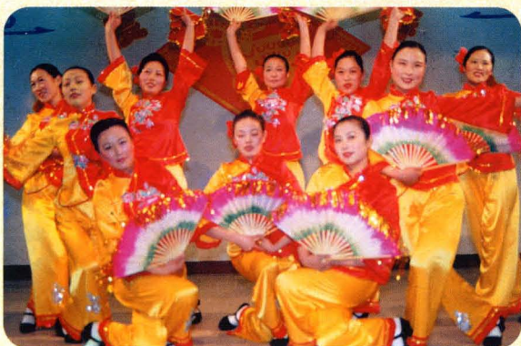
女法官们靓丽的舞姿