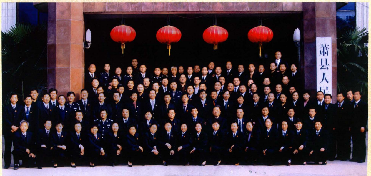
2005年县法院全体人员合影