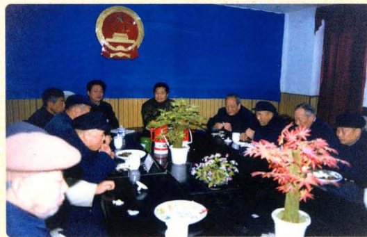
向离退休干部通报法院工作情况、征求意见。