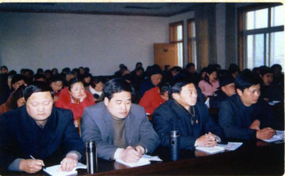
院机关干警周五学习日集中学习