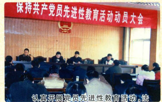
认真开展党员先进性教育活动，法 院被评为全县先进单位。