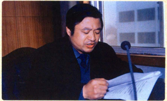
在全院工作经验交流会上发言