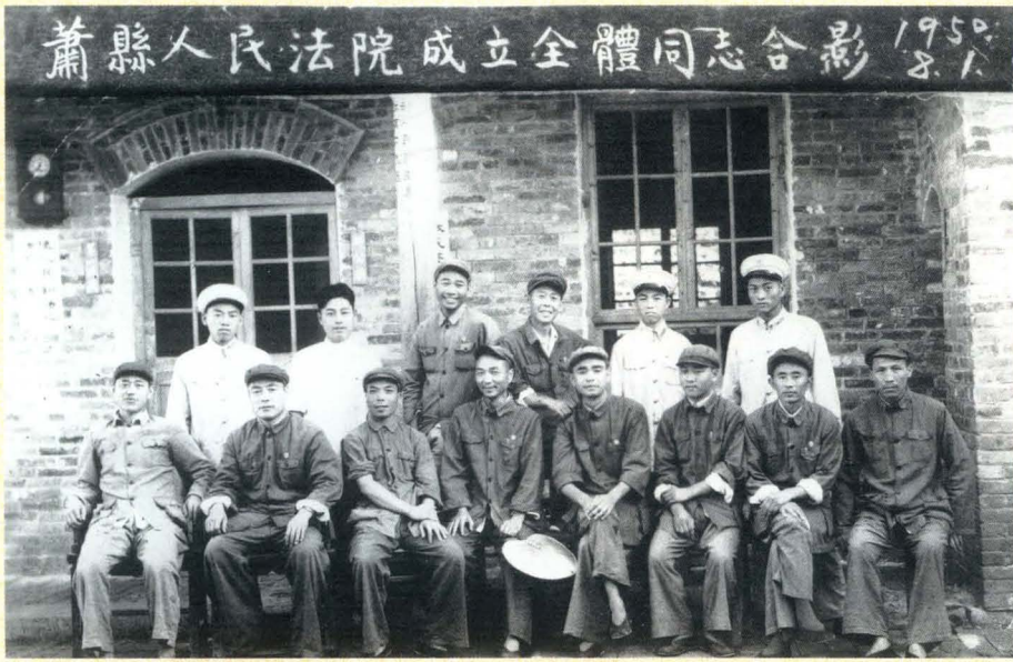
1950年县法院成立时 全体同志合影