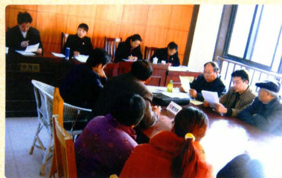
人民陪审员参与审理案件