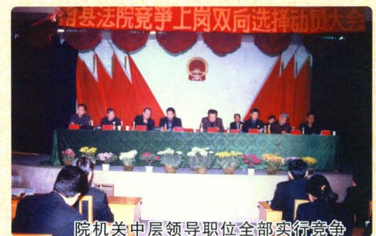
院机关中层领导职位全部实行竞争 上岗机关干警实行双向选择。