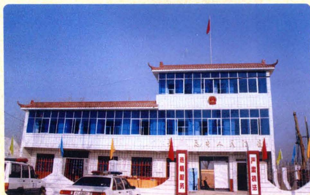
规范化建设的马井人民法庭外貌