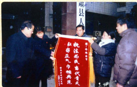
法官公正为民执法,受到当事人赞扬。