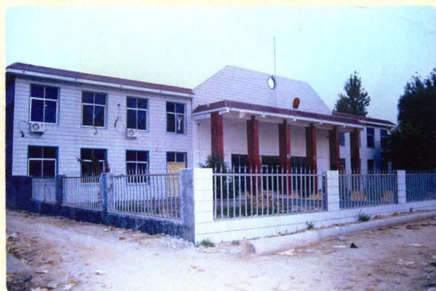
规范化建设的丁里人民法庭外貌