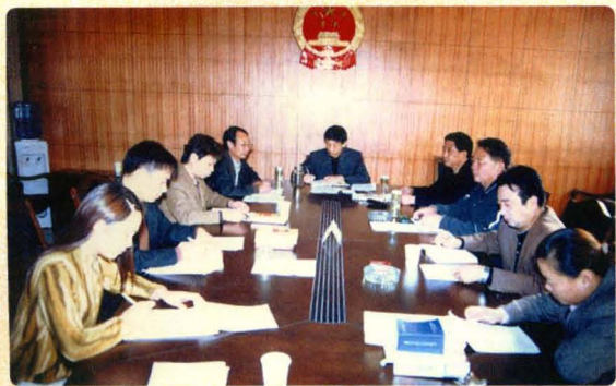
审判委员会在讨论案件