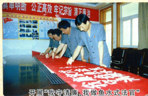
开展“我守清廉、我做鱼水式法官” 全体法官签名活动。