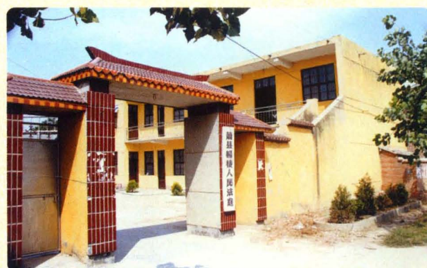
规范化建设的杨楼人民法庭外貌