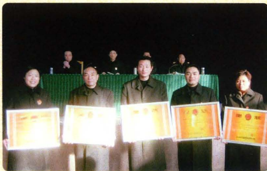
先进集体受到表彰