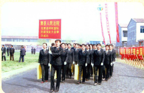
飒爽英姿的女法官