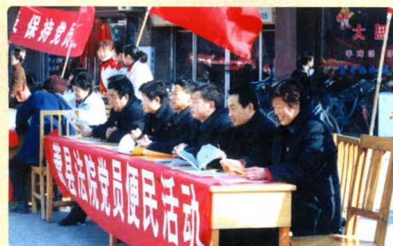
开展党员便民服务活动