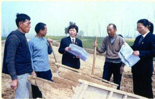
到田间地头宣传法律