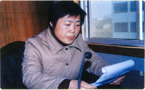
在全院工作经验交流会上发言