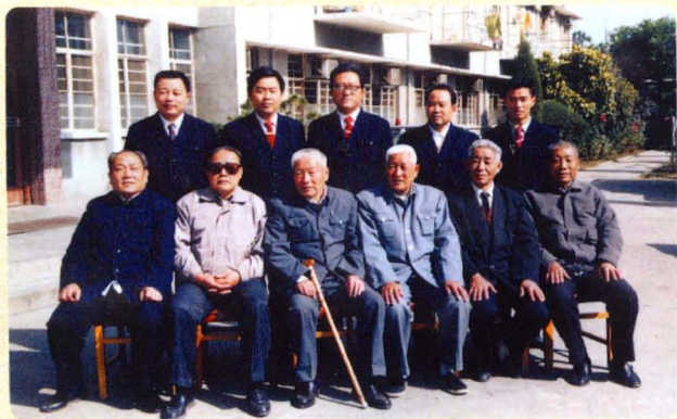
原班子成员(后排左一至左四)与部分老院长合影