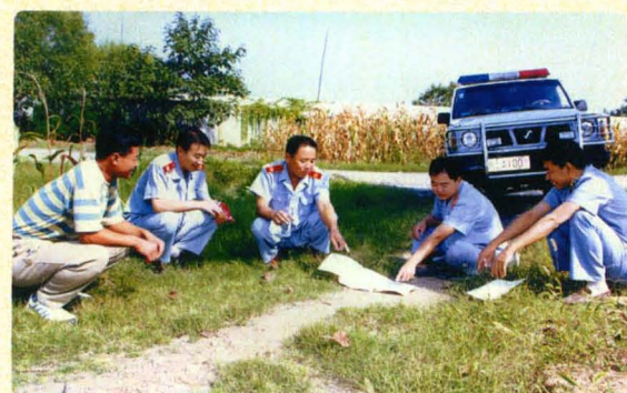
一丝不苟现场部署执行工作