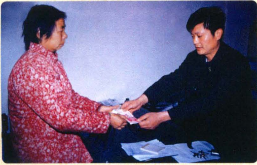
为困难当事人解燃眉之急