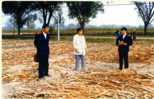
方便群众诉讼,现场做调解工作。