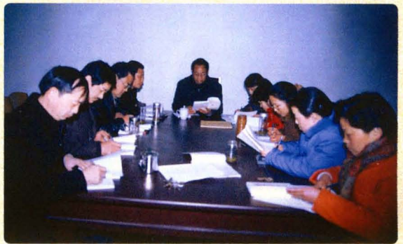
院领导参加民二庭党支部学习