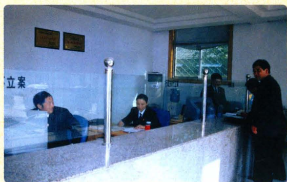
立案实行“一站式”服务方便群众诉讼