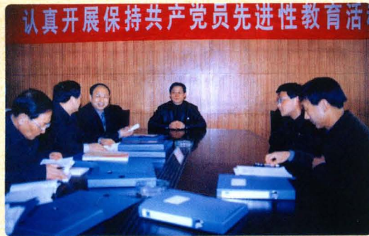
省市领导来院检查指导党员先进性教育工作