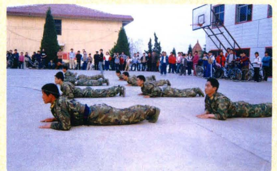
法警集训,提高战斗力。