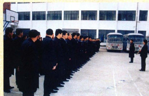
院机关长期坚持早晨上班考勤点名。