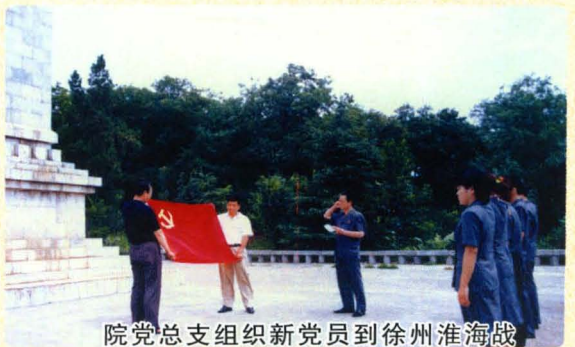
院党总支组织新党员到徐州淮海战役英雄纪念碑前进行入党宣誓。