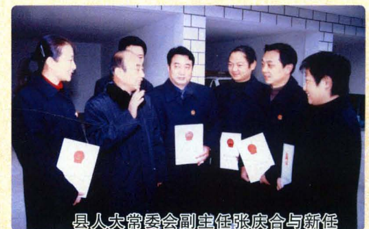
人大常委会副主任张庚合与新任 命中层干部亲切交谈。