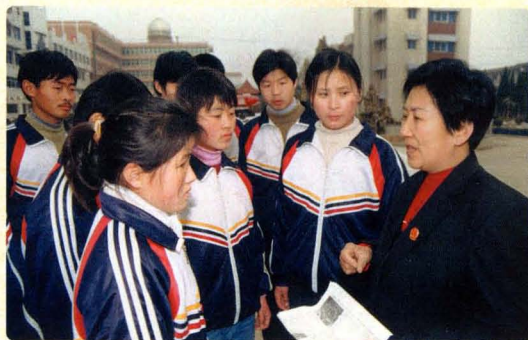
走进校园开展法律宣传教育