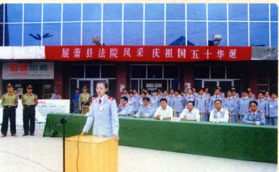
走上街头开展演讲树形象活动