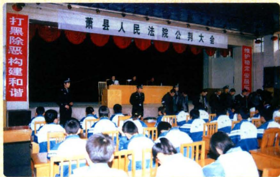
公开宣判,开展法制教育