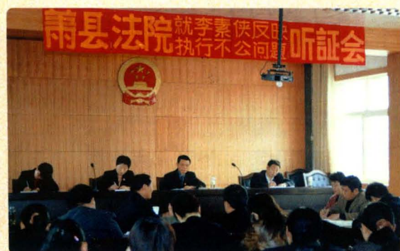
召开执行案件听证会