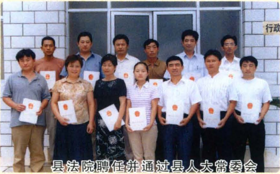
县法院聘任并通过人大常委会任命的首批人民陪审员。