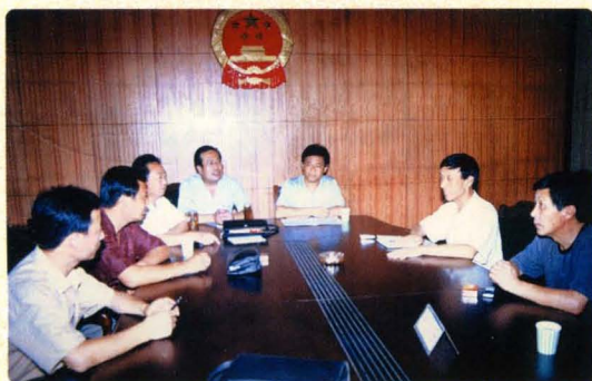
把人大代表请进来,主动接受监督。