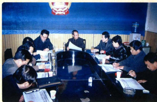
合议庭汇报和集体讨论案件