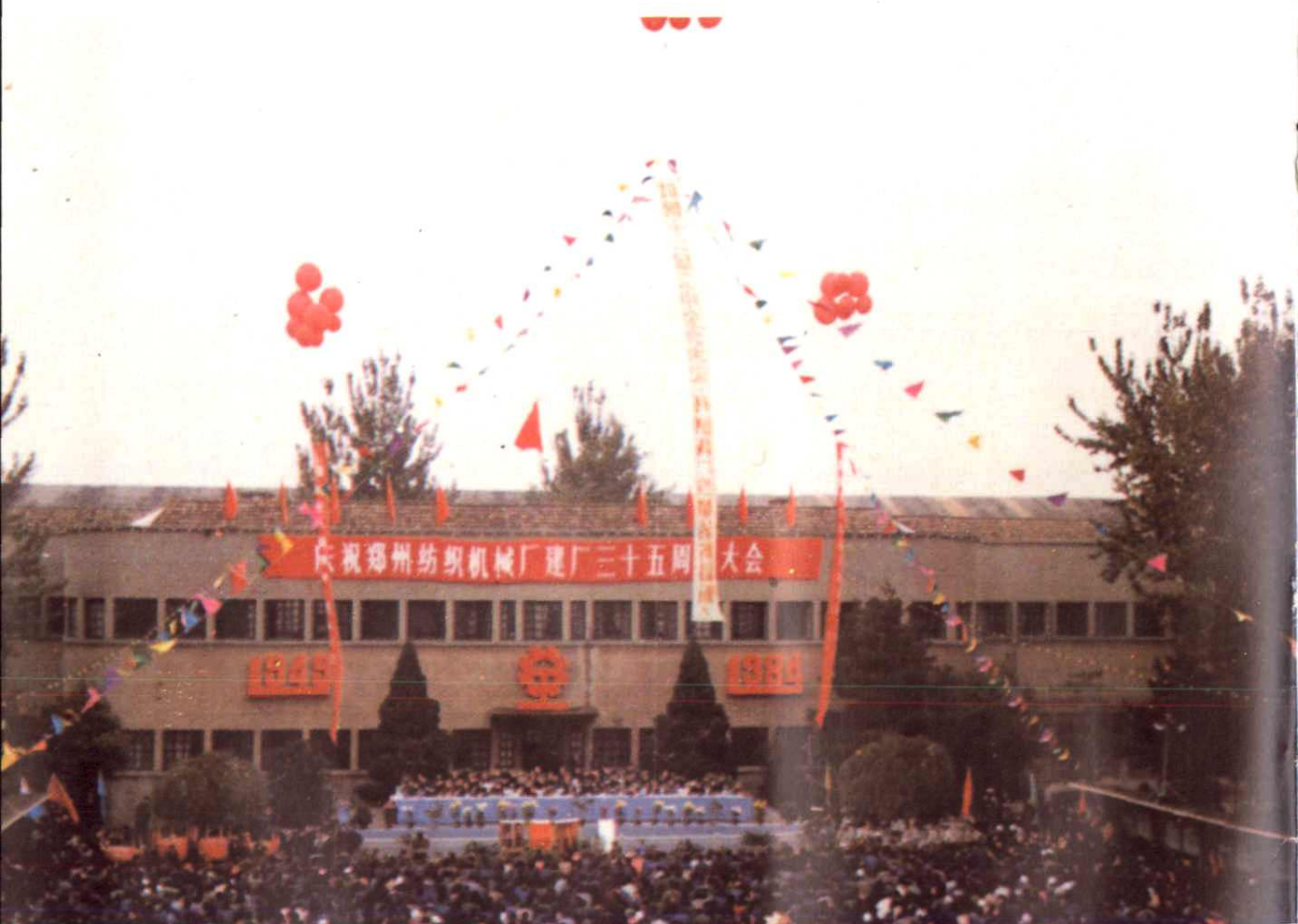
三十五周年厂庆大会会场