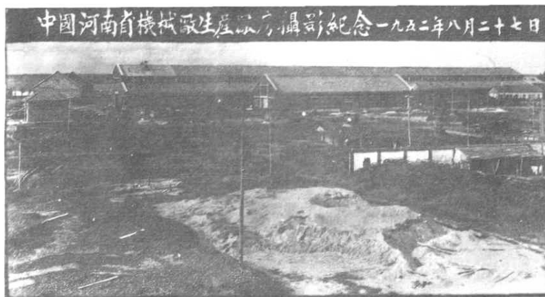
荒野崛起——主厂房工地