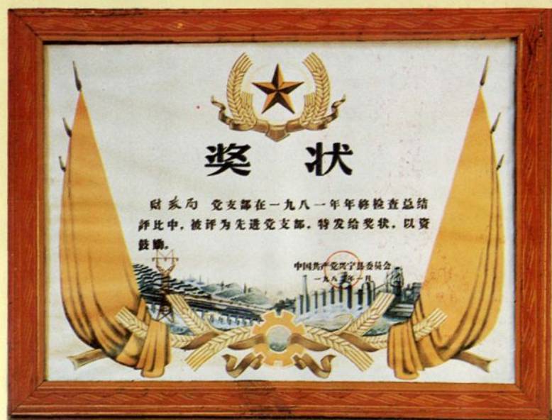
中共兴宁县委颁发的奖状