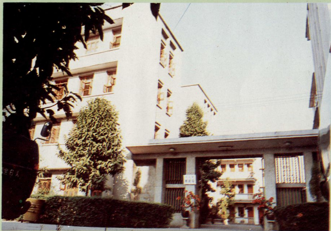
兴宁县财政局办公大楼