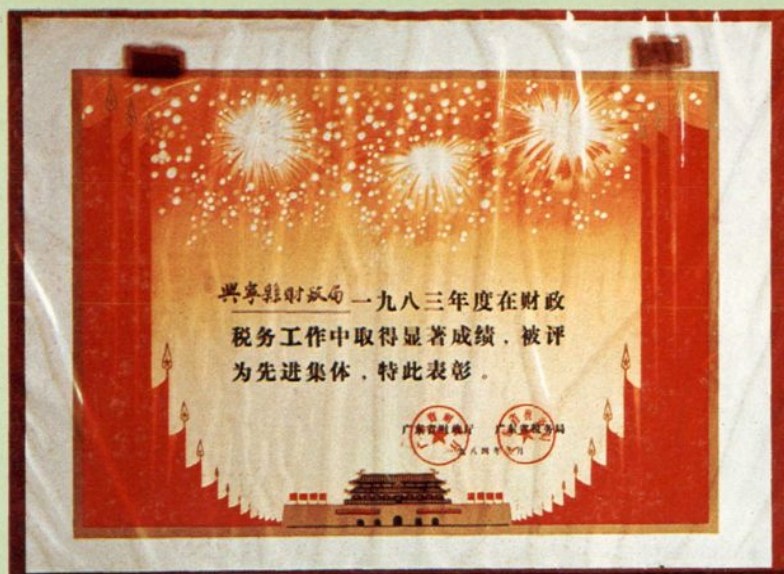
省财政厅、省税务局颁发的奖状