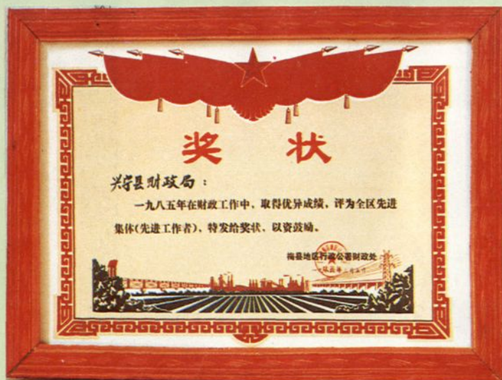
梅县地区行署财政处颁发的奖状