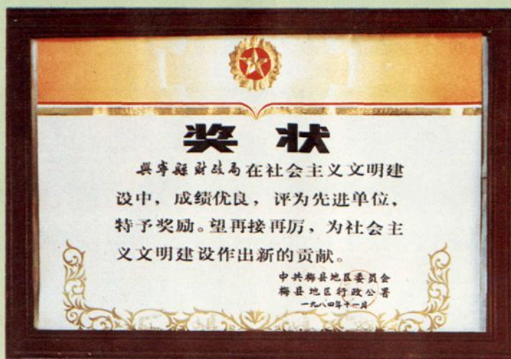
中共梅县地委、梅县地区行署颁发的奖状