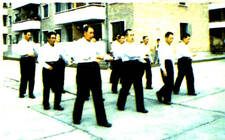
▲ 长治市军队离退休干部在参加体育运动会。