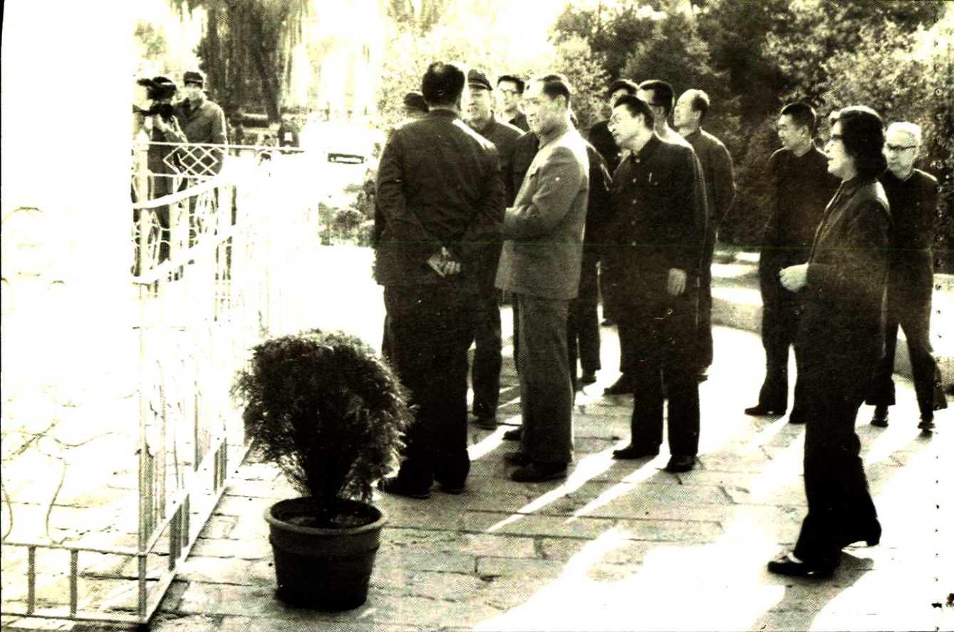
一九九四年，中华人民共和国民政部部长崔乃夫(左一)在太行太岳烈士陵园。