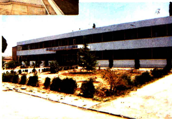
▲ 一九九四年,用有奖募捐筹集的福利资金,兴建的 3500 平方米的长治市社区服务大厦。