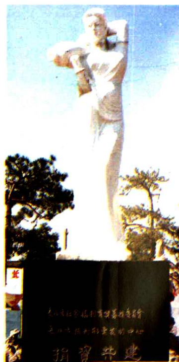
▶ 长治市募委会、长治市福利彩票发行中心,在长治市东街街心公园捐资共建的城雕。