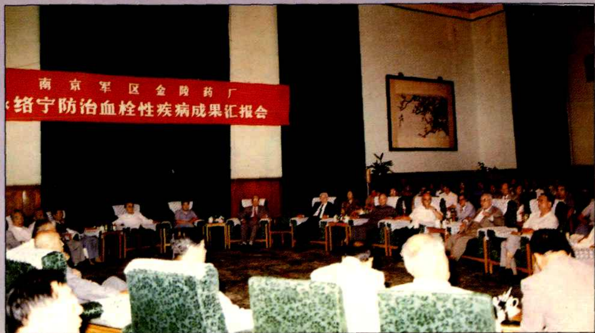
▲1991年6月20日在北京人民大会堂举办“络宁防治血栓性疾病成果汇报会”会场