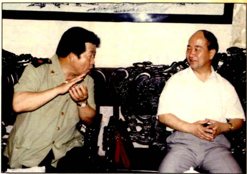
▶江苏省政协副主席胡序建视察企业