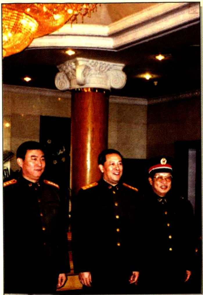
◀南京军区司令员陈炳德中将(中)和军区后勤生产管理部胡树杰部长(左)、集团董事长江中银(右)在一起