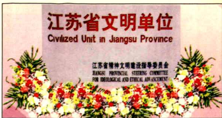
▲1997年江苏省精神文明建设指导委员会授予的“江苏省文明单位”匾牌