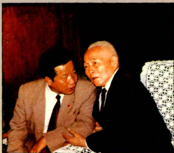
▲中顾委委员，原国家卫生部部长钱信忠在听取江中银厂长汇报