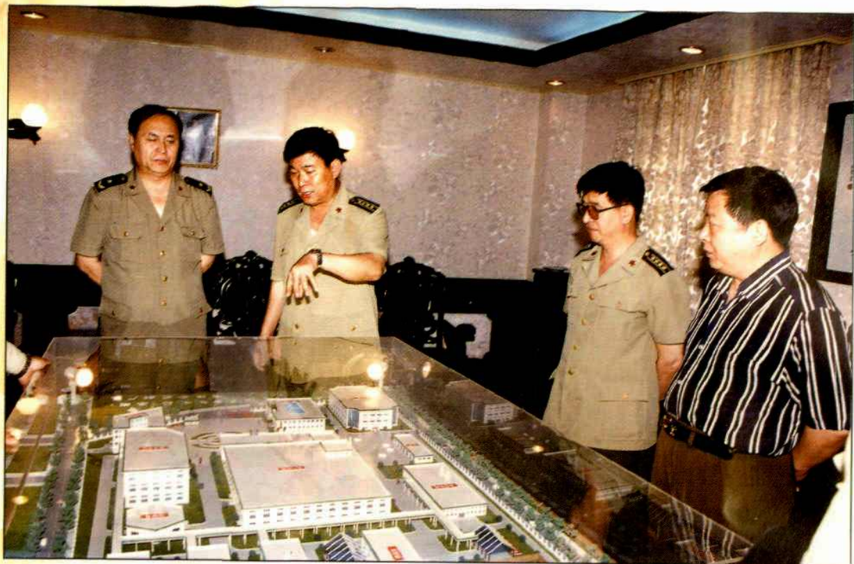
▲总后勤部生产管理部部长孙承军少将视察企业(左)听取南京军区后勤部生产管理部胡树杰部长(左二)关于金陵制药集团在新生圩高新技术开发区进行三期技改情况的汇报