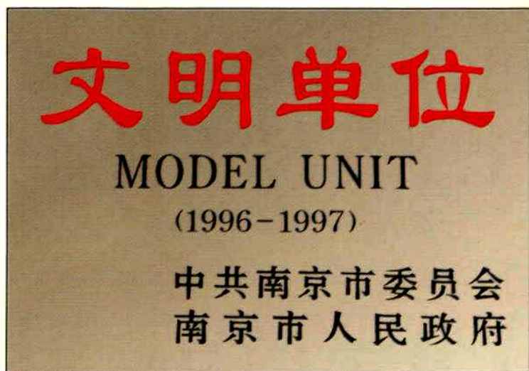
▲中共南京市委、南京市人民政府授予的1996~1997年度“文明单位”匾牌