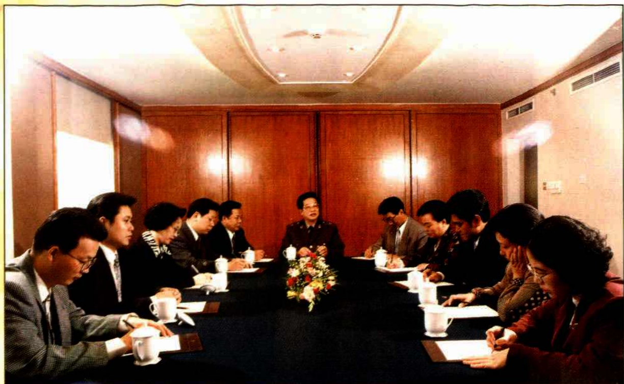
▲集团公司召开子公司负责人行政会议部署工作