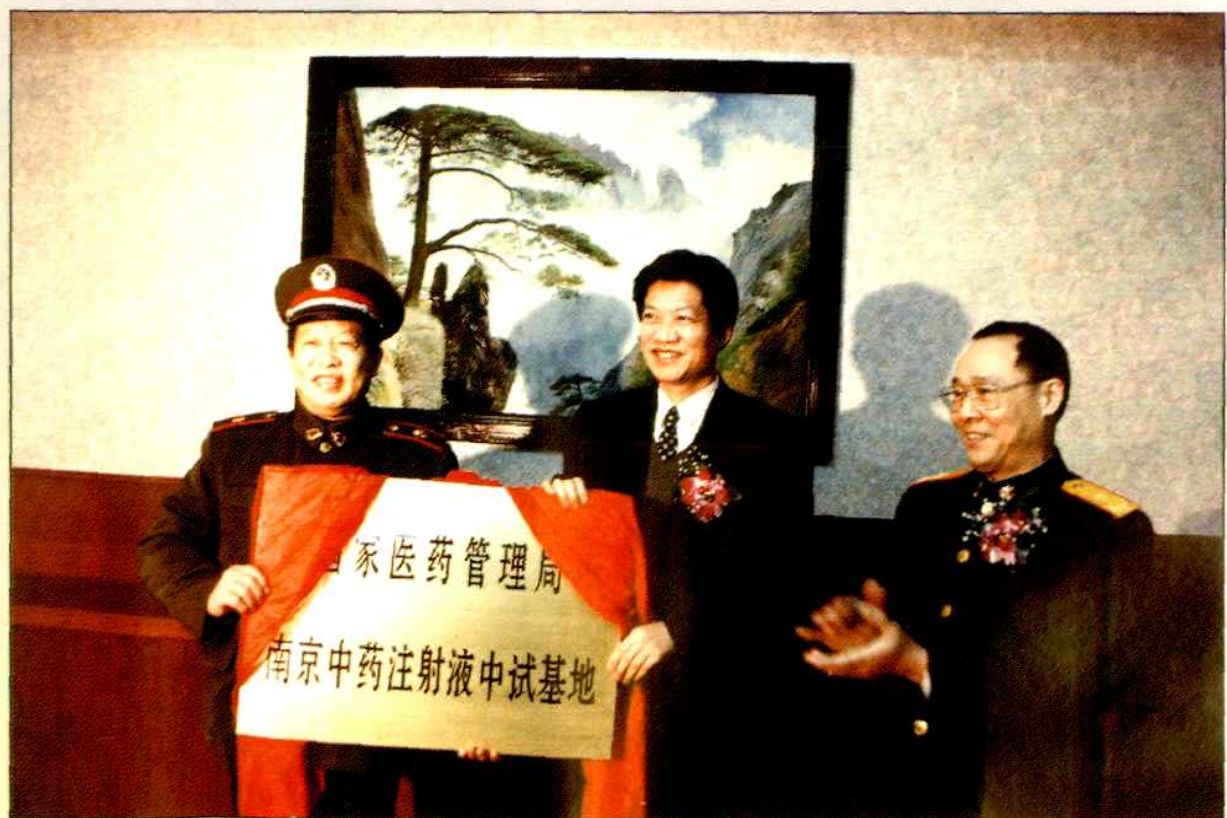
▲国家药品监督管理局郑筱萸局长(中)专程来集团授全国中药注射剂试验基地铜牌。右为总后生产管理部副部长林炳湘少将