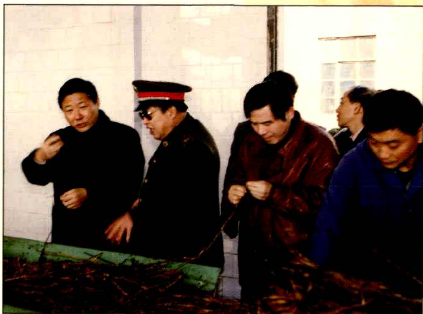
▶南京市副市长奚永明(左1)在金陵制药集团南山分厂视察