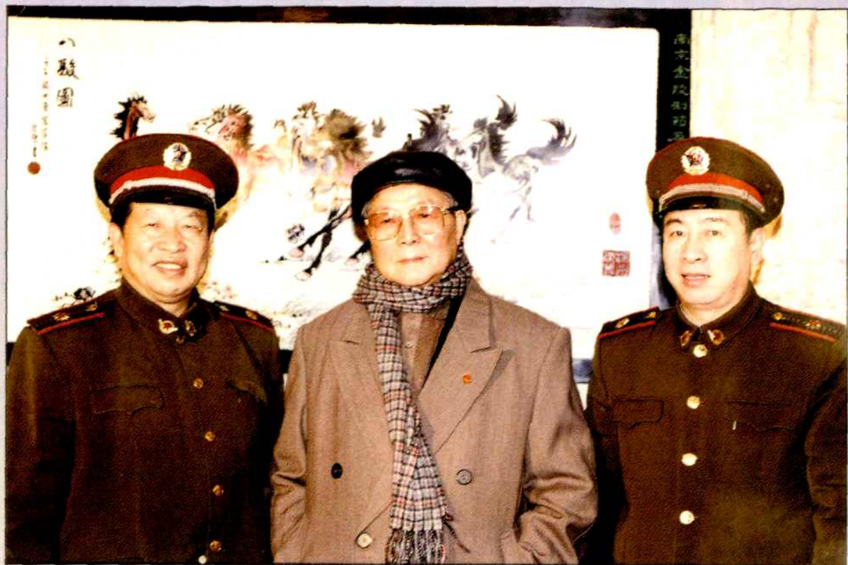
▲原南京军区司令员向守志(中)来集团视察,南京企业局郭佃生局长(右)陪同