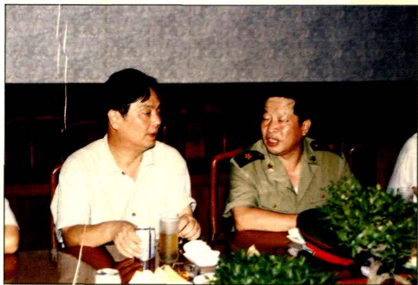
◀南京市市长王宏民视察企业