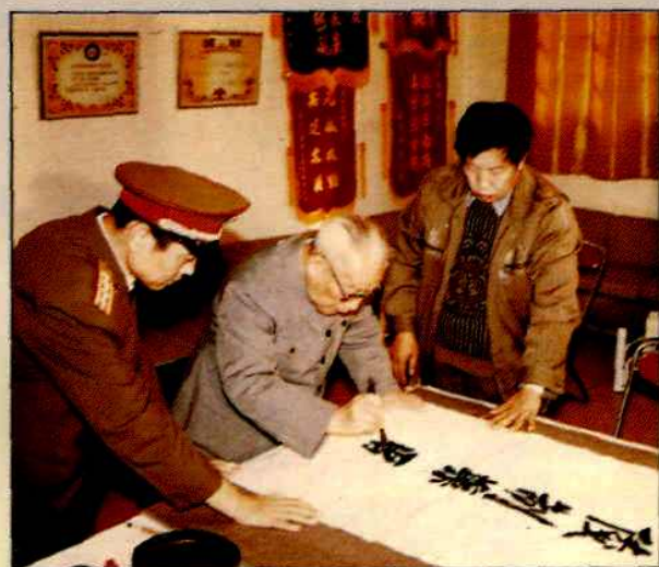
▲原南京军区政治委员杜平为金陵制药厂题写厂名