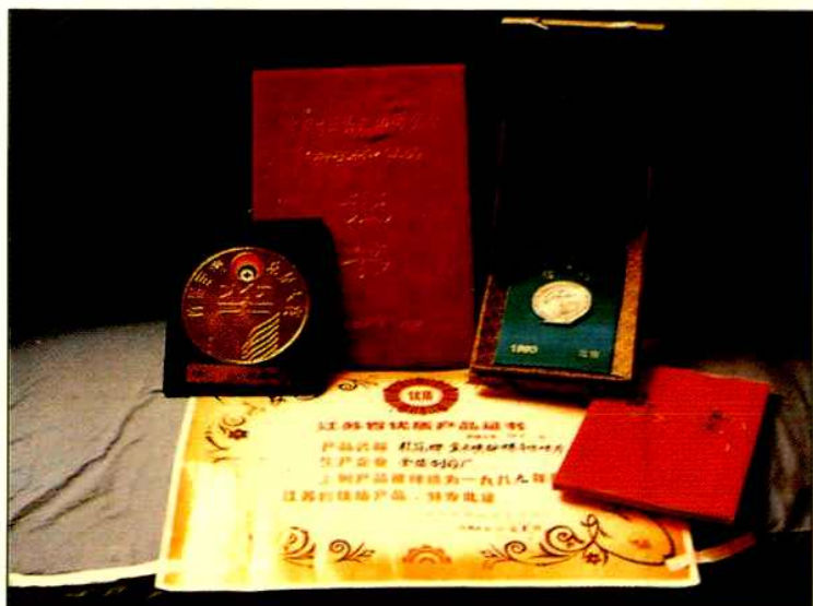
▲复方磺胺甲噁唑片获江苏省优质产品证书