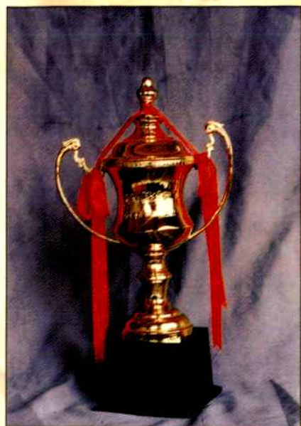
▲1991年获南京市效益杯奖