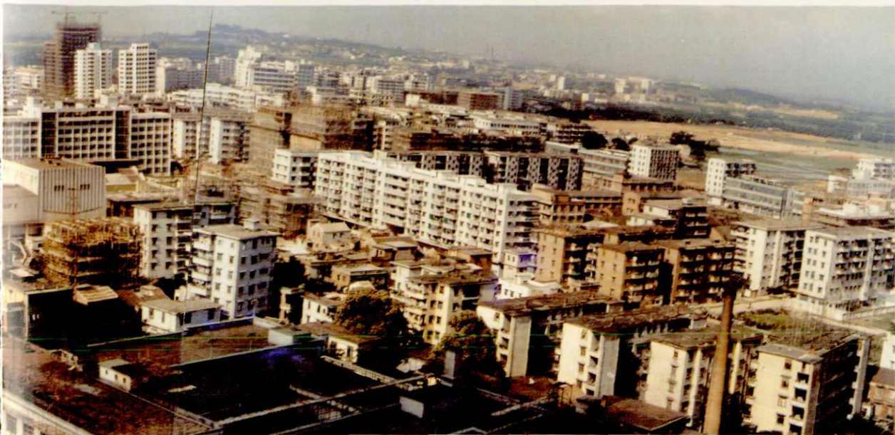
禅城新姿 (1979年以来, 10年间市区面积由 9.3平方公里扩展为19平方公里)