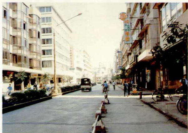
三水县城 西南镇文锋路