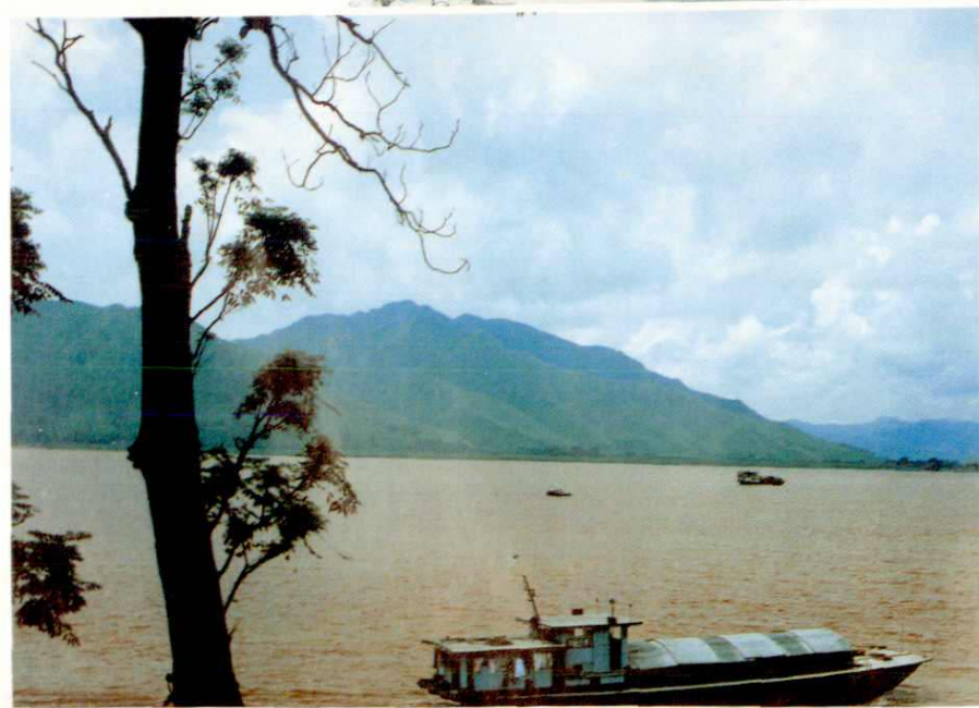
西江流经青岐镇段