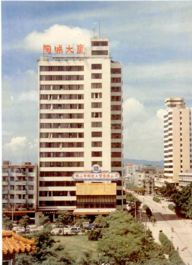
陶城大厦——市陶瓷工贸集团公司驻地