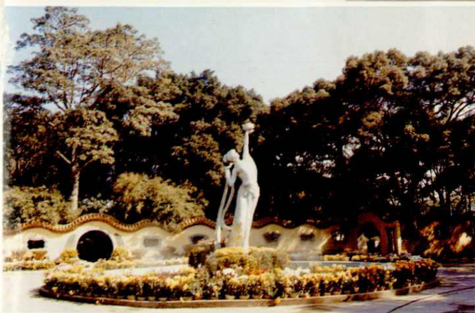
园林雕塑“冲天莲”（城区中山公园）