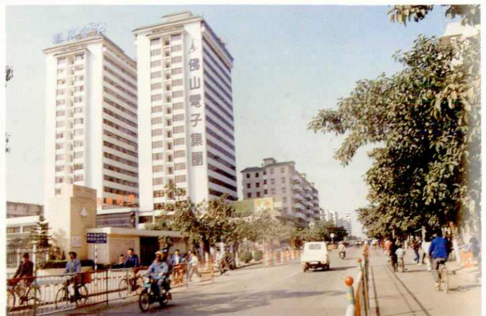
佛山电子大厦——市电子工贸集团公司驻地