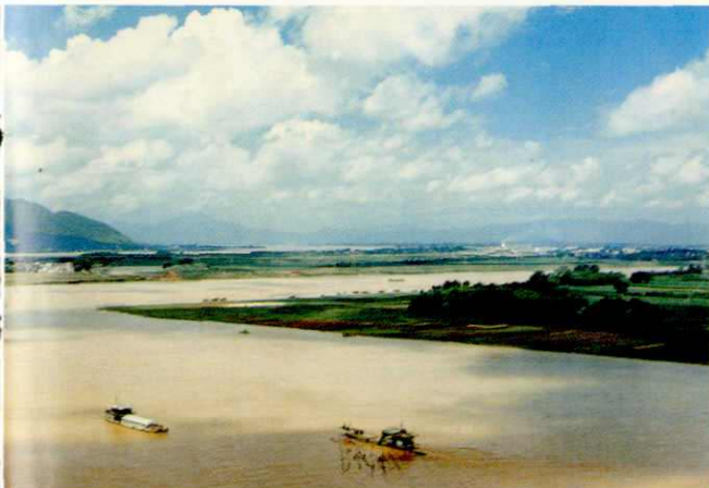
西江、北江汇流的思贤滘