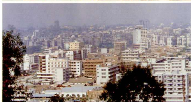
南海新县城——桂城镇