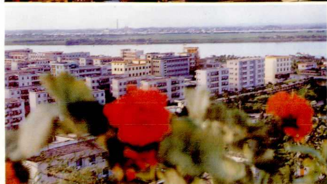
高明新县城——高明镇