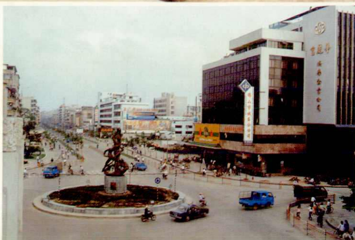
城区卫国路城雕——“搏”