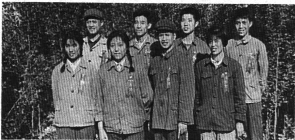
会战指挥部团委机关全体同志

‘九〇’，学技术，做贡献活动的通知”，号召每个团员、青年除圆满完成八小时工作任务外，还要发扬共产主义劳动精神，每人每天多做一小时义务工作，三个月贡献90个小时，为高速发展华北油田做贡献。