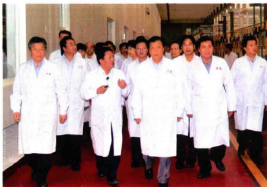
2010年9月21日下午,中共中央政治局委员、中央书记处书记、中宣部部长刘云山(前排中)在河南省委书记、省人大常委会主任卢展工(左一),南阳市委书记黄兴维(右二),市长穆为民(左二)等陪同下考察乐凯集团第二胶片厂现代化CTP生产车间。