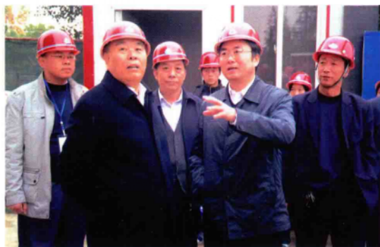
2010年11月2日,全国人大代表、省人大常委会党组书记、副主任李柏拴(左二)带领省人大常委会视察组,在市长穆为民(前右二)等陪同下视察农运会筹备工作。