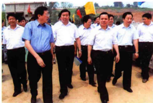
2010年8月19日，省委常委、常务副省长李克（右四）在浙川县委书记袁耀生（左三）、县长马良泉（右三）陪同下，到浙川县渠首陶岔视察南水北调中线工程建设进度。