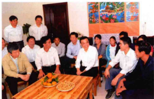
2010年10月8日,中共中央政治局常委、国务院副总理李克强(前排右三)在浙川县厚坡镇陈庄移民新村看望群众。