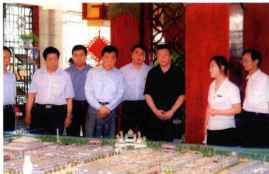
2010年9月21日,中共中央政治局委员、中央书记处书记、中宣部部长刘云山(左三)在省委书记卢展工(右三)、市委书记黄兴维(左二)、市长穆为民(右四)、镇平县委书记史焕立(右一)陪同下,深入镇平国际玉城,考察镇平玉文化产业发展和建设情况。