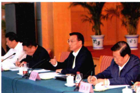
2010年10月9日,中共中央政治局常委、国务院副总理、国务院南水北调工程建设委员会主任李克强(右二)在南阳主持召开南水北调工程建设工作座谈会并讲话。