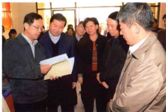
2010年11月30日，省委副书记、省委组织部部长、省委创先争优活动领导小组组长叶冬松（前排左一）在市领导黄兴维、贾崇兰、杨其昌等陪同下，深入宛城区白河街道办事处调研指导创先争优活动。