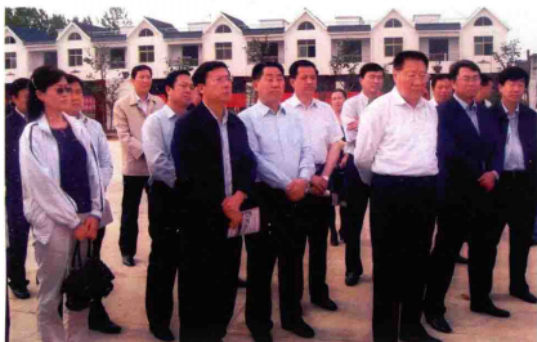
2010年5月7日,国务院南水北调办公室主任张基尧(右三)、副主任张野(左三)在副省长刘满仓(左四)、省移民办公室主任王树山(左五)、市长穆为民(右二)、副市长崔军(右一)陪同下,视察唐河县毕店镇凌岗新村。