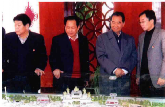
2010年10月29日,原中共中央政治局常委、中央纪律检查委员会书记吴官正(右二)到镇平县视察工作。