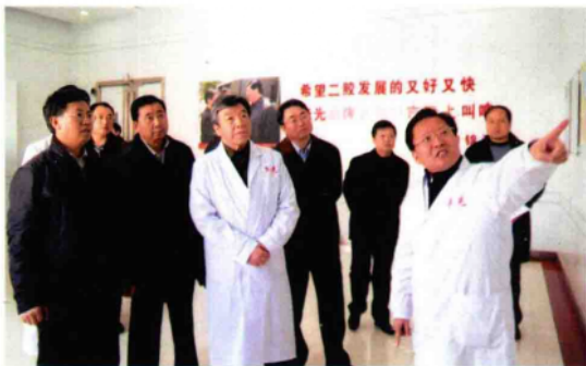
2010年1月12日，省委书记卢展工（左四）在南阳市委书记黄兴维（左三）、市长穆为民（左五）等陪同下，到乐凯集团第二胶片厂调研工作。