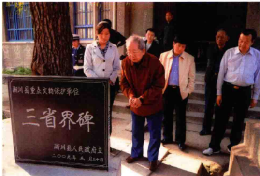
2010年10月15日,原商业部部长胡平(右四)在浙川县荆关镇一脚踏三省景区参观。