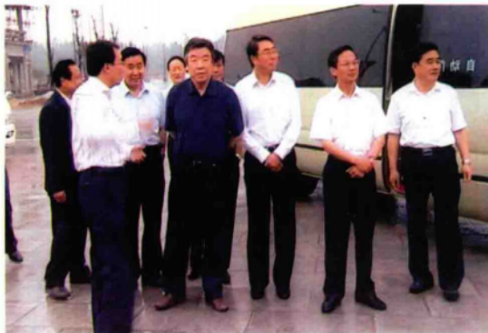
2010年6月7日至8日，省委书记卢展工（右四）在市委书记黄兴维（左三）、市长穆为民（右三），镇平县委书记史焕立（右二）、县长王书祥（右一）陪同下，视察镇平县工作。