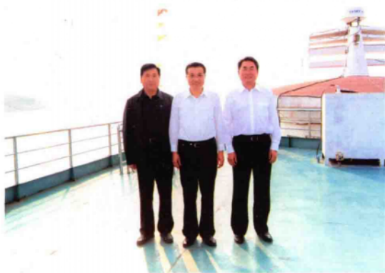
2010年10月8日,中共中央政治局常委、国务院副总理李克强(中)在丹江口水库视察时与南阳市委书记黄兴维(左)、市长穆为民(右)合影。