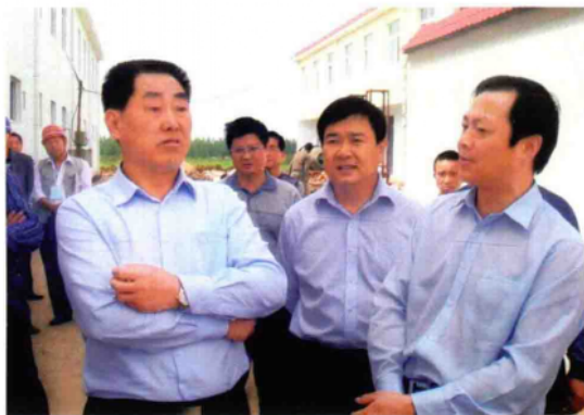
2010年5月7日,副省长刘满仓(左一)在唐河县委书记和学民(右一)、副书记秦性奇(右二)陪同下视察唐河县凌岗新村移民工作。