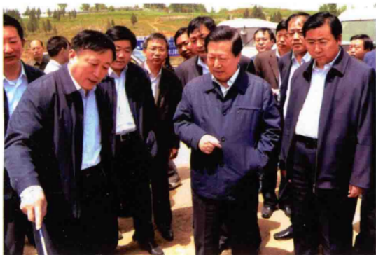
2010年4月28日,环境保护部部长周生贤(前排右二)在副省长张大卫(前排左一)、市委书记黄兴维(前排右一)等陪同下,到南水北调中线工程渠首浙川陶岔,考察环境保护和丹江口水库水质情况。