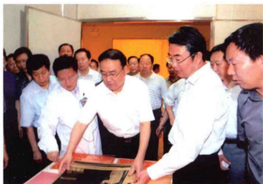
2010年6月18日，2010年全省第一次重点项目观摩点评团在副省长徐济超（中）带领下，深入二胶厂观摩柔性树脂版与PCB专用胶片项目。市长穆为民（右三）陪同。