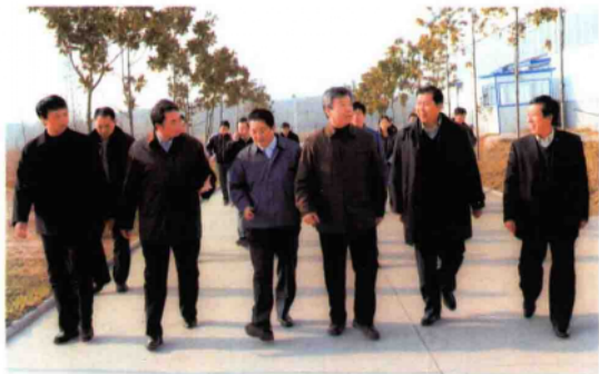
2010年1月12日，省委书记卢展工（前排右三）在市委书记黄兴维（前排右二）、市长穆为民（前排左二）、方城县委书记梁天平（前排右一）陪同下，到方城县视察工作。