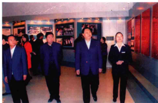
2010年11月10日,中共十六届中央委员、北京军区原政委、全国人大农工委副主任符廷贵(前排右二)在市委书记黄兴维(前排右三)、镇平县委书记史焕立(前排左一)陪同下考察镇平工作。