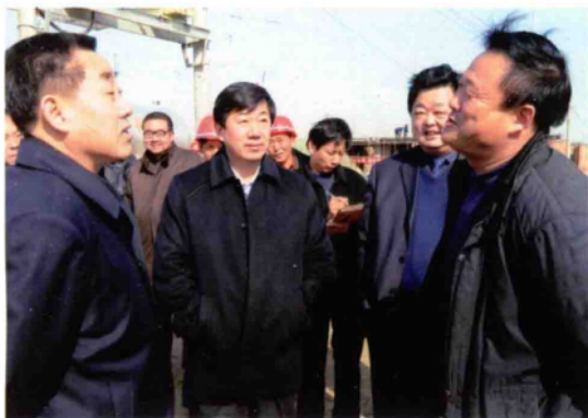
2010年3月9日,副省长刘满仓视察社旗县移民新村建设工作。