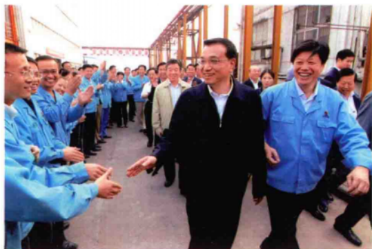
2010年10月9日,中共中央政治局常委、国务院副总理李克强(前排右二)在天冠集团考察。