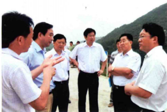
2010年7月14日,副省长刘满仓(右二)在桐柏县县长莫中厚(右一)陪同下,深入桐柏县龙潭水库检查指导防汛工作。