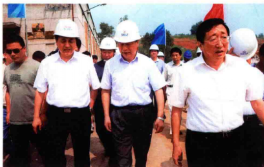
2010年8月17日,国务院南水北调办公室主任鄂竟平(前排右二)在浙川县县委书记袁耀生(前排右一)等陪同下,在浙川县渠首陶岔调研南水北调工程建设工作。