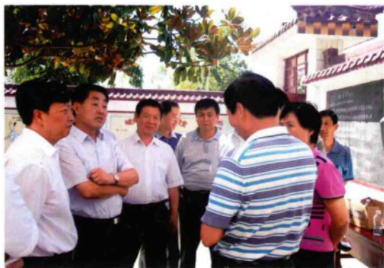
2010年8月16日,副省长刘满仓(左二)在副市长姚龙其(左一)陪同下,到南召县崔庄乡视察群众受灾情况。