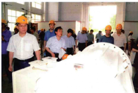
2010年6月18日，省第一次重点项目观摩点评团成员在南防集团观摩。