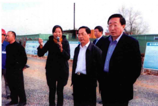
2010年10月29日,商务部副部长蒋耀平(前排右二)在浙川县县委书记袁耀生(右一)陪同下,到浙川县渠首陶岔考察工作。