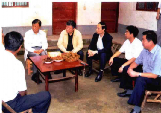
2010年9月21日上午,中共中央政治局委员、中央书记处书记、中宣部部长刘云山(左一)在河南省委书记、省人大常委会主任卢展工(左二),南阳市委书记黄兴维(右一)陪同下,到西峡县五里桥镇黄狮岗村与村民共话新农村文化事业发展。