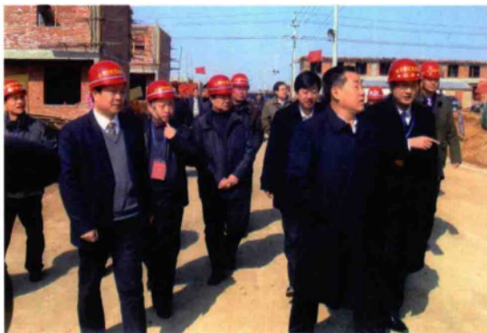
2010年3月9日,副省长刘满仓(右二)在副市长崔军(右三)、唐河县委书记和学民(左一)、副书记秦性奇(左三)陪同下视察移民新村建设。