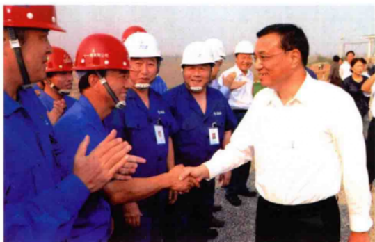
2010年10月8日,中共中央政治局常委、国务院副总理、国务院南水北调工程建设委员会主任李克强(前右一)在南阳南水北调中线工程渠首现场察看工程建设情况,看望施工建设人员。