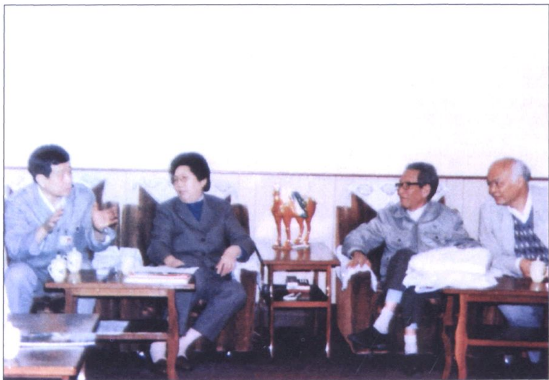
(8) 1990年,陈慕华同志(左二)在广州接见广州市人大常委会副主任纪瑞生同志(右二)、广州市副市长谢士华同志(右一)等人。