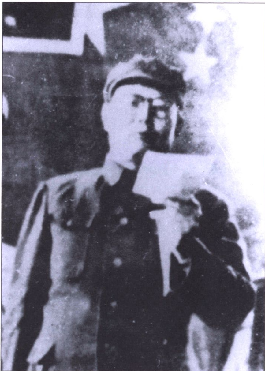
(1) 1949年11月27日，叶剑英市长在广州市第一届各界人民代表会议上作工作报告。