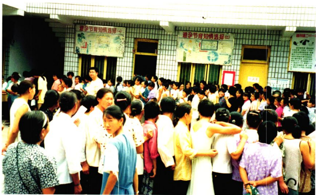
1998年,禄市计划生育“三查”(查环、查孕、查病)现场