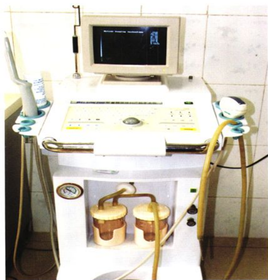
市计生指导站的可视人流机