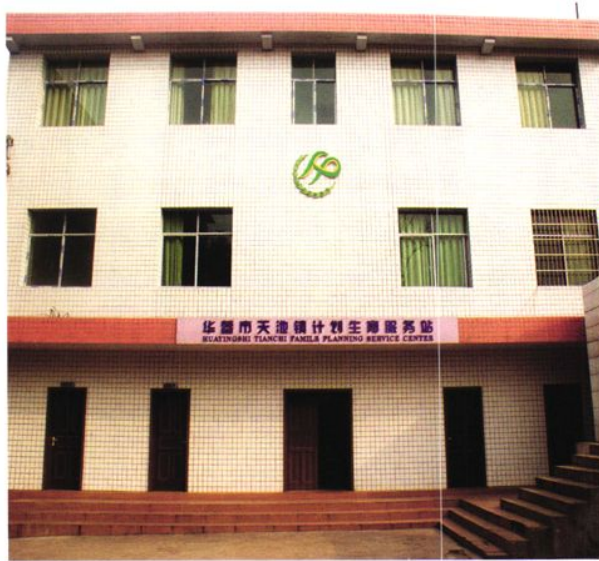
天池镇计生服务站