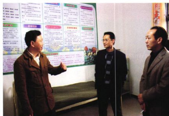
华蓥市计划生育领导陪同广安市人口和计划生育委员会领导调研工作