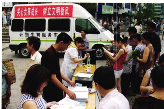
2005年7月3日, 在溪口镇设点宣传计划生育法律法规和开展计划生育优质服务