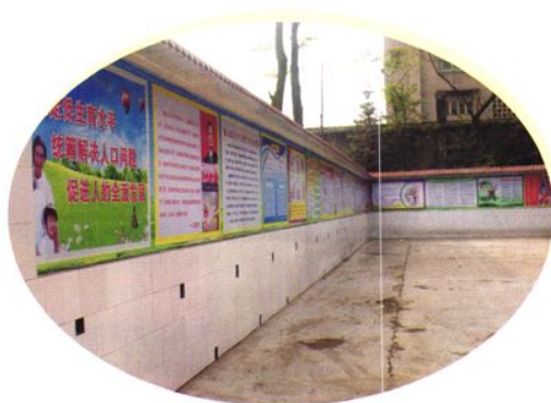
天池镇生育文化宣传墙