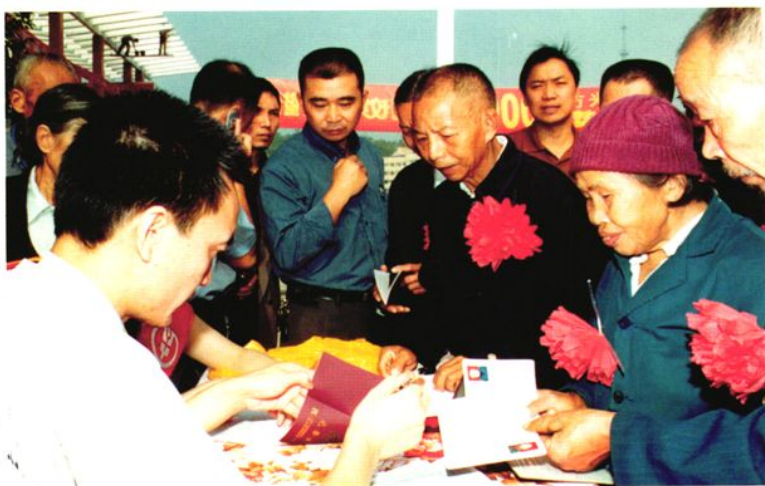
2004年9月3日，双河镇的农村部分计划生育奖励扶助对象领取扶助金的现场