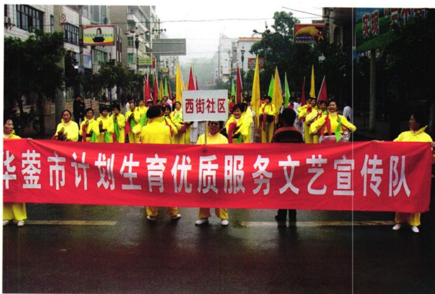
2004年11月8日,华蓥市举行计划生育优质服务大型排街宣传活动