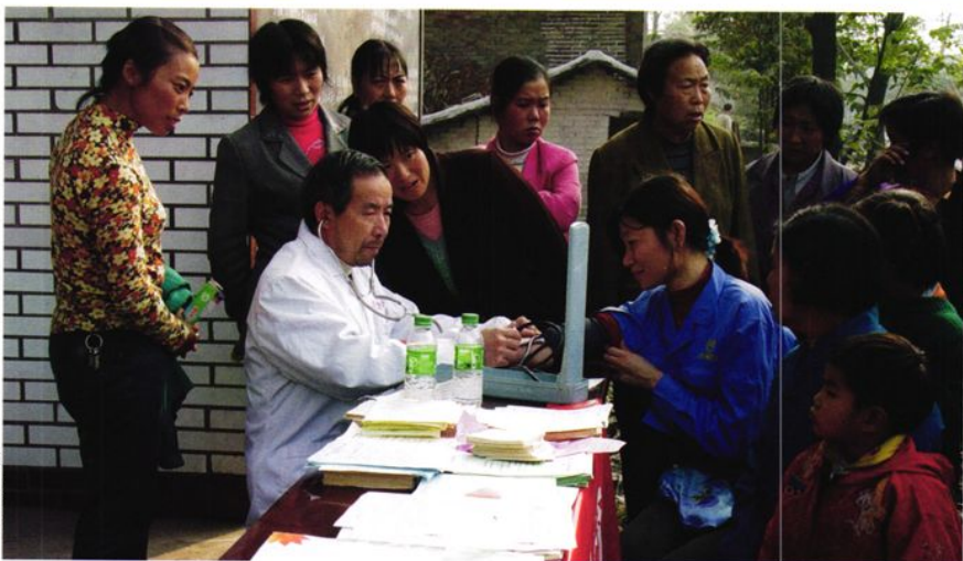
2004年11月4日,华蓥市计划生育指导站医生深入农村为育龄群众开展查环、查孕、查病服务