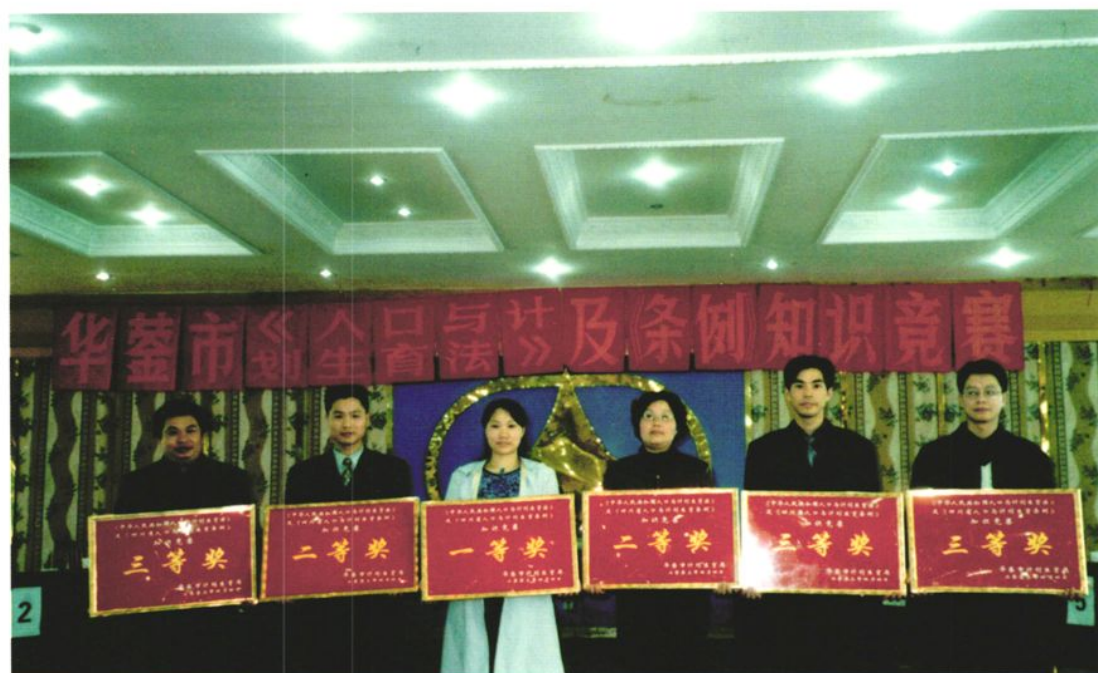
2002年,举办《人口与计划生育法》知识竞赛