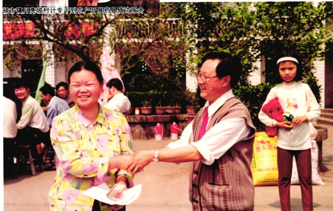
华蓥市农行工作人员为计生三结合结对户送帮扶资金