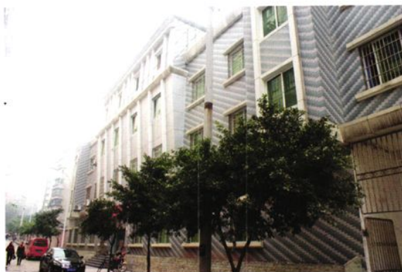
华蓥市人口和计划生育局办公楼