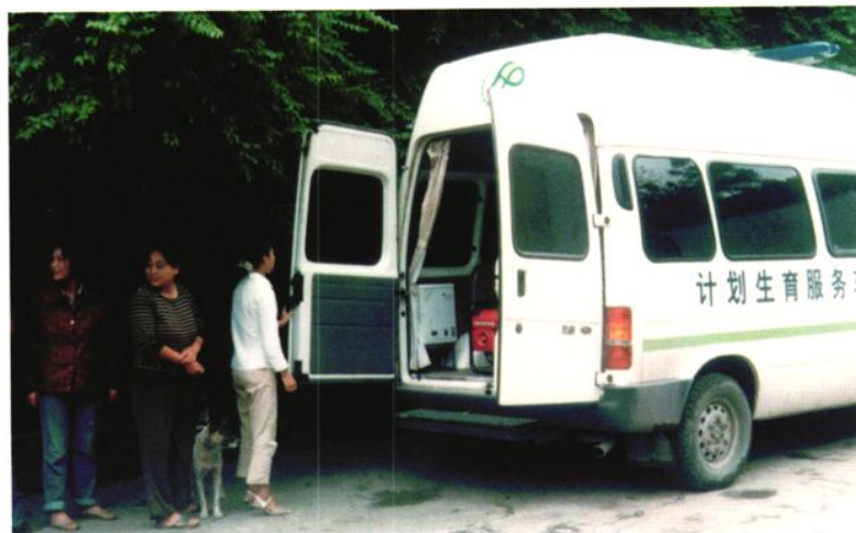
2003年，华莹市计划生育局组织医生到农村开展优质服务。图为育龄群众排队等候到计划生育服务车上进行检查