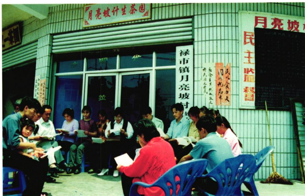
1998年，禄市镇镇干部在月亮坡村计生茶园组织群众学习计生法规和政策