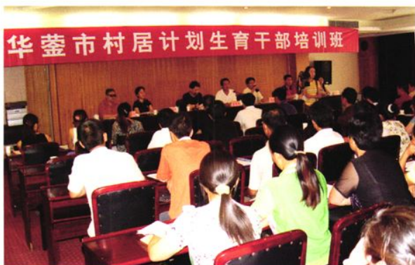
培训村居计生干部