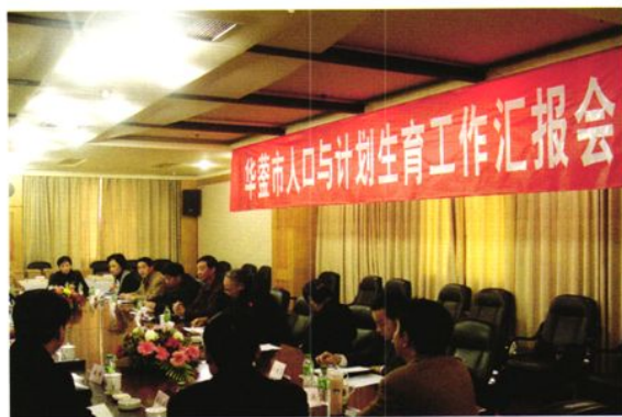
2004年11月20日，国家人口和计划生育委员会评估验收华莹市创建国家计划生育优质服务先进市工作