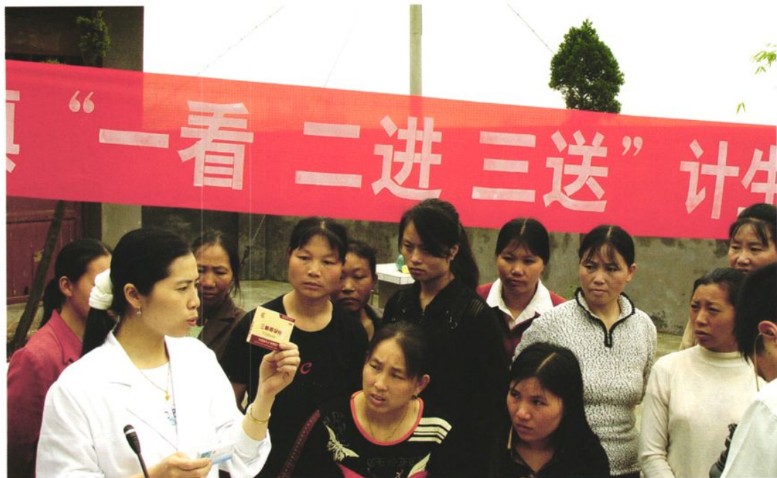
一看二进三送宣传