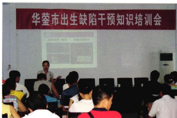
2005年7月1日举办出生缺陷干预培训, 请来专家讲课