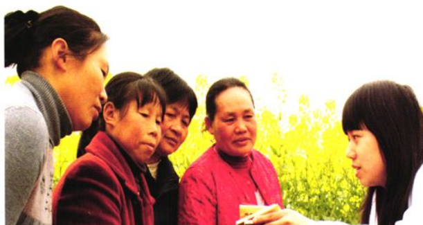
为在田间劳动的妇女讲授避孕药具及生殖健康知识