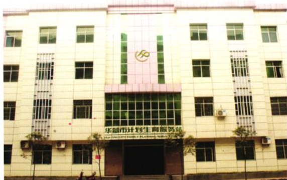
华蓥市计划生育服务大楼