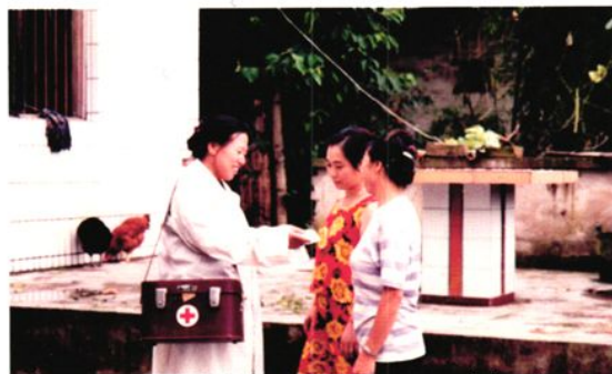
禄命镇月亮坡村计生专干到农户开展药具随访服务