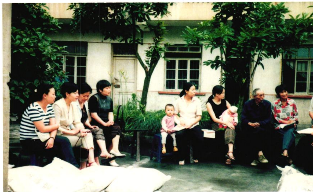
1999年，华蓥市计生委的干部为计生“三结合户”赠送物资