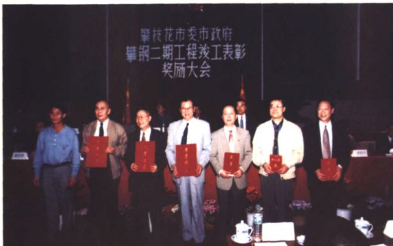
◀1997年4月2日，攀枝花市委、市政府召开攀钢二期工程竣工表彰奖励大会。