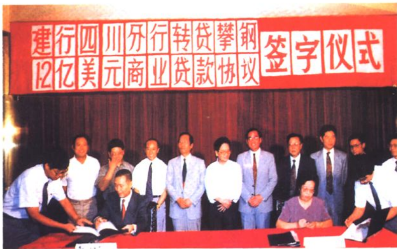
◀1993年8月24日，中国建设银行四川省分行为攀钢二期工程转贷1.2亿美元商业贷款。