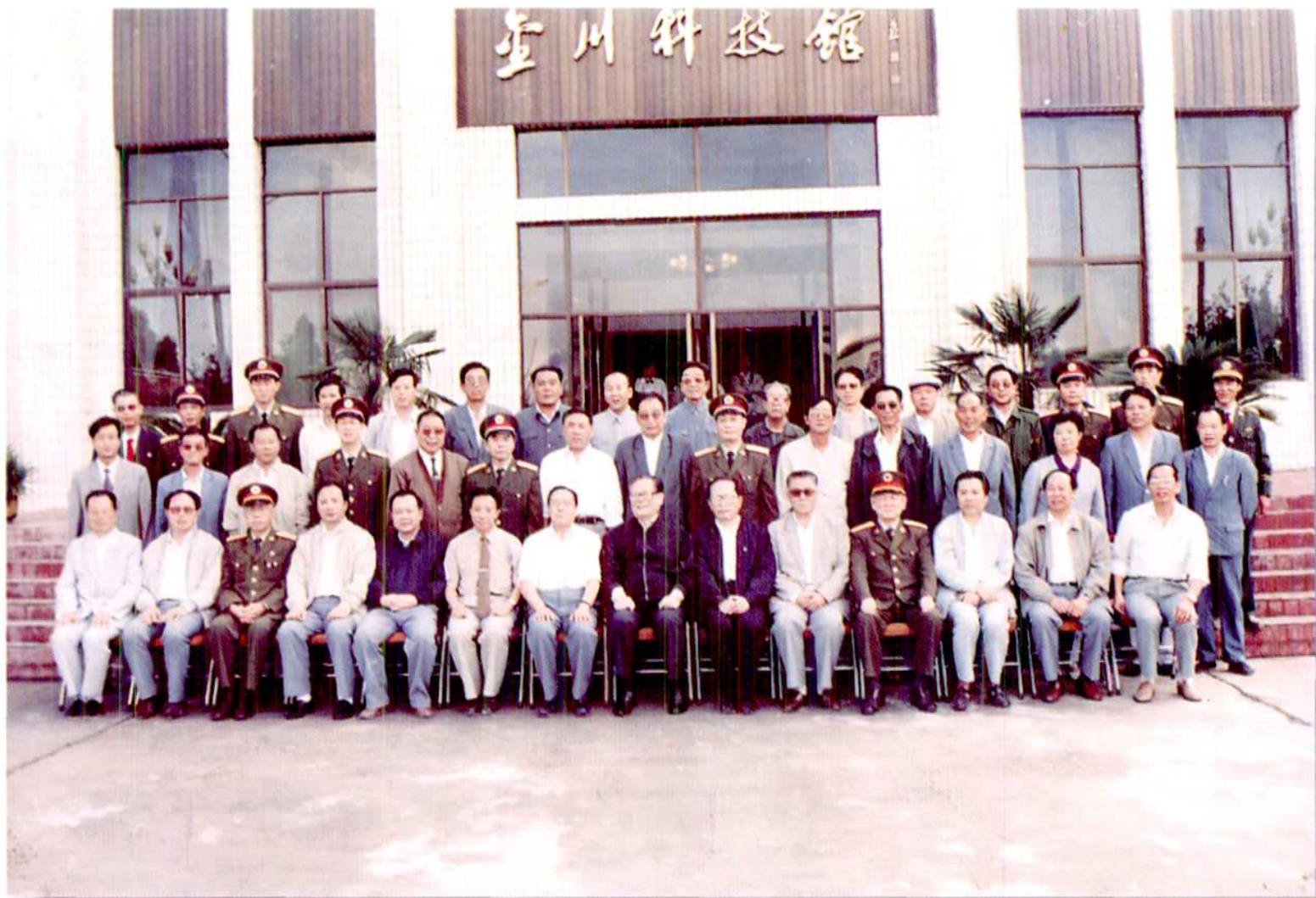
江泽民视察金昌时与市上党政军领导合影