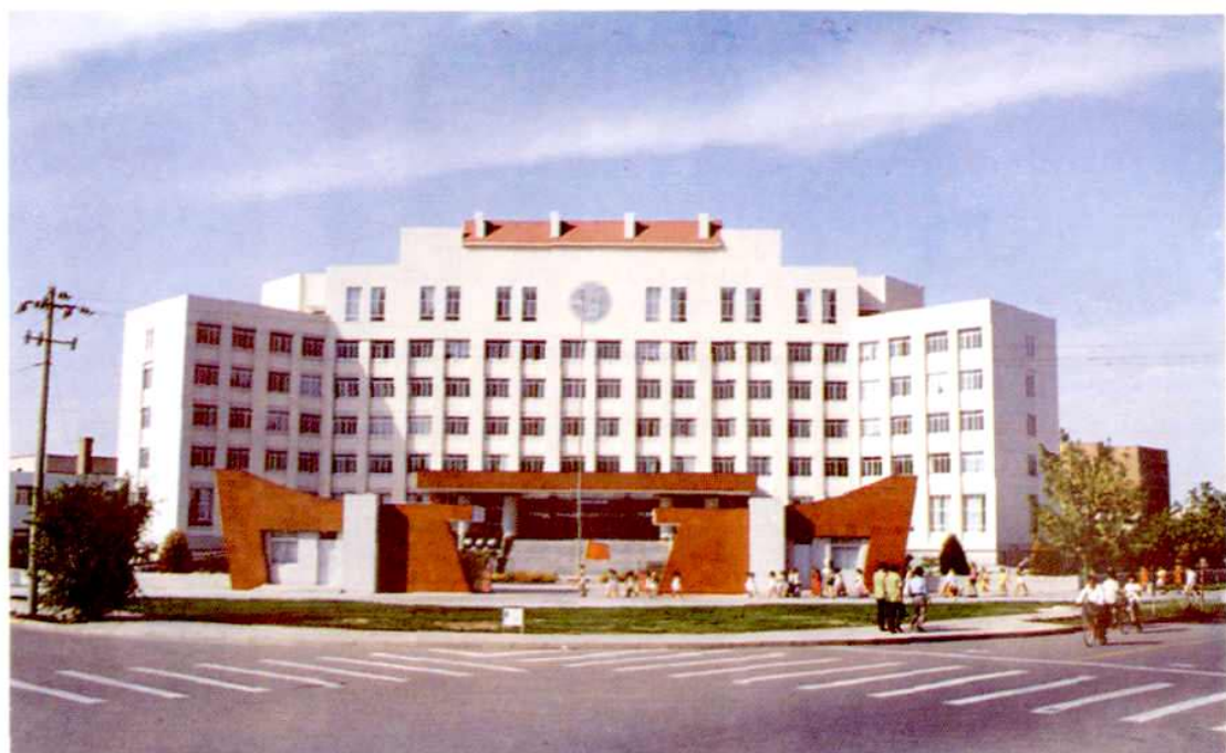
中共金昌市委办公大楼