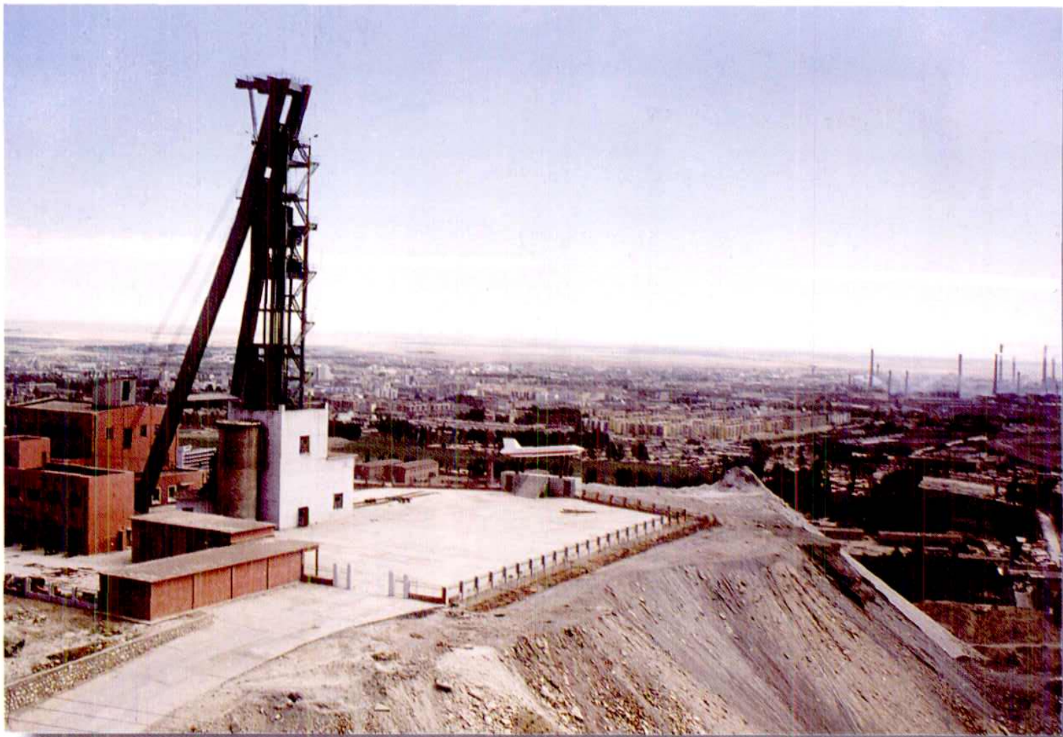
金川公司二矿区西主井