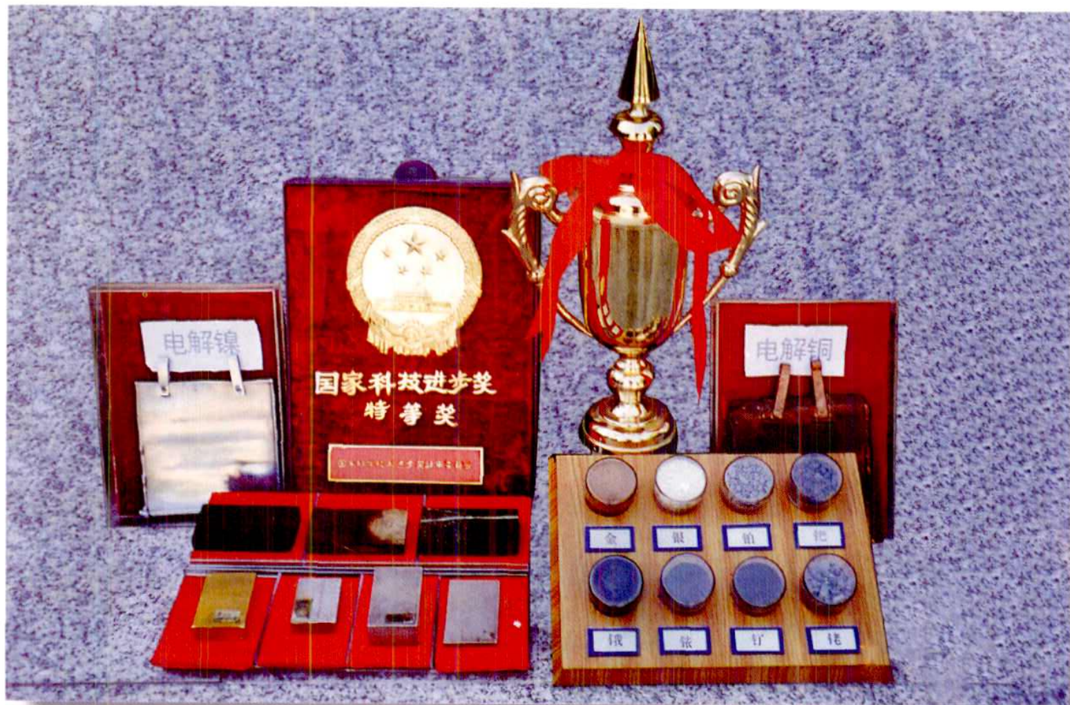
金川公司的主要产品:电解镍、电解铜、电解钴、金、银、铂、钯、钨、铀、钼、铯