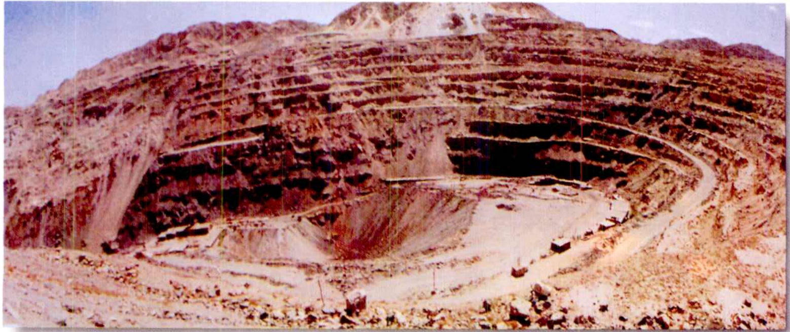
金川公司露天矿采矿场闭坑遗址