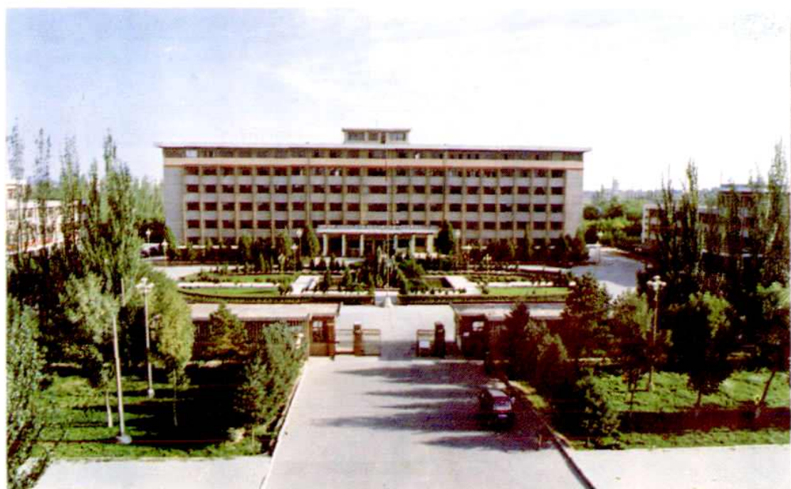
金昌市人民政府办公大楼