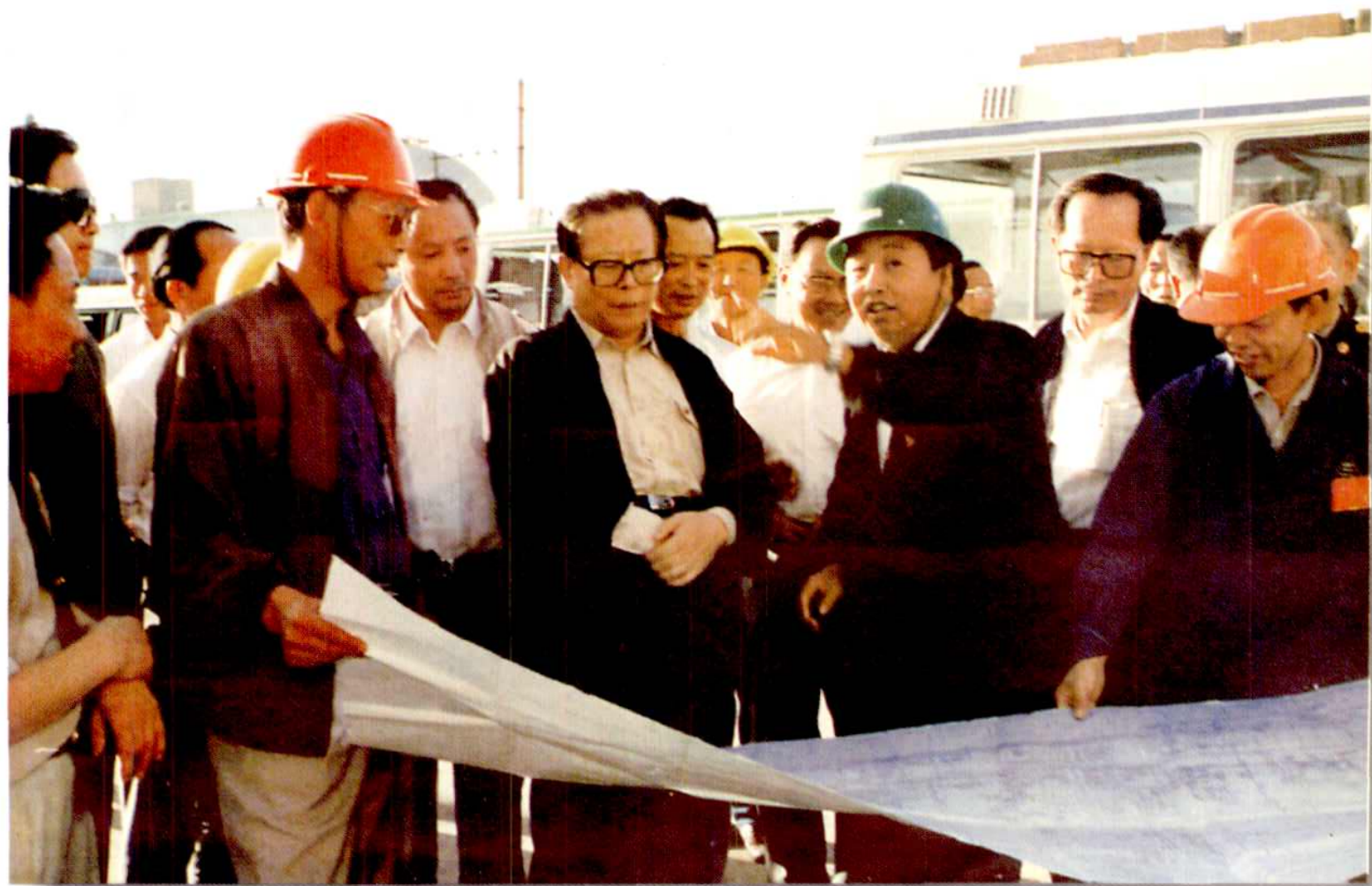
1992年8月12日,中共中央总书记江泽民视察金川公司