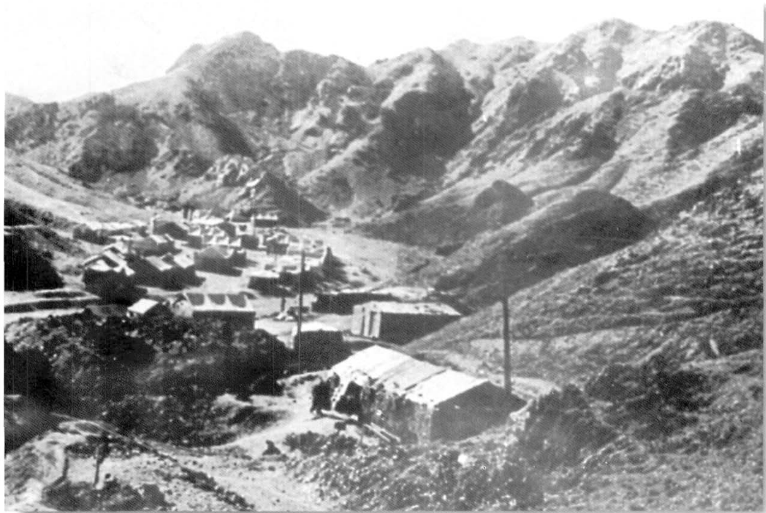
1959年的金川I矿区工区全景