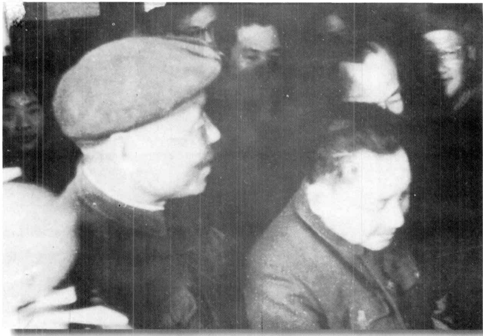
1966年3月27日,邓小平、李富春、薄一波等党和国家领导人视察金川公司(左一为时任金川总党委书记田汝孚)