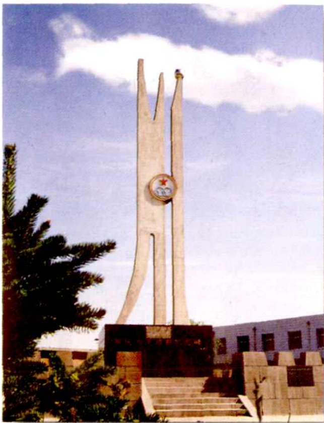
▽ 312 国道与 212 省道永昌叉路口 “战士心中的拥军城”