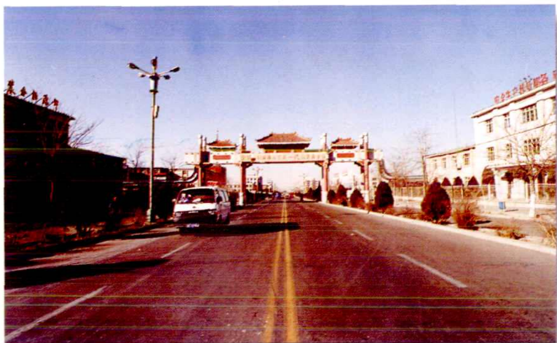
被中宣部确定为全国文明城市建设示范点——金昌市北京路一条街