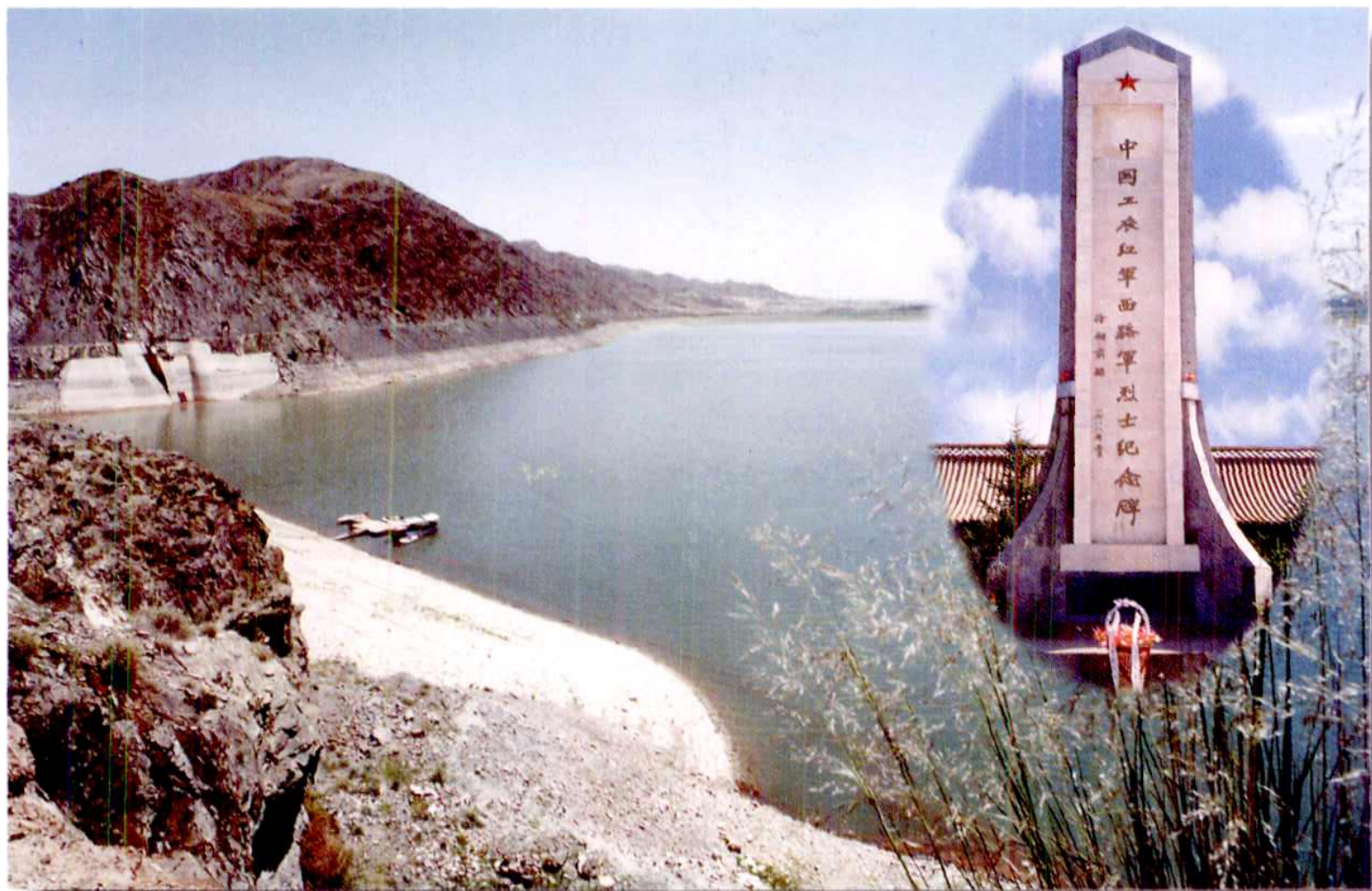
1958年修建的金川峡水库