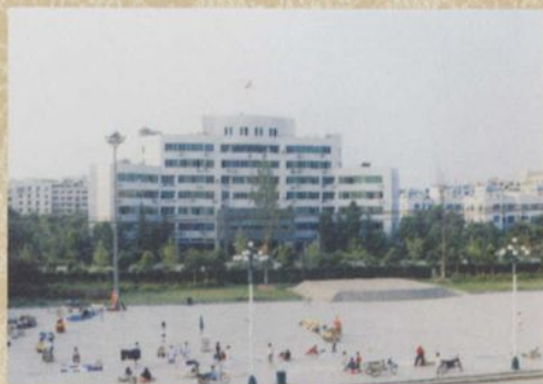
◎ 釜江广场及行政办公大厦