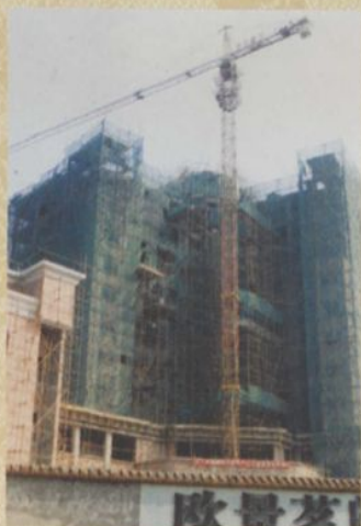
◎ 建设中的林达星级宾馆