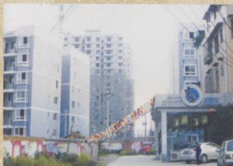
◎ 半岛别院电梯公寓