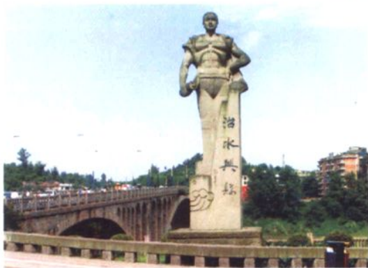
◎东门沱江大桥头雕塑