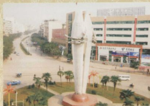
◎ 北湖南路及大转盘富顺之光雕塑