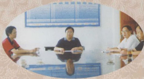
◎局领导班子成员会议