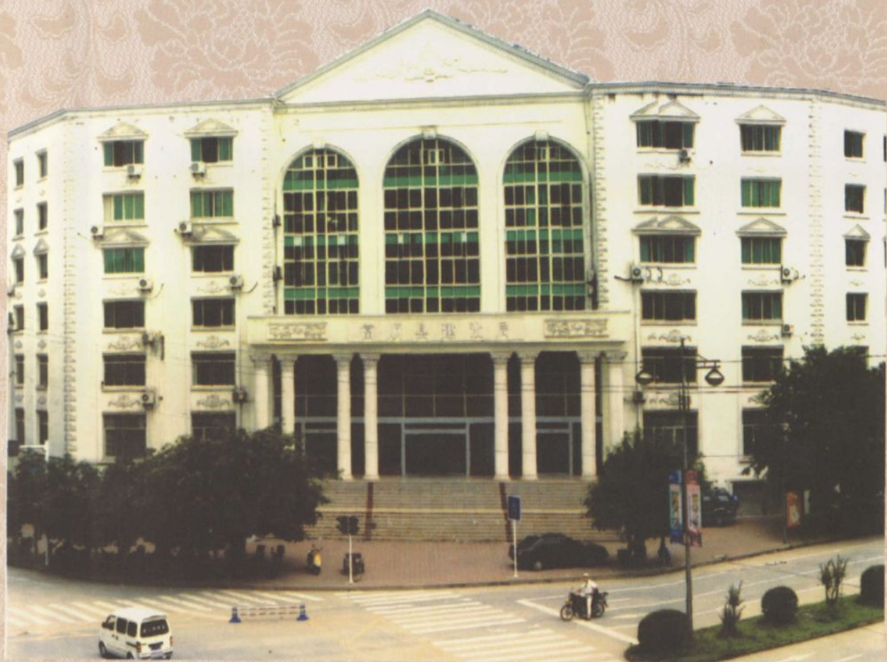
◎ 规划和建设局办公大楼