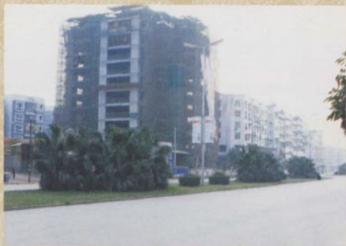
◎ 半岛别院临富洲大道楼