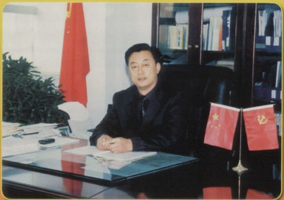
中共乐陵市委书记 杨光来