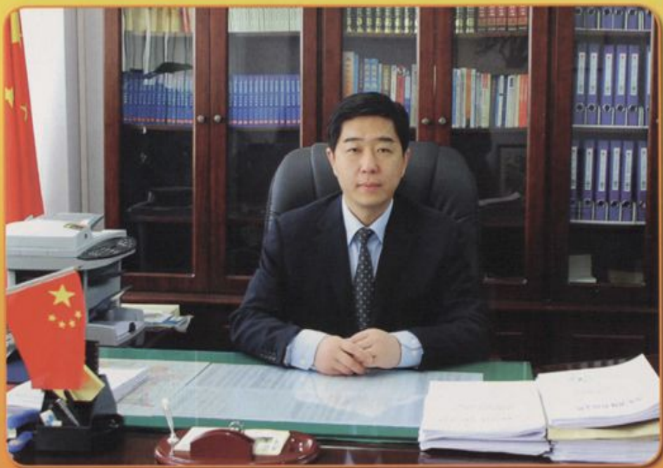
中共乐陵市委副书记 鄂宏达 乐陵市人民政府市长