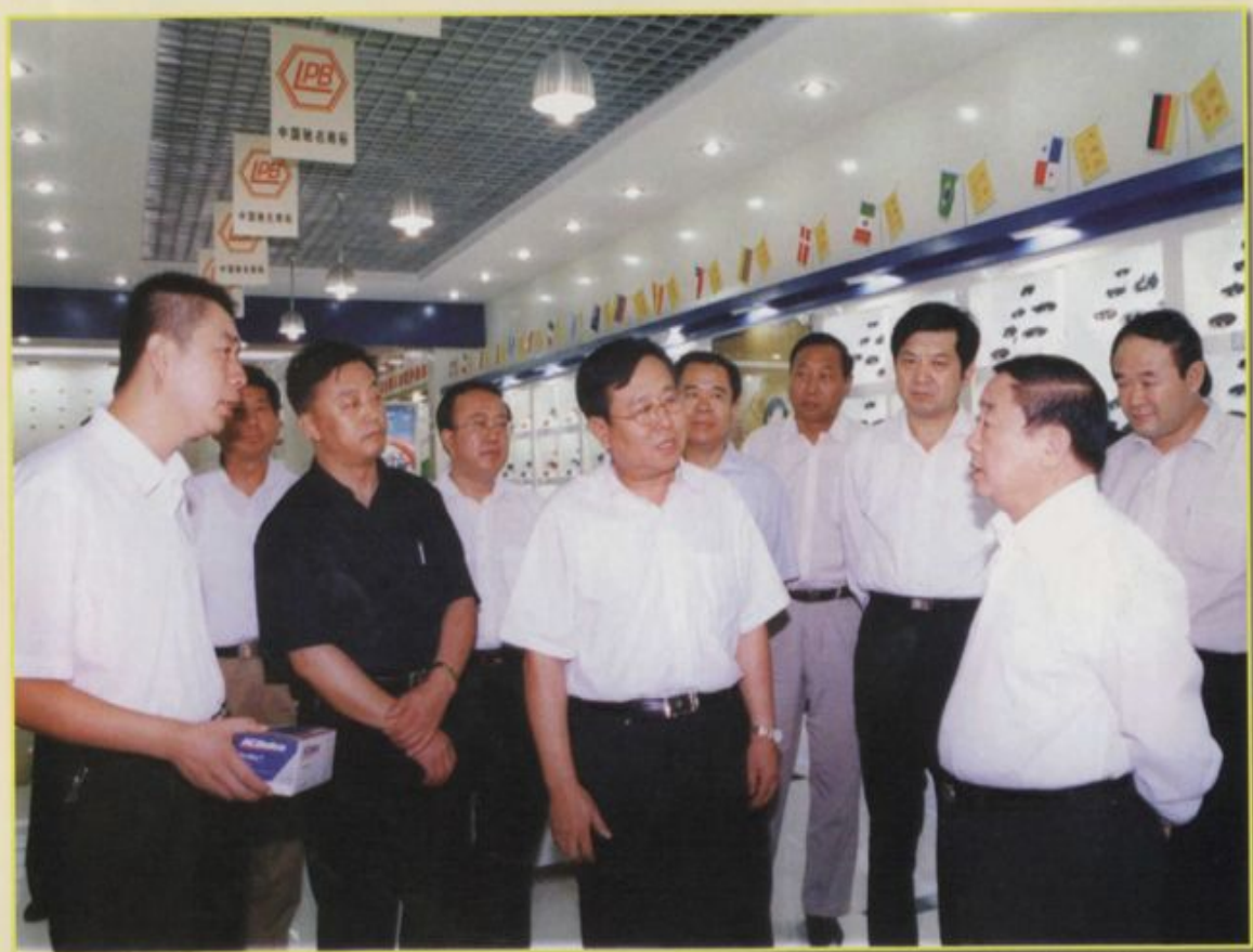
2005年8月17日，中共山东省党委副书记、山东省人民政府省长韩寓群（右二）到金麒麟集团考察