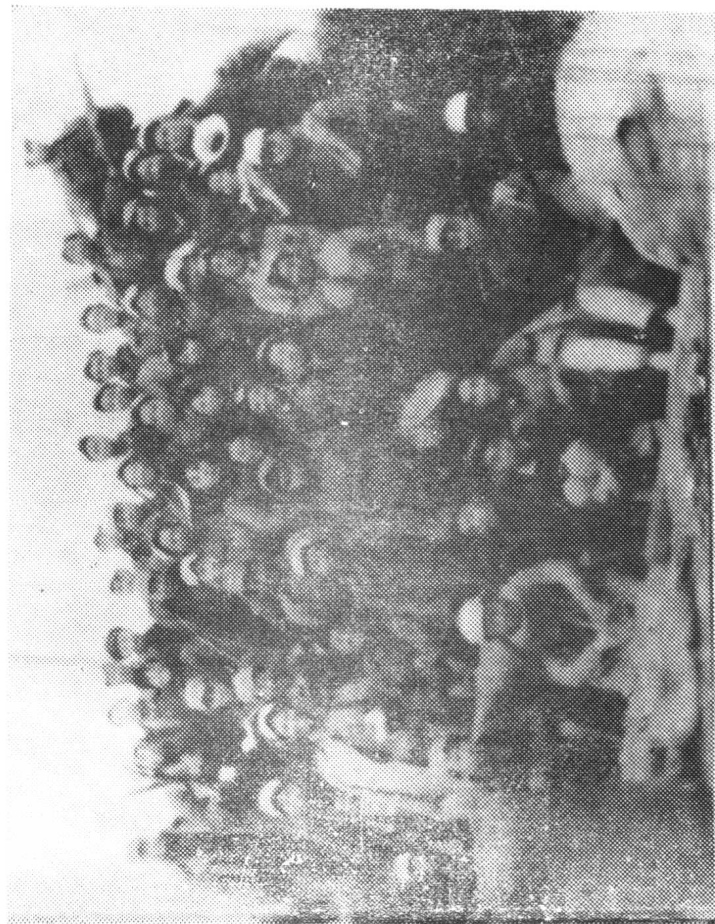
黑龙江省文艺工作团全体合影 一九四八年秋于绥棱县