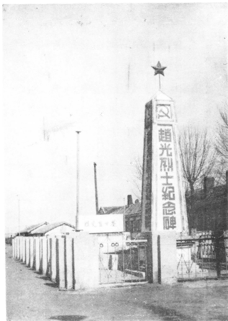
赵光烈士纪念碑全景，建于一九四九年六月， 修于一九八五年八月。