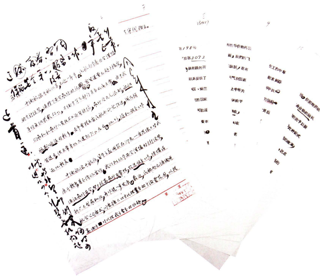
■ 1957年10月5日，国务院总理周恩来在中国民航局《中缅通航一年半的情况报告》上批示：“保证安全第一，改善服务工作，争取飞行正常。”