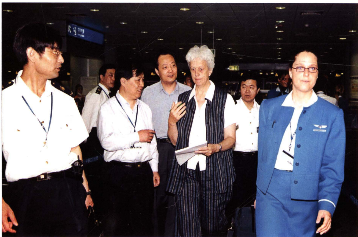
■ 2003年5月25日，世界卫生组织官员检查北京首都国际机场“非典型性肺炎”疫情防控情况