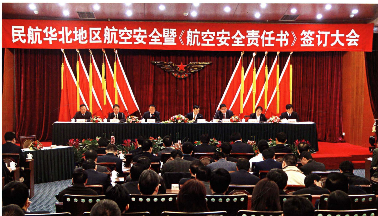
■ 民航华北地区管理局依法行政，加强行业监管，与区内航空企事业单位签订安全责任书，确保区内航空安全。图为2004年航空安全责任书签订大会会场