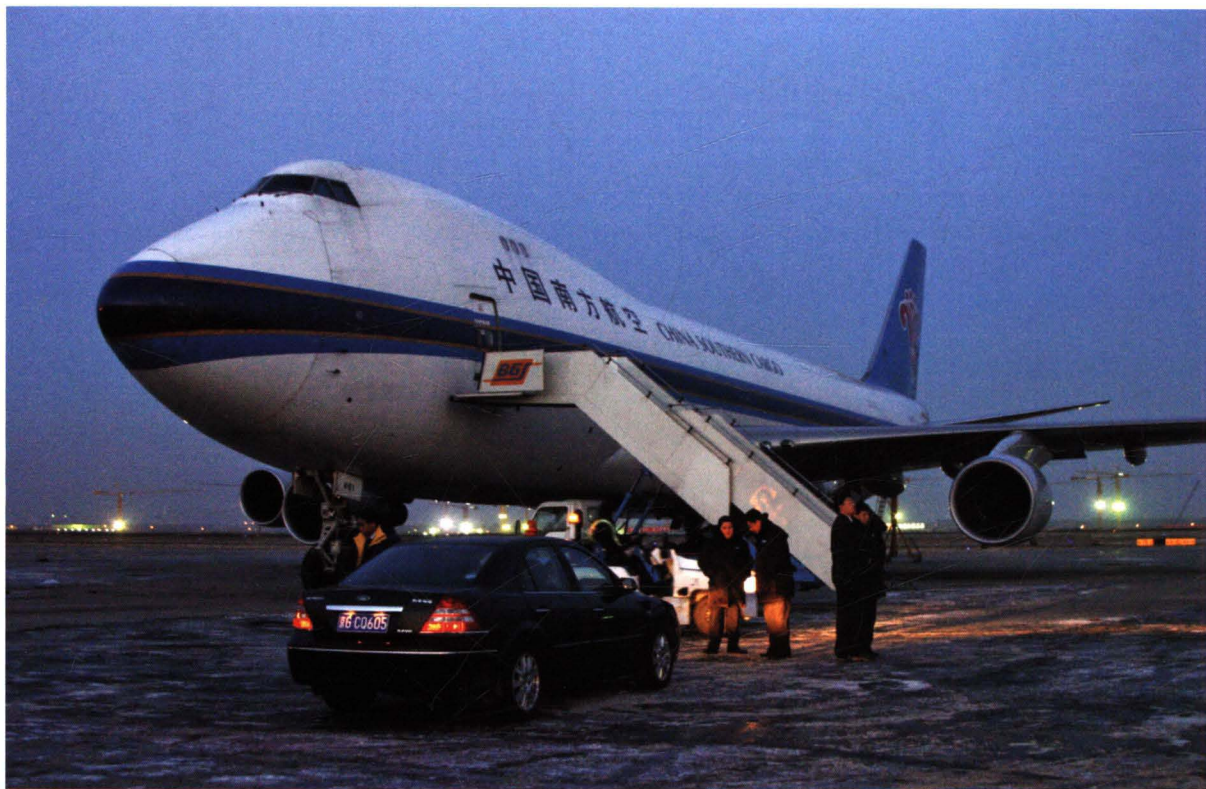
■ 2004年12月26日，印度洋地震海啸重创南亚七国，国际救援规模空前。民航华北地区管理局全力保障中国支援南亚救灾物资的飞机运输。图为12月28日凌晨，民航华北地区管理局保障中国南方航空公司飞机运送救灾物资