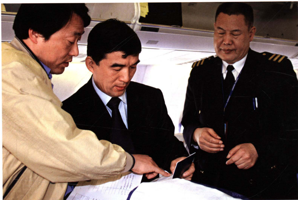
■ 2003年，民航华北地区管理局对重大航空运输飞行机组进行检查