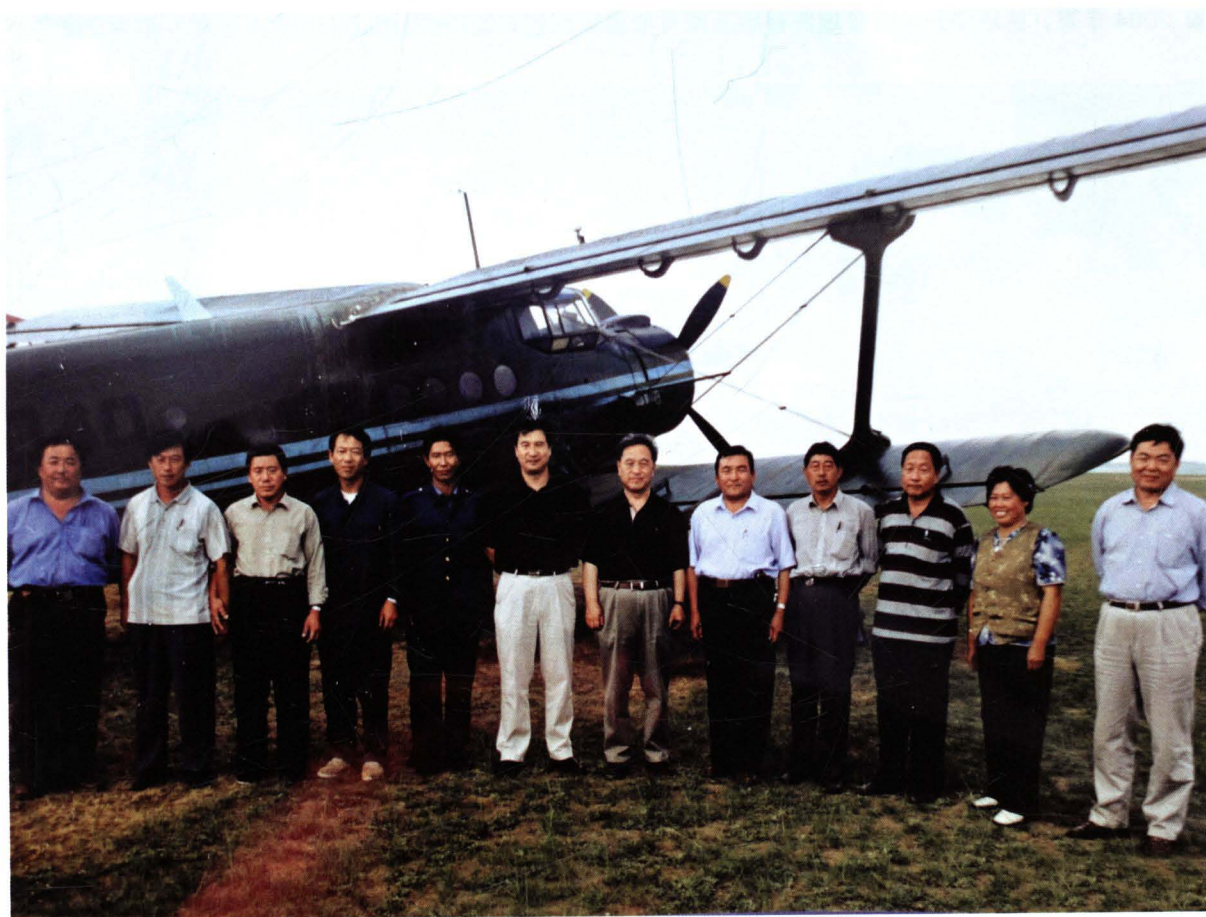
■ 2002年7月24日，民航华北管理局对民航内蒙古区局农牧业飞行进行检查