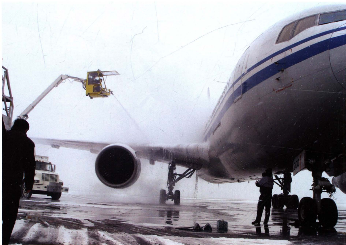
■ 2004年冬，民航华北地区管理局对北京首都国际机场首次定点除冰进行行政检查