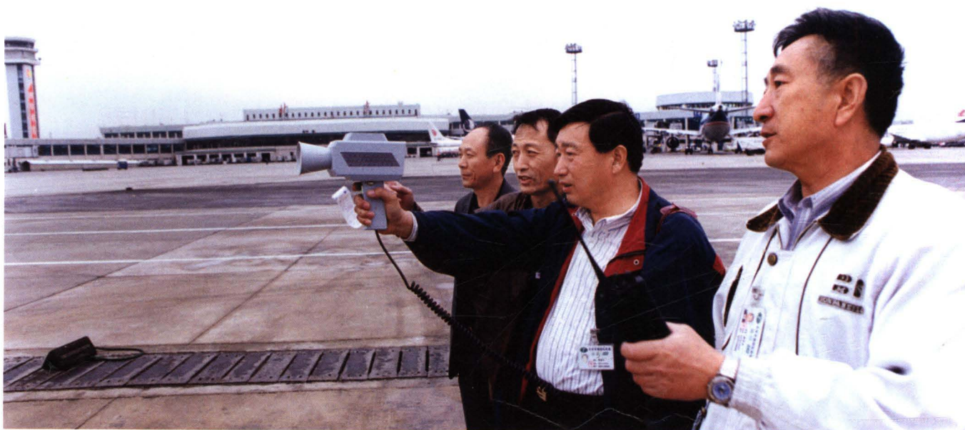
■ 1998年，民航华北管理局对北京首都国际机场停机坪过往车辆进行测速