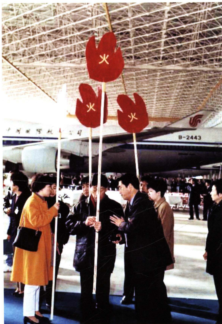
■ 1998年8月，民航华北管理局对中国国际航空公司进行运行合格审定和综合应急演练