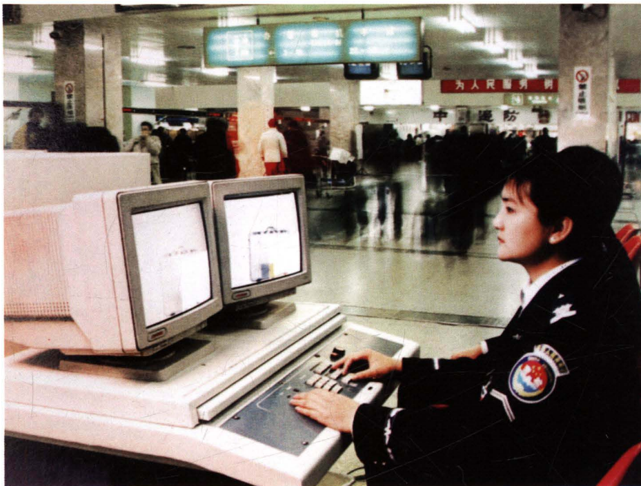
■ 北京首都国际机场安检站对出港旅客、行李及货物进行安全检查监控