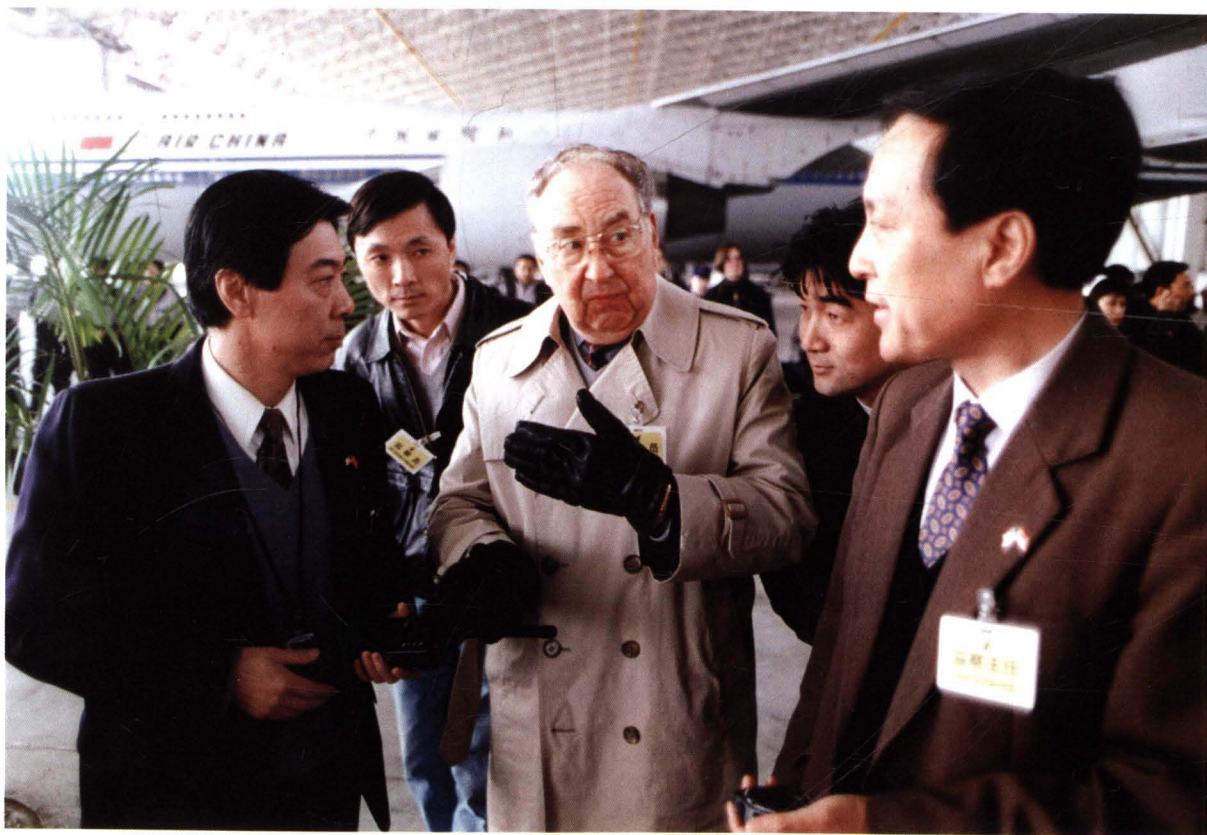
■ 1998年，民航华北管理局对中国国际航空公司进行运行合格审定