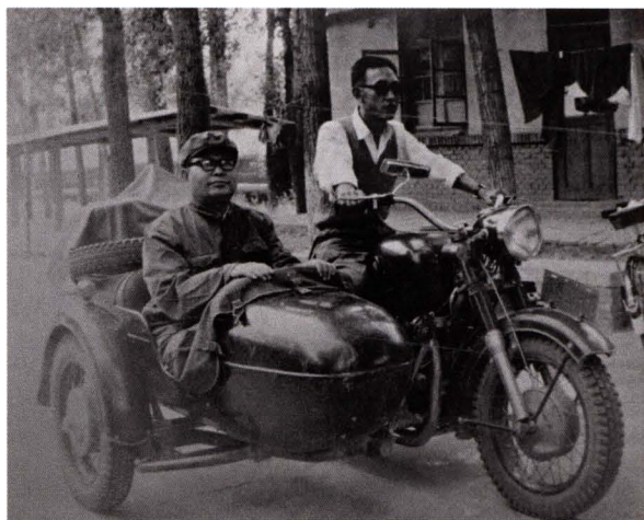
■ 1978年，北京市公安局首都机场分局配备的唯一一辆摩托车用于民警执勤。图为治安民警在民航101厂执勤点