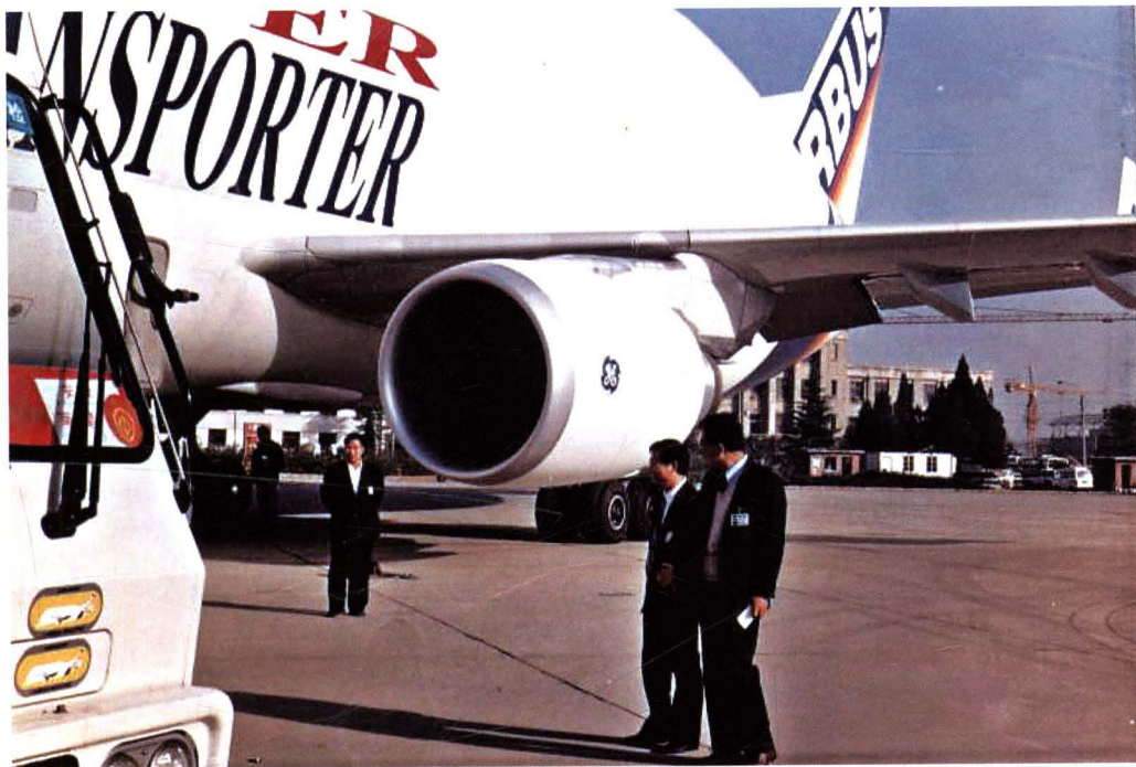
■ 1996年，民航华北管理局对外航飞机进行检查