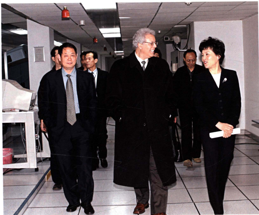
■ 2004年11月8日，国际民航组织（ICAO）秘书长谢里夫（前右二）访问华北民航，在北京首都国际机场2号航站楼（T2）进行考察