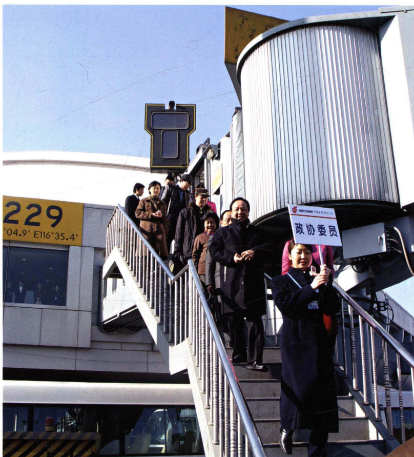
■ 1998年，民航华北管理局全力做好重大航空运输保障工作，安全优质地完成保障“两会”代表专机接送任务