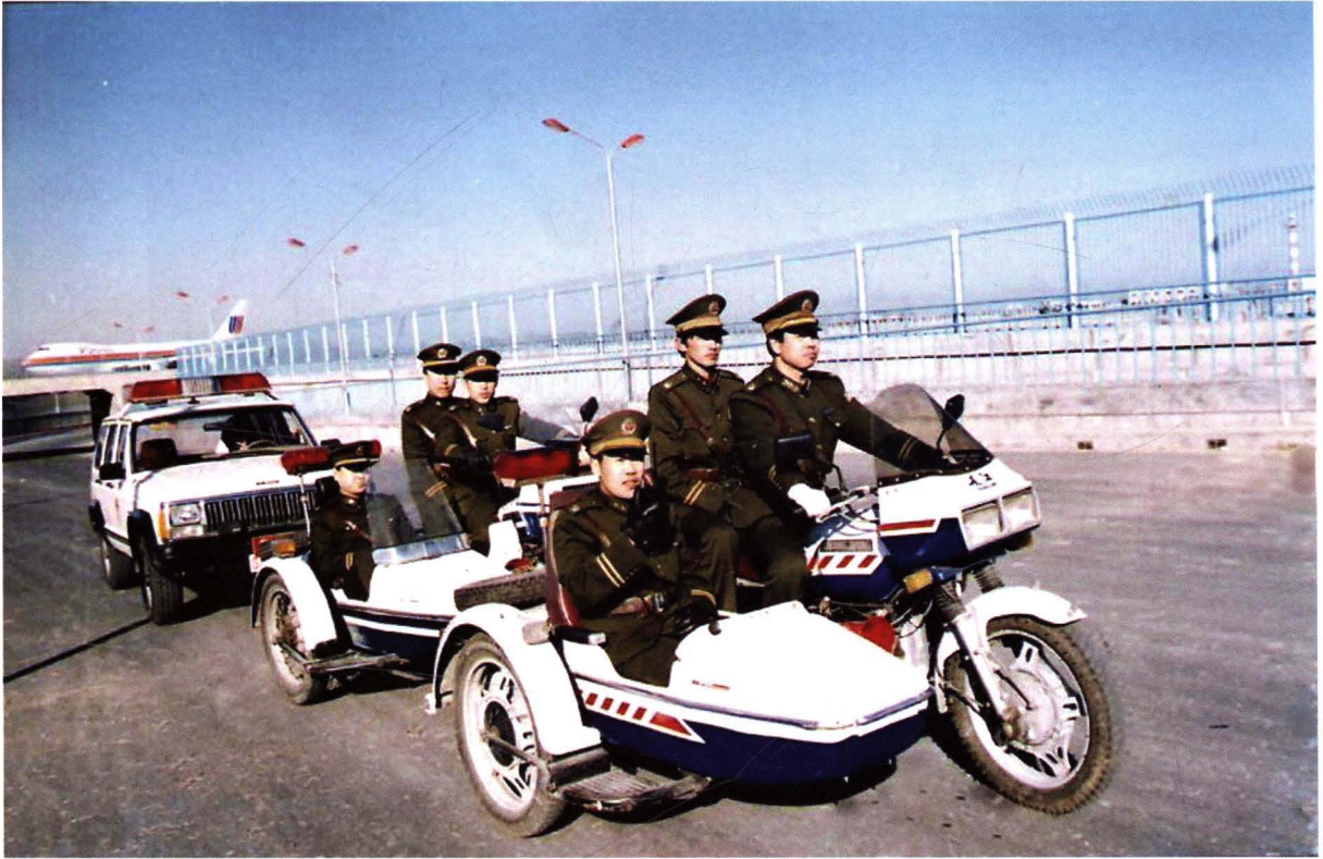
■ 1997年，北京首都国际机场公安分局对飞行区域进行空防巡逻