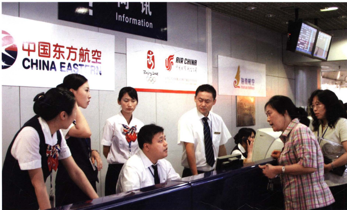
■ 2004年夏，民航华北地区管理局督察北京首都国际机场大面积航班延误