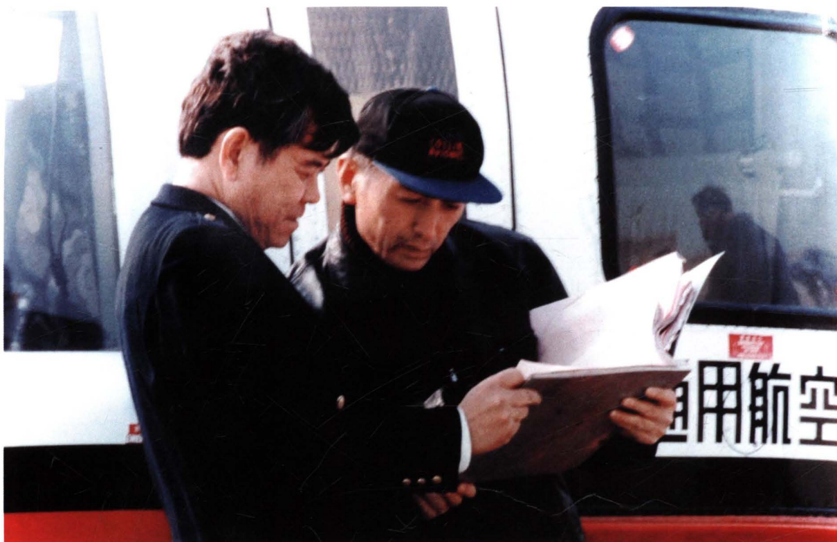
■ 1997年10月，民航华北管理局对中国通用航空公司兴城海上石油基地进行飞行安全检查