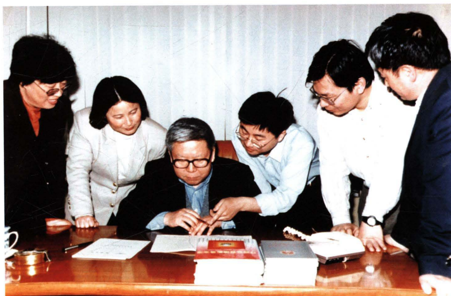
■ 1998年，民航华北管理局加强法制管理，研究制定《民航华北管理局行政处罚实施细则》