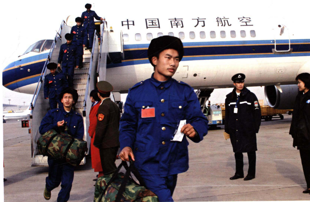
■ 2004年12月20日，民航华北地区管理局协调保障飞机空运新兵到北京