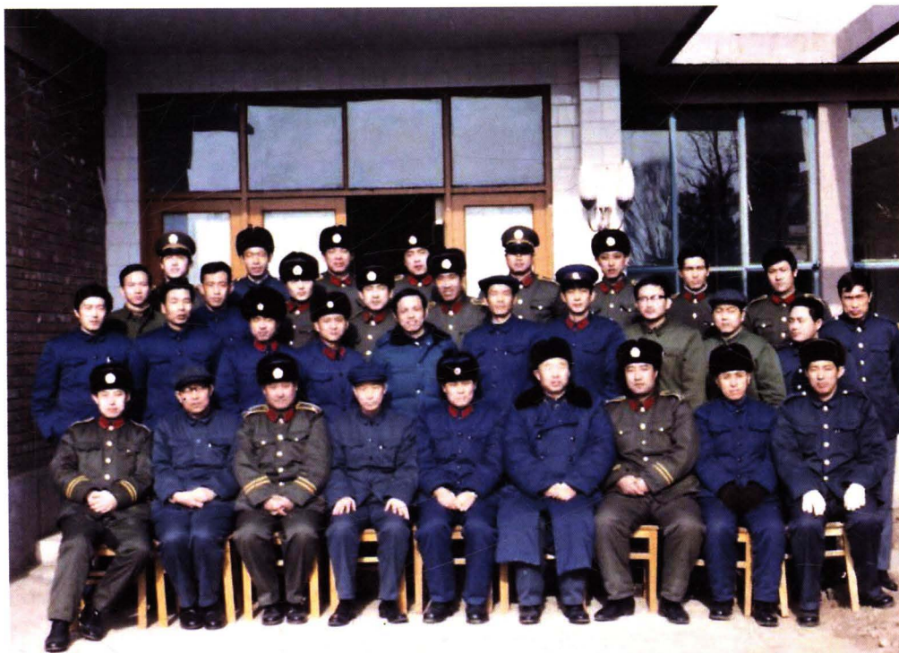
■ 1983年，北京首都国际机场公安人员换上83式绿色警服。图为公安人员着新旧警服合影