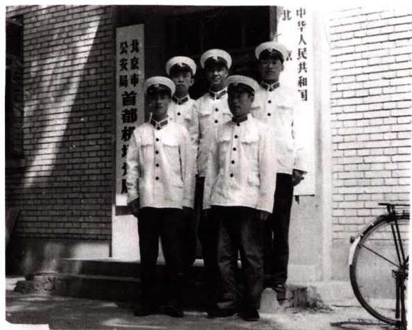
■ 1973年8月30日，国家公安部、中共北京市委、中国民航总局批准成立北京市公安局首都机场公安分局。图为公安民警在首都机场公安分局办公楼前（即小白楼）