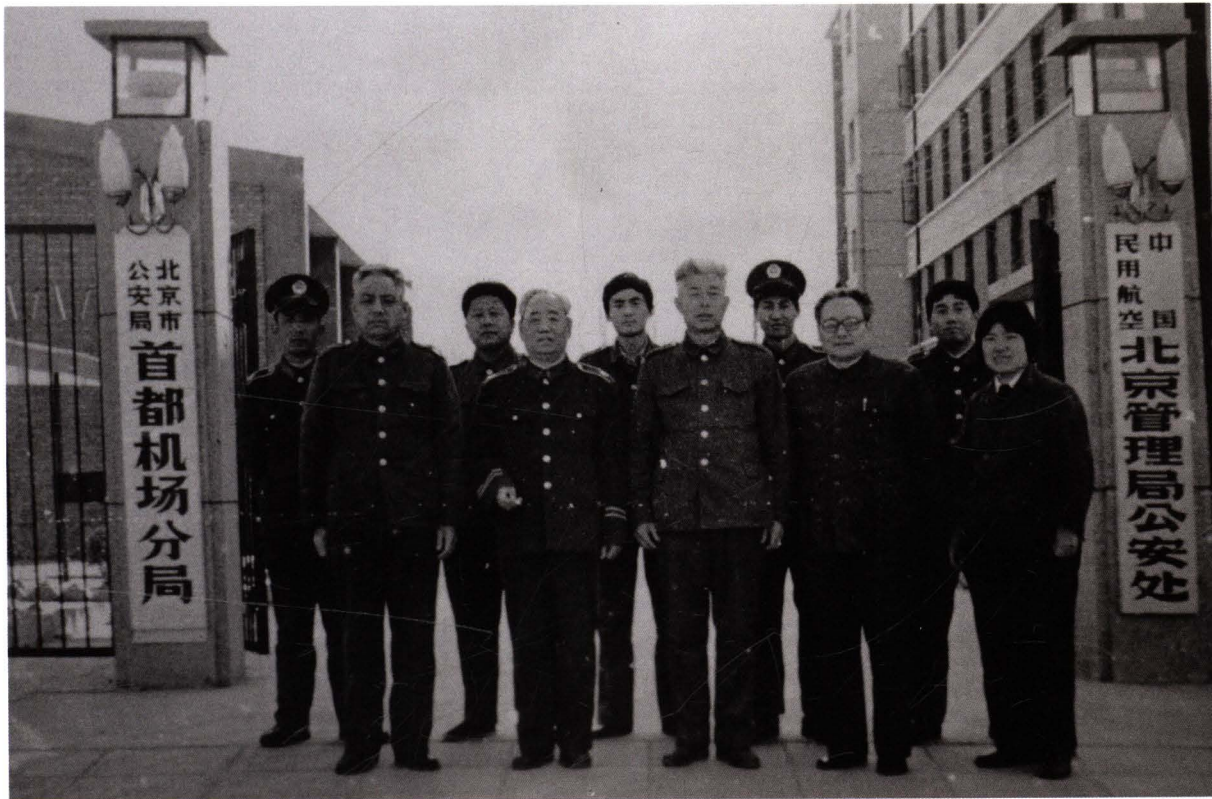
■ 1981年12月24日，中国民用航空北京管理局公安处成立。1983年7月，公安处办公地点由小白楼迁至北京首都国际机场航安路东院。图为民航北京管理局公安处领导与民警合影