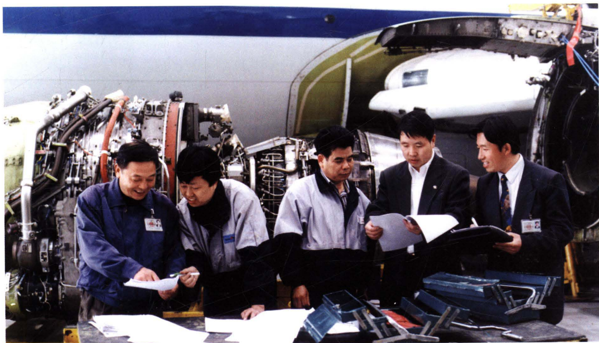
■ 1997年，民航华北管理局对北京飞机维修基地飞机进行适航检查